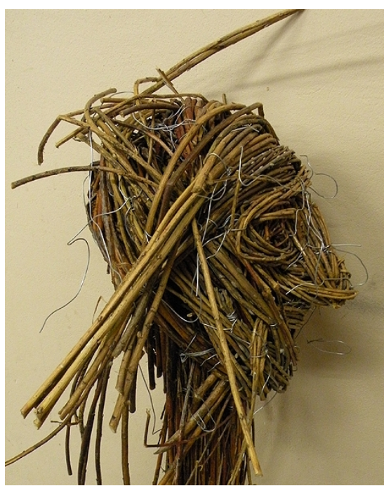
Skica hlavy z vrbového proutí – 45 x 33 x 35 cm, 2012