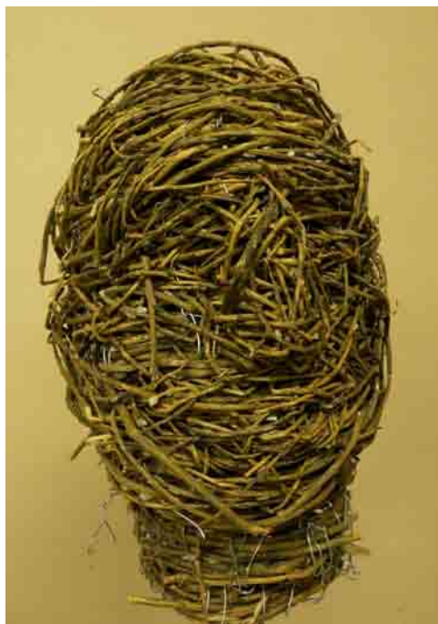
Skica hlavy z vrbového proutí – 40 x 27 x 32 cm, 2012