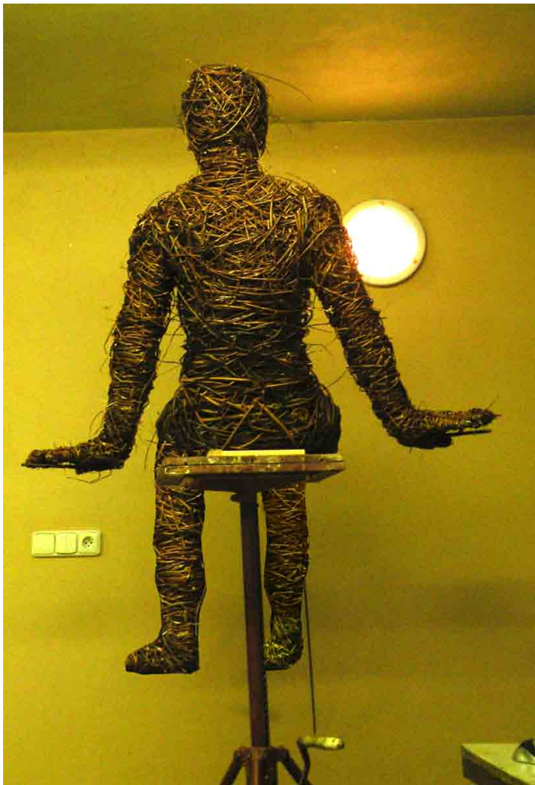
Rekapitulace, socha z vrbového proutí, 180 x 125x 80 cm, 2012

K obhajobě byly předloženy 3 plastiky (1 realizace, 2 dílčí skici)