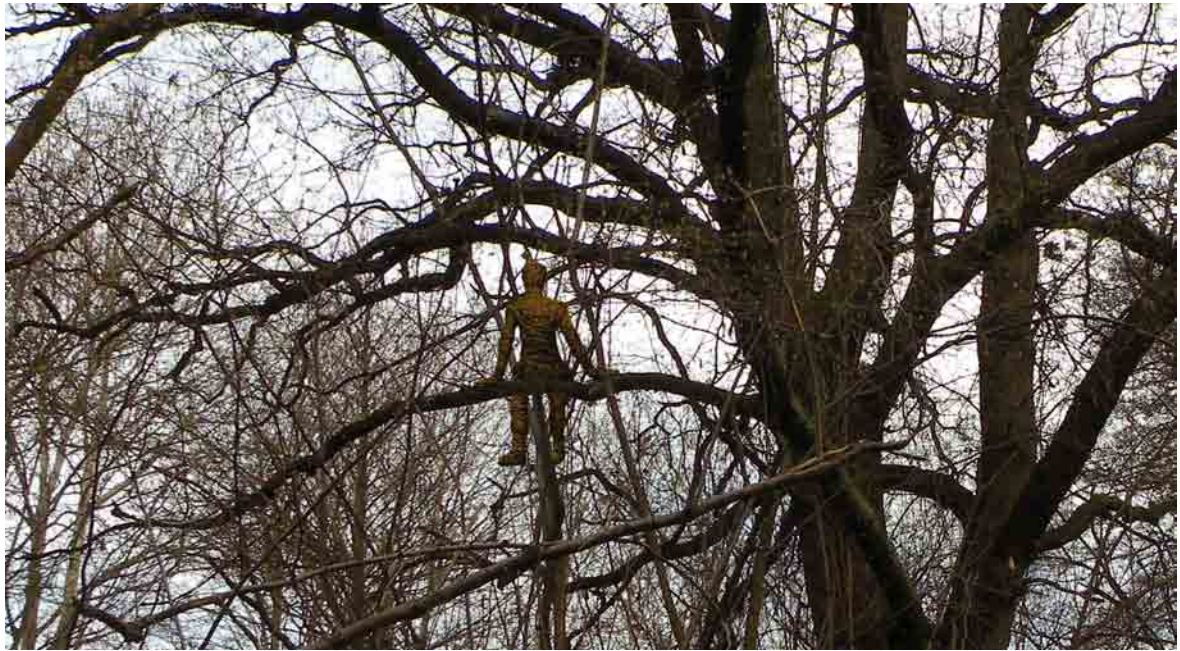
Rekapitulace - vizualizace – umístění sochy do koruny dubu letního - detail