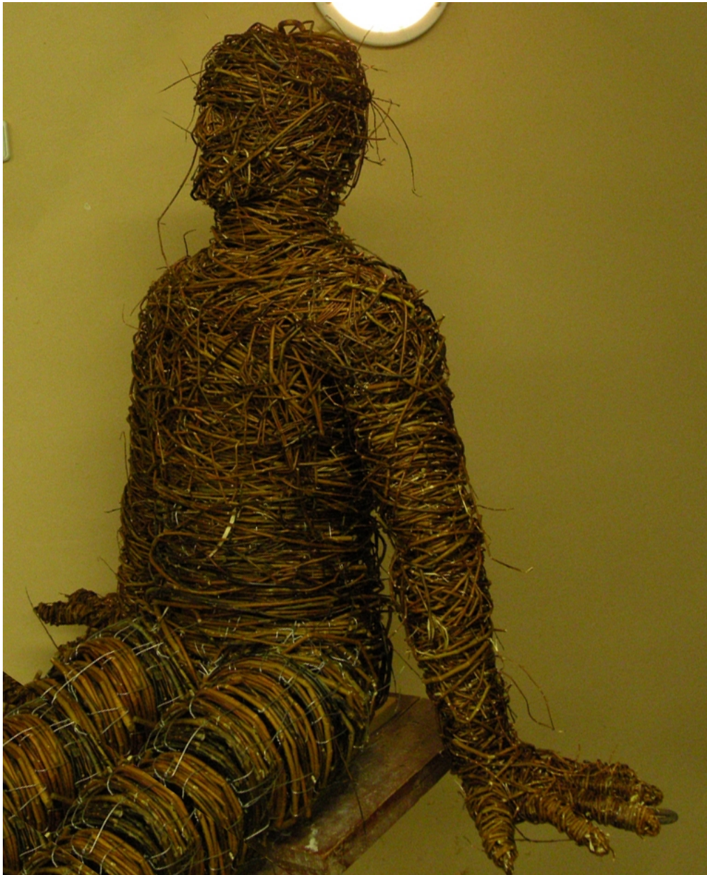
Rekapitulace, socha z vrbového proutí, 180 x 125x 80 cm, 2012