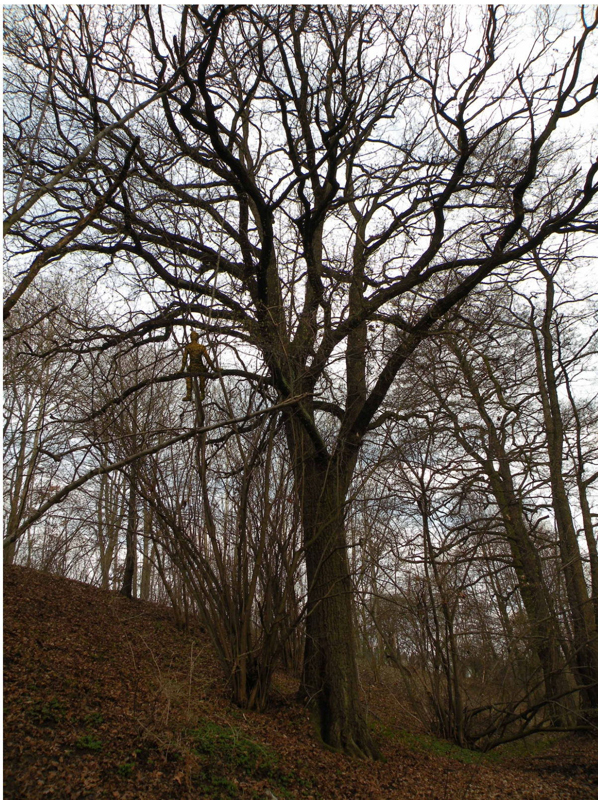
Rekapitulace - vizualizace – umístění sochy do koruny dubu letního – celkový pohled