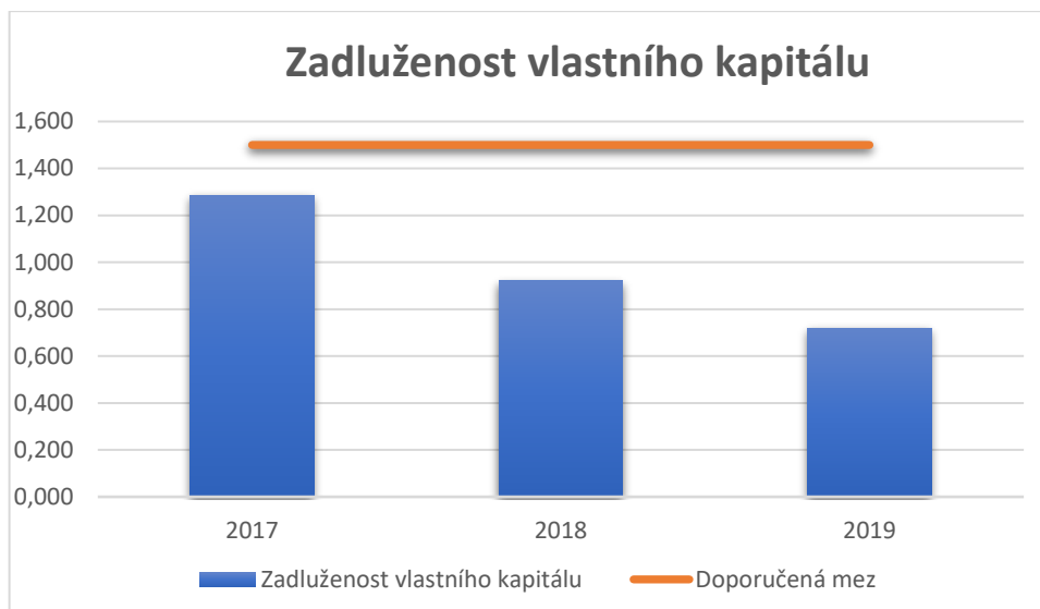
Graf 3 Zadluženost vlastního kapitálu společnosti

Tak jak měl předešlý ukazatel klesající trend, má ukazatel míry finanční samostatnosti rostoucí trend. Jedná se vlastně o převrácenou hodnotu výše uvedeného koeficientu. Minimálně by se měla výše tohoto ukazatele pohybovat kolem 1. Ve zde sledované společnosti však překročily hodnotu 1 až v roce 2018. V roce 2017 činila hodnota 0,779, ale v roce 2019 již činila 1,389. Lze tedy říci, že vlastní kapitál je ve společnosti relativně výrazně zastoupen, což pro financování společnosti z vlastních zdrojů je vhodné. O tomto stavu hovoří i následující graf.