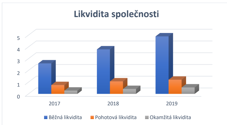
Graf 1 Vývoj ukazatelů likvidity

díky poklesu krátkodobých závazků. Vývoj ukazatelů likvidity je také patrný v následujícím grafu.