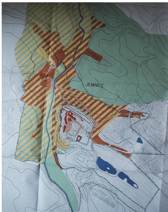
Obrázek 1 – Obraz města v krajině zhotovený pro Jemnici

Souběžně se však zkoumají i hodnoty uvnitř sídla, a to stavební, historické, památkové, občas i kompoziční a autorské. Zajímavým příkladem z praxe tak může být objev návrhu kompozice „nového města“ po italském vzoru navrženým G. B. Pieronim asi v roce 1628 pro hraběte Rambalda Collalta pro Brtnici. Z tohoto návrhu byla provedena pouze úprava kostela vybudovaného původně jako protestantská modlitebna předchozími vlastníky panství pány z Valdštejna. Díky objevenému návrhu byl ozřejměn důvod perforace spodní části věže (mělo jít o součást plánovaného loubí obíhajícího plánované náměstí, které mělo být předprostorem zámku).