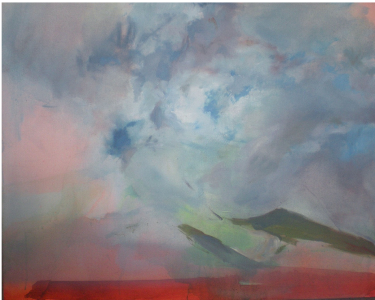
Mrakodlačice – 2014, 100x80cm, akryl na plátně