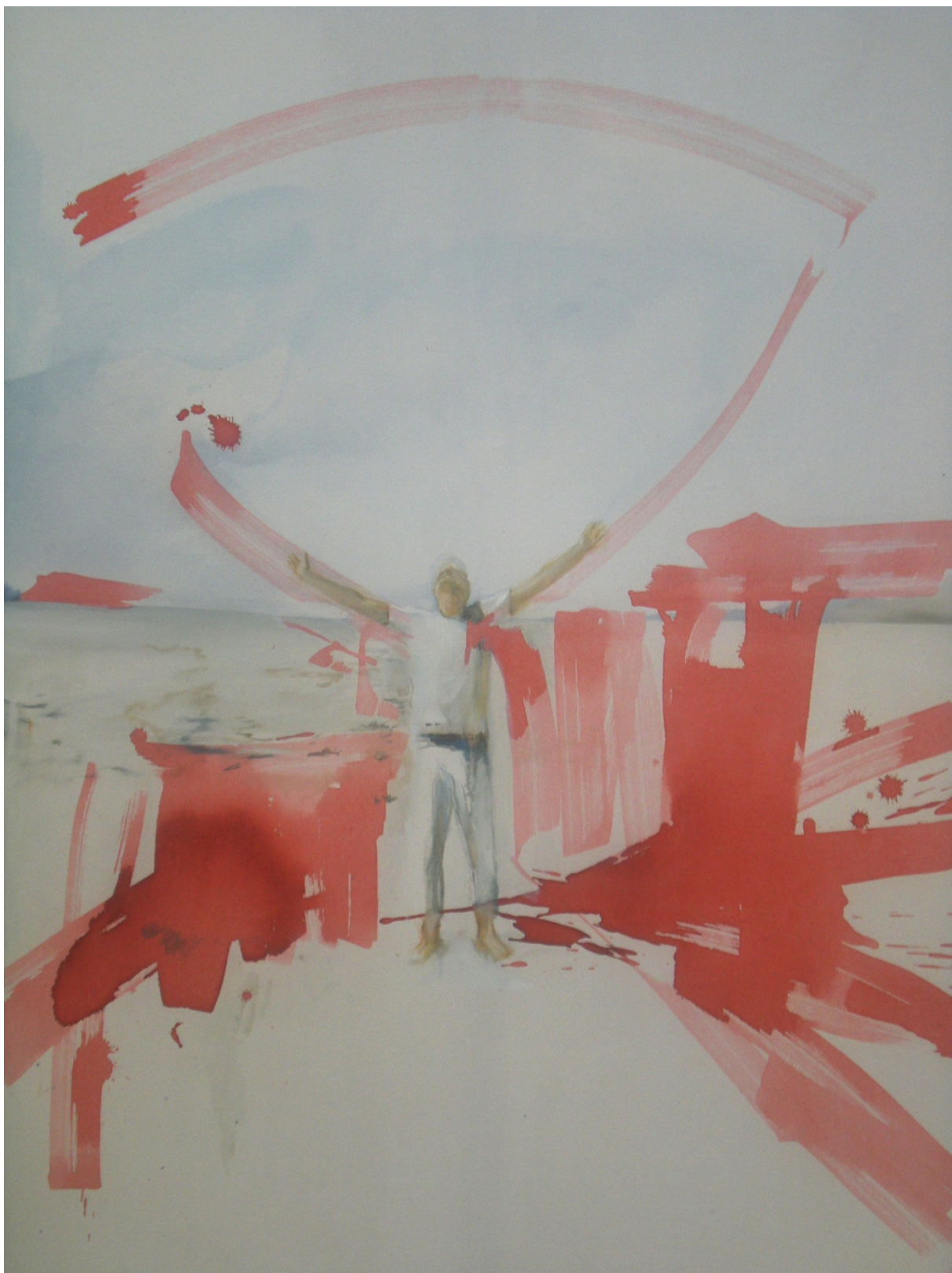
Stav Grálu – 2014, 166x140cm, olejomalba a kryl na plátně