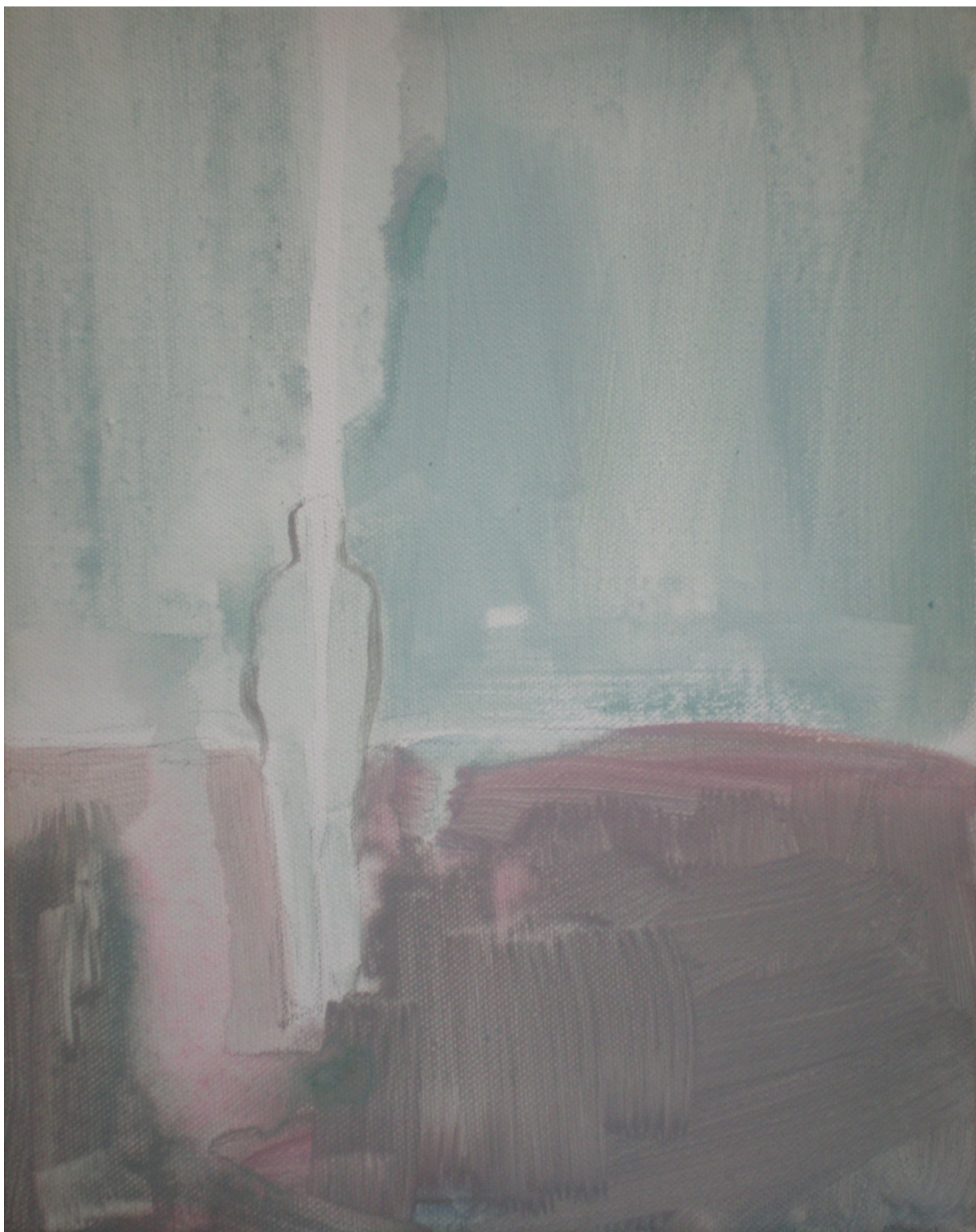
Spojenec – 2014, 30x40cm, akrylová malba na plátno