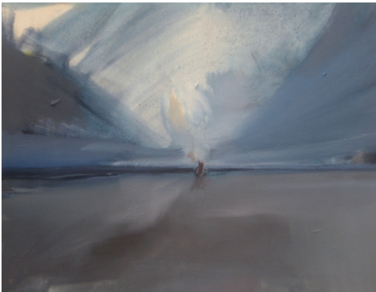
Spojenec u moře – 2014, 40x35cm, olejomalba na plátně