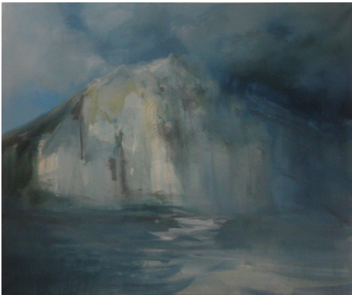
Hora – 2014, 166x140cm, olejomalba na plátně