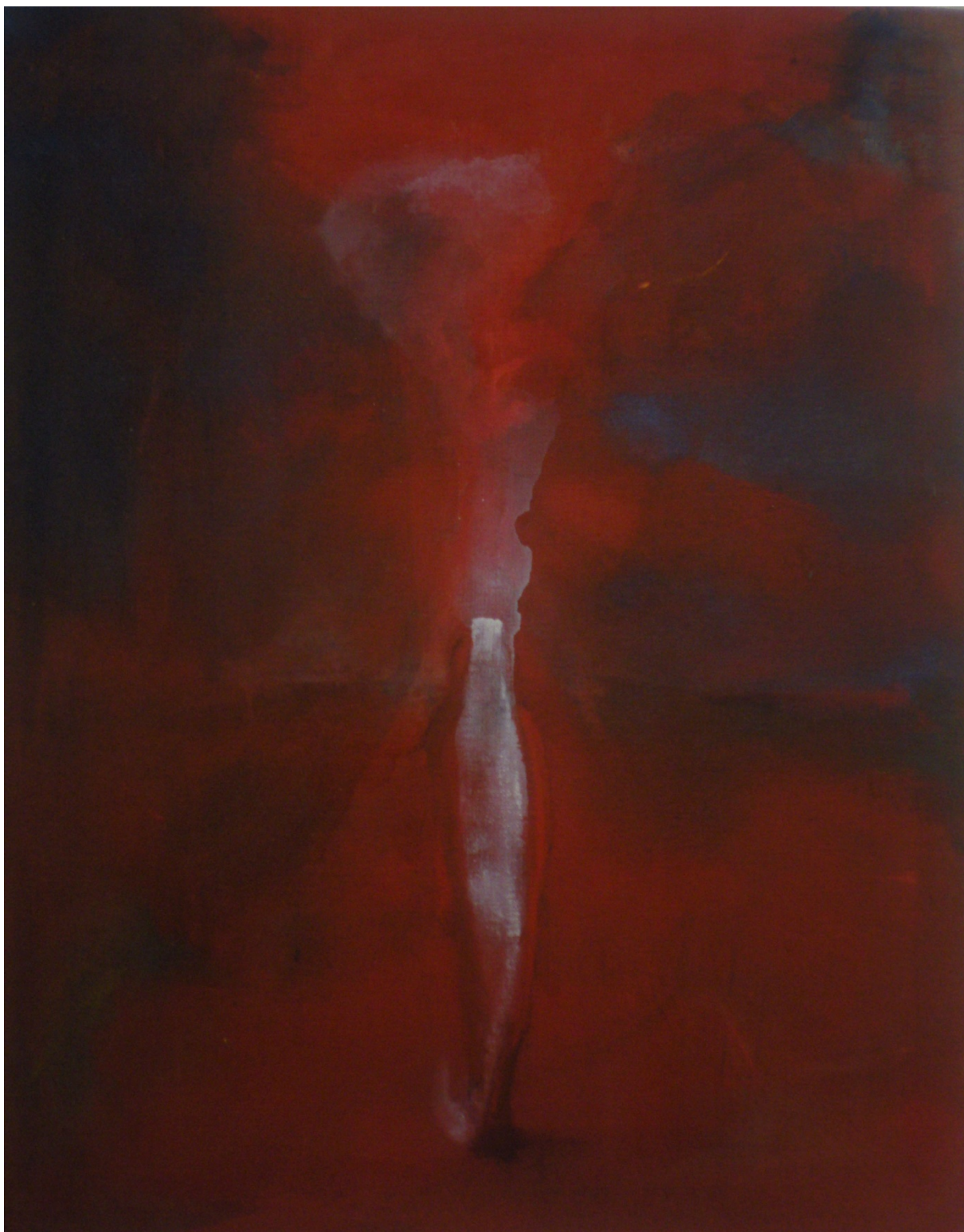
Prorok – 2014, 60x75cm, akrylová malba na plátně,