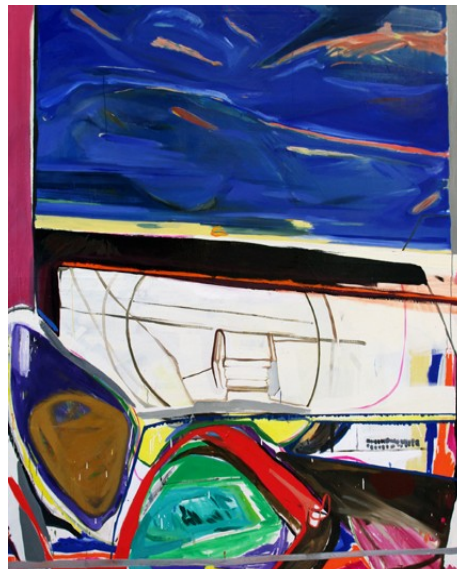
název: Pohled z okna materiál/technologie: Olej na plátně výška x šířka v cm: 200x 170cm rok vzniku: 2010