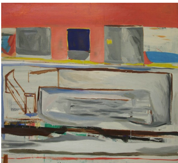
název: Domy materiál/technologie: Olej na plátně výška x šířka v cm: 80 x 90 cm rok vzniku: 2010