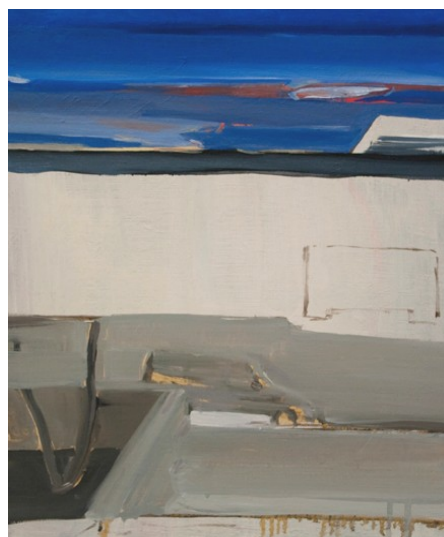
název: Pohled z okna materiál/technologie: Olej na plátně výška x šířka v cm: 44 x 36 cm rok vzniku: 2010