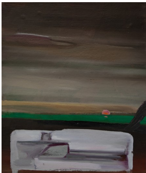
název: Pohled z okna materiál/technologie: Olej na plátně výška x šířka v cm: 35 x 28 cm rok vzniku: 2010