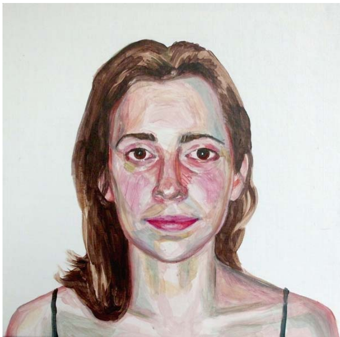
Kasia (studie), akryl na lepence, 35 x 35 cm, 2014