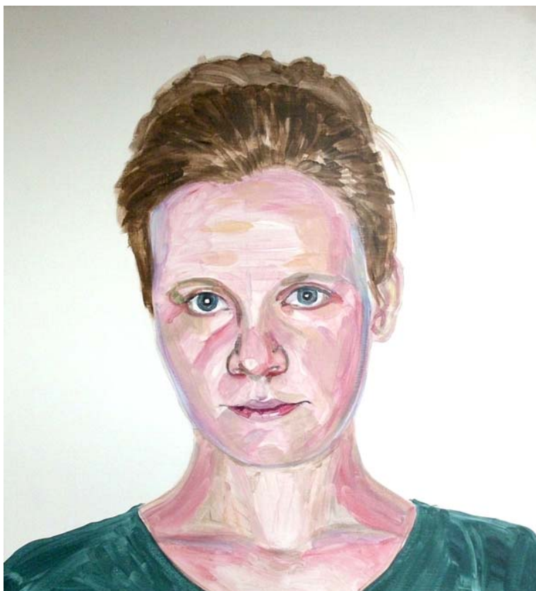
Ivana (studie), akryl na plátně, 60 x 55 cm, 2014