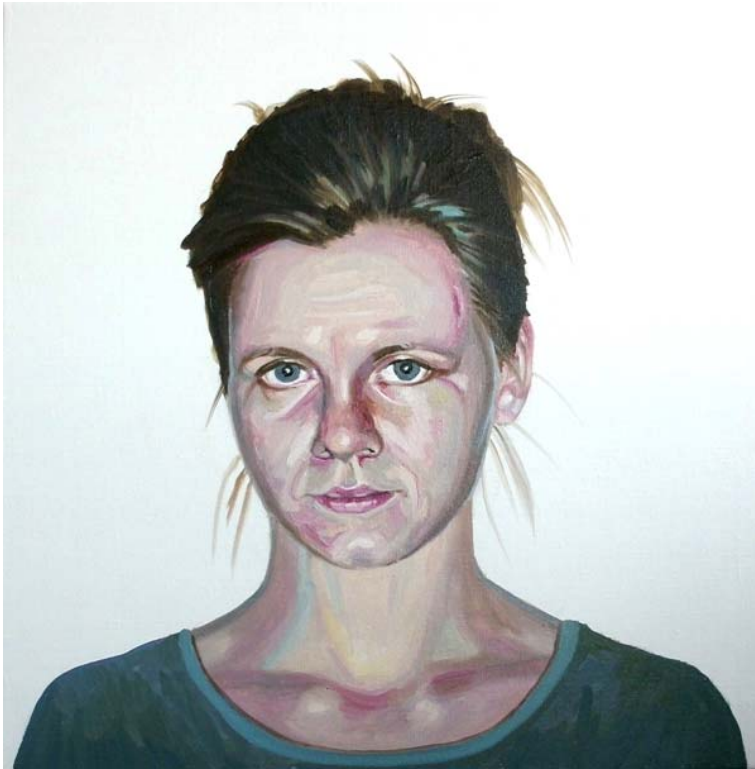
Ivana (studie), akryl na plátně, 45 x 45 cm, 2014