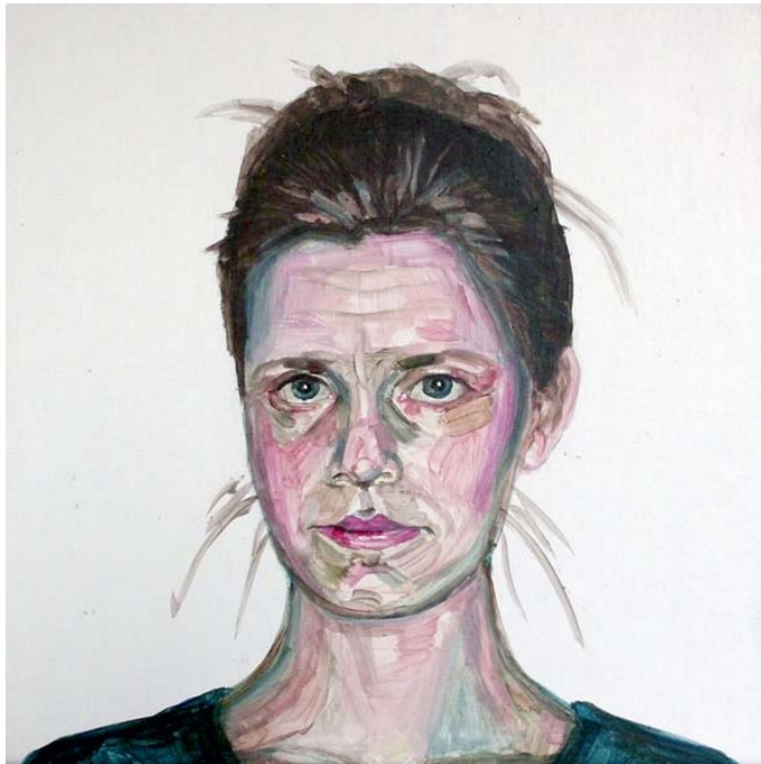
Ivana (studie), akryl na lepence, 35 x 35 cm, 2014

K obhajobě bylo předloženo 11 obrazů (7 studií a 4 realizace).