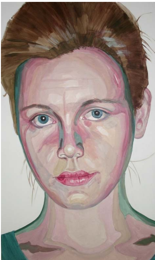
Bez názvu, akryl na plátně, 170 x 100 cm, 2014