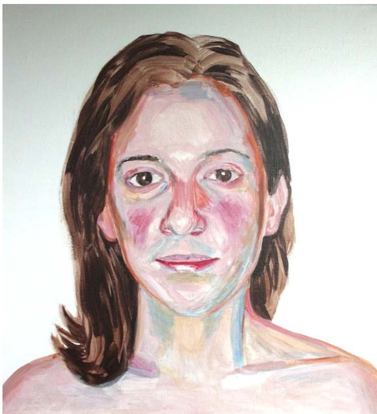
Kasia (studie), akryl na plátně, 60 x 55 cm, 2014