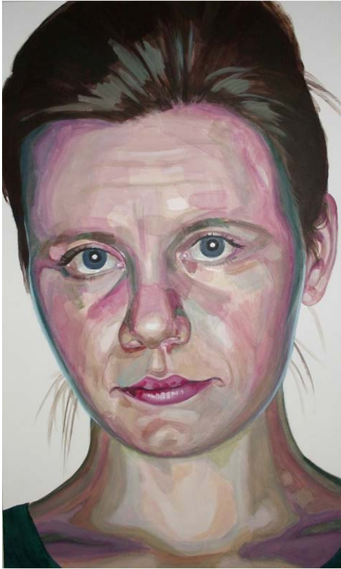
Bez názvu, akryl na plátně, 170 x 100 cm, 2014