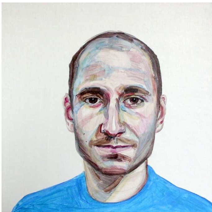
Lola (studie), akryl na lepence, 35 x 35 cm, 2014