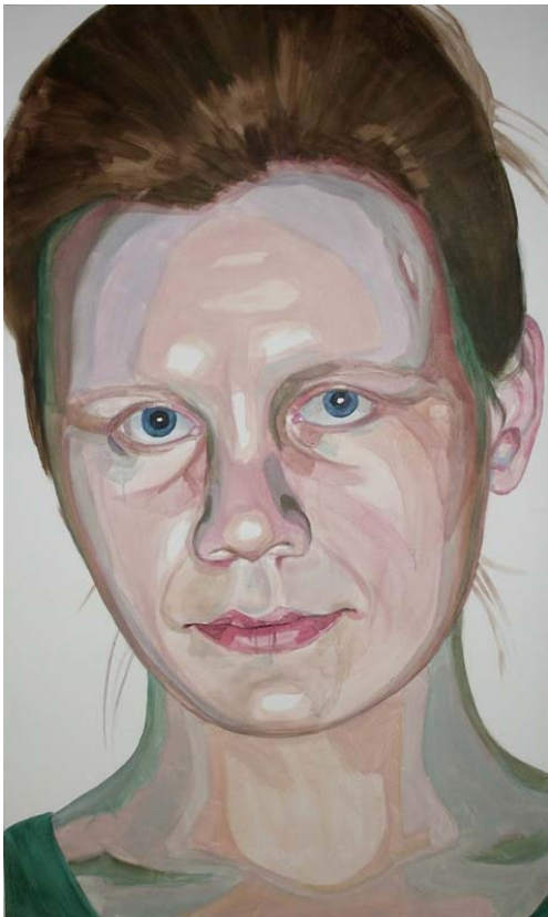
Bez názvu, akryl na plátně, 170 x 100 cm, 2014