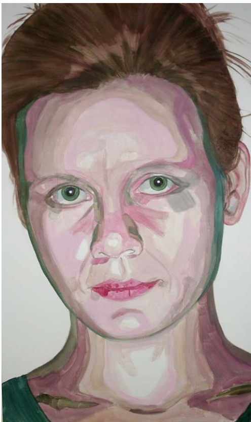
Bez názvu, akryl na plátně, 170 x 100 cm, 2014