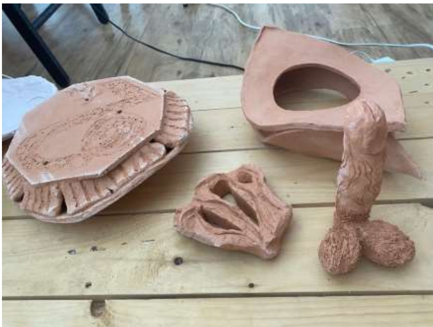
Mág, 7 Disků, Velekněžka a Císařovna, přípravné fáze, keramická hlína, různé vel. (min. 15 x 20 cm), 2022