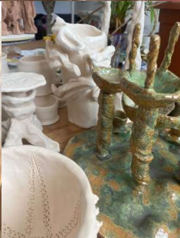
Císařovna, 10 Mečů, 10 Disků, Eso Pohárů , přípravné fáze, keramická hlína, různé vel. (min. 30 x 11 cm), 2022