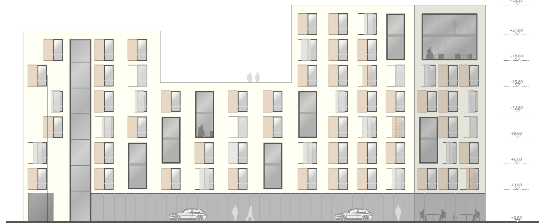
POHLED Z ULICE VÍDEŇSKÁ / 1:266