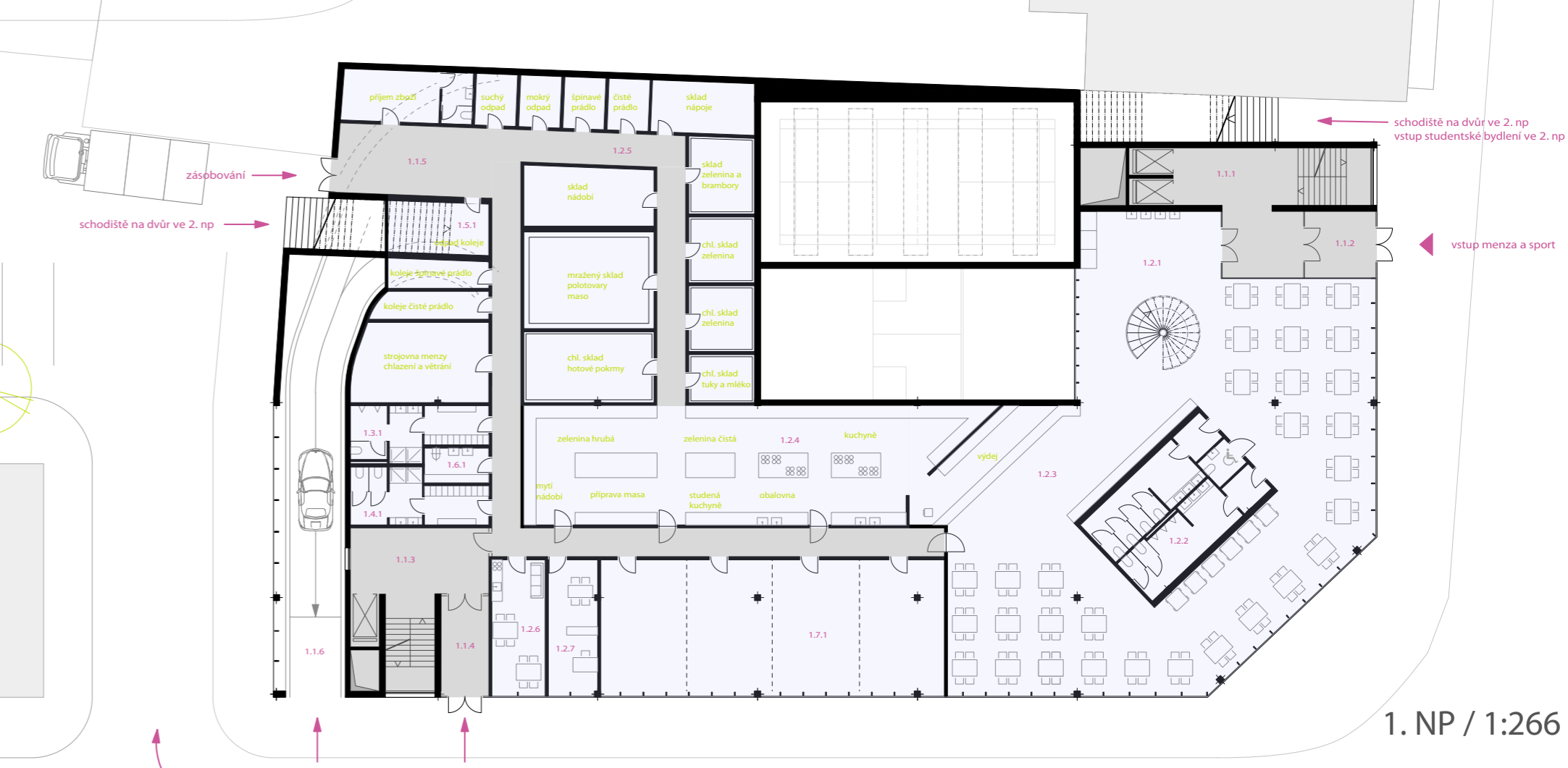
1. NP / 1:266