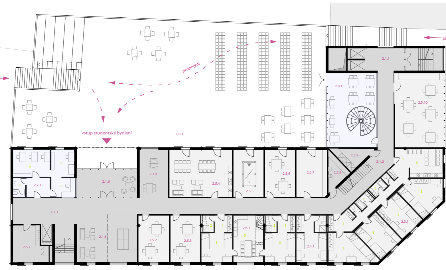
2. NP / 1:266