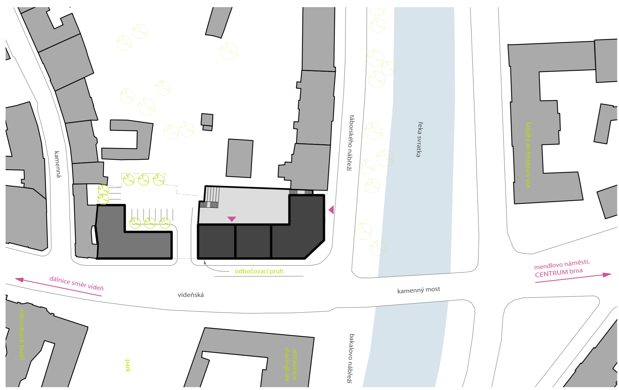
SITUACE / 1:1000