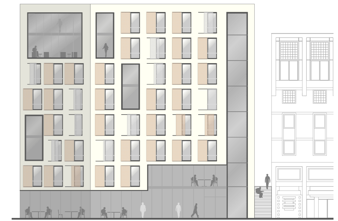
POHLED Z TÁBORSKÉHO NÁBŘEŽÍ / 1:266