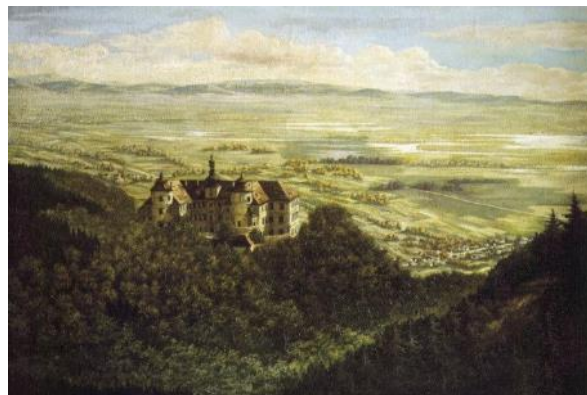
Obrázek 1 – Zámek Jezeří a Komořanské jezero v r. 1882

Souvislá vodní plocha svou plochou přesahující 56 kilometrů čtverečných vzniká před více než 15 000 lety [2; s. 8], svou rozlohou bylo tedy území téměř shodné s plochou dnešního velkolomu ČSA a jeho bezprostředního okolí, která se pohybuje kolem 51 kilometrů čtverečných. O podobě historického jezera se do dnešních dnů nedochovalo mnoho informací či obrazové dokumentace, Jedním z nejstarších vyobrazení jezera, ovšem již v období jeho postupného zániku, je pohled odkudsi ze svahů Krušných hor nad zámek Jezeří (Obr. 1), přibližně v místech, kde se dnes nachází ikonická vyhlídka nabízející pohled na zámek i s měsíční krajinou a souvisejícími industriálními provozy pod ním.