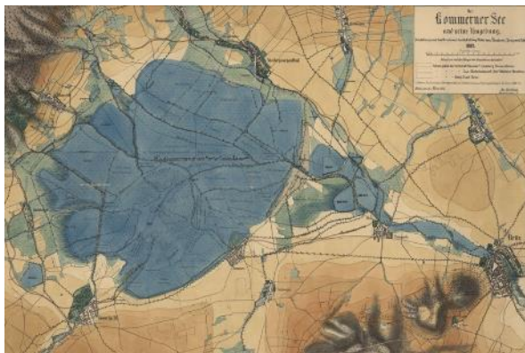
Obrázek 2 – Podoba Komořanského jezera v r. 1882

z Lobkowicz, knížete sídlícího na jezeřském zámku, k úplnému vysušení vodní plochy [3; s. 10-12] a definitivní proměně na zemědělsky využívané území. Rozparcelování celé plochy je již patrné na Indikačních skicách stabilního katastru, které jsou pro jednotlivé sídelní útvary (například Albrechtice u Mostu, Komořany u Mostu, Ervěnice u Mostu nebo Dřínov u Komořan) na ploše dnešního velkolomu ČSA datovány do roku 1842. Jistou zajímavostí je tak výše vložený obraz krajiny pod Jezeří (Obr. 1), datovaný do roku 1882, kdy již mělo být jezero vysušeno, jak uvádí kromě zmíněných indikačních skic i mapy, taktéž z 80. let 19. století (Obr. 2), zachycující již transformované území s jednotlivými poli a sídly propojenými cestní sítí, kde je přes území schematicky naznačena plocha dřívějšího jezera [2].