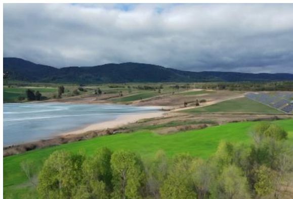
Obrázek 6 – Návrh budoucí podoby lomu ČSA

Budoucnost vodního režimu na ploše velkolomu ČSA bude zcela jistě ovlivněna realizací koncepcí, souvisejícím mimo jiné s plánovaným energetickým (a v menší míře i rekreačním) využíváním celé plochy. Oblast nového Komořanského jezera a svahy na severozápadním okraji lomu budou dle některých úvah podléhat režimu přísnější ochrany přírody jako národní přírodní památka [15], jiné navrhují využití vodní plochy jako spodní nádrž přečerpávací vodní elektrárny s horní nádrží nacházející se v místech budoucí CHKO Krušné hory [17][18]. Zda bude nynější transformace území poslední významnou proměnou, která zde bude uchována po další staletí, či zda dojde v příštích desetiletích k dalšímu turbulentnímu vývoji, zůstane ještě dlouhou otázkou.