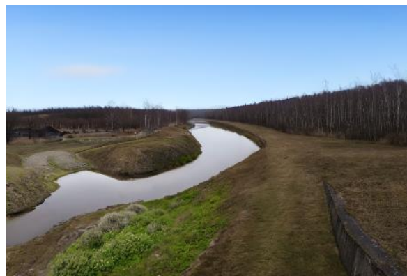
Obrázek 5 – Návrh obnovy Bíliny - diplomová práce

Před jistou realizací se naopak nachází plán otevření koryta řeky Bíliny, která je přes 40 let na úseku přes 3 kilometry dlouhém mezi Ervěnicemi a Komořany u Mostu zatrubněna. Mezi lety 2025–2027 by mělo dojít k obnovení otevřeného meandrovitého koryta (v délce cca. 4,7 km) včetně úpravy břehů a zajištění omezení průtoků z nového koryta do níže položených částí bývalého velkolomu [14]. Součástí těchto úvah je nicméně, dle dostupných informací, plán uchování veškerého průtoku v korytě Bíliny a neodklánění jeho části nebo většiny do obnovovaného Komořanského jezera. Kvůli významnému zásahu těžby do terénního reliéfu zdejší krajiny již bohužel nikdy nemůže dojít k obnovení rozsáhlého jezera, které by bylo napájenou řekou Bílinou a která by z něj následně odtékala a pokračovala směrem na Ústí nad Labem. Nové Komořanské jezero tak bude s velkou pravděpodobností napájeno především spodní vodou s několika drobnějšími přítoky, kdy se tak bude jednat o bezodtokovou vodní plochu, podobně jako v případě jezera Most.