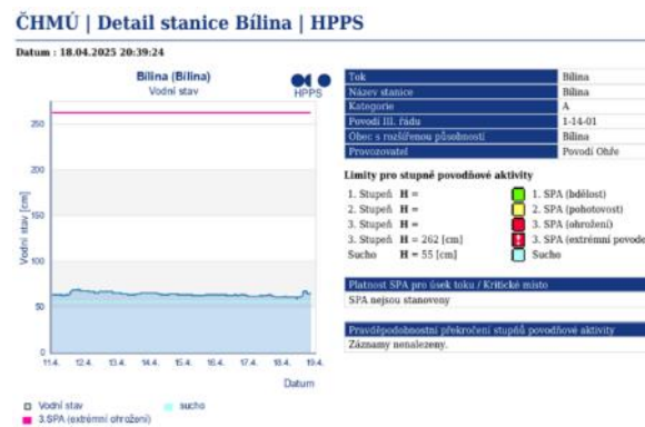
Obrázek 4 – Detail měřicí stanice Bílina – HPPS ČHMÚ

I přesto je hladina řeky velmi nízká, řeka má v nejbližší měřicí stanici, nacházející se ve stejnojmenném městě (Bílina) stanovenou pouze hladinu sucha (55 cm) a hladinu 3. stupně povodňové aktivity