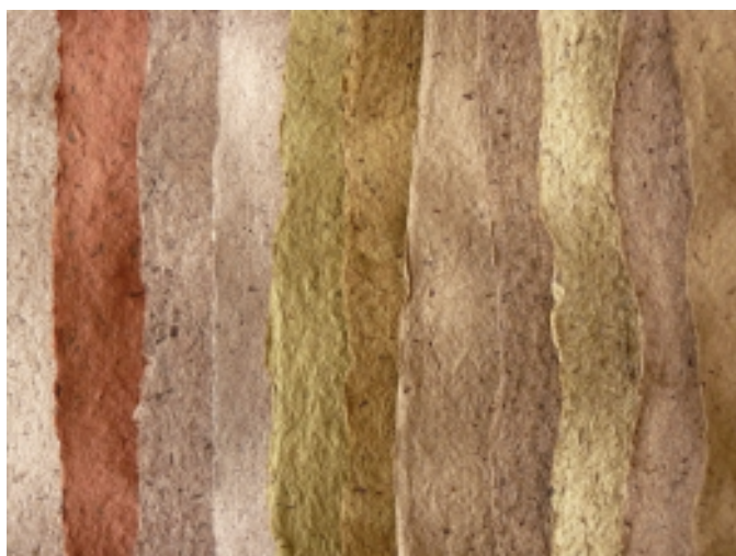
název: Uncommon papers materiál/technologie: Autorský ruční papír. výška x šířka x hloubka v cm: Detail - barevná škála. rok vzniku: 2010