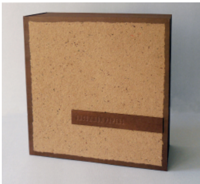
název: Uncommon papers - kazetové pouzdro k uložení autorských ručních papírů. materiál/technologie: Autorský ruční papír, lepenka, sulfát, slepotisk. výška x šířka x hloubka v cm: 40 x 40 x 16 cm. rok vzniku: 2010