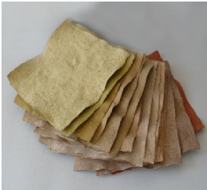
název: Uncommon papers materiál/technologie: Autorský ruční papír, 16 archů. výška x šířka x hloubka v cm: cca 38 x 38 cm (jeden arch). rok vzniku: 2010