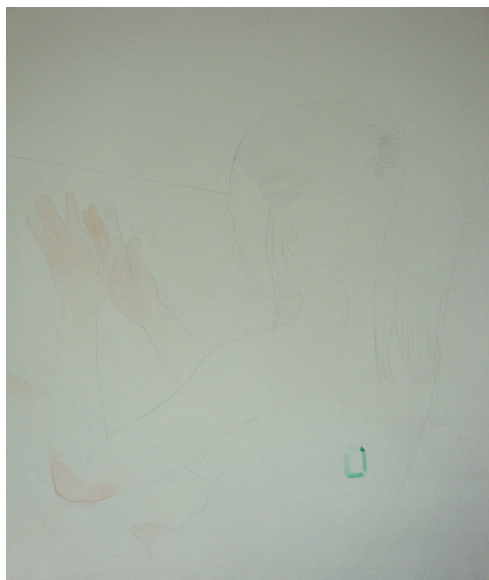
název: Bez názvu-detail materiál/technologie: Kolorovaná kresba na plátně výška x šířka v cm: 100x280 rok vzniku: 2009