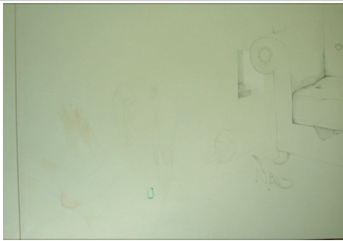
název: Bez názvu materiál/technologie: Kolorovaná kresba na plátně výška x šířka v cm: 100x280 rok vzniku: 2009