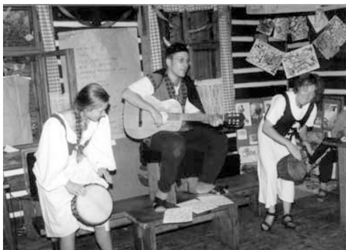
Prázdninová programová akce, RUBICON, prázdniny 2000.

Jsou především jedinečnou příležitostí. Příležitostí k vlastnímu sebepoznání a dalšímu seberozvoji. Skrze zážitky na našich kurzech poznáváme sami sebe, jací doopravdy jsme, a na základě těchto zkušeností si můžeme volit směr svého dalšího vývoje. Cílem kurzu je co nejširší rozvoj naší osobnosti a tvorba skupiny – učíme se tím, že potkáváme druhé. Kurzy jsou setkáním. Hlavním působícím prostředkem na kurzech je hra. Hra navozuje různé situace a staví nás před nejrůznější překážky, které se učíme překonávat. Velkou pomocí je zde podpora ostatních. Atmosféra a kolektiv na kurzech motivuje lidi k jejich nejlepším, často životním výkonům. Důraz je kladen na zážitek, který