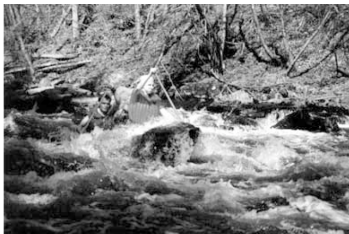
Otava, Bohatýrská trilogie 2001.

Brno Instructors is the name of a university sports club registered with BUT. They present themselves as an open group of university students mostly from Brno, who do care how they live their lives. They promote active life style, accept, process, and disseminate new and interesting information. By organizing courses, they try to achieve a harmonic development of personality and, by means of various games and strong experiences, they contribute to practicing real situations in life.