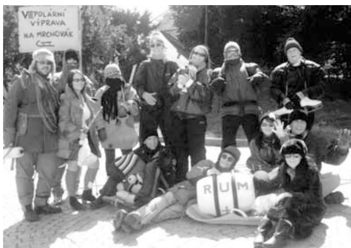
Účastníci VIII. ročníku „Polární výpravy na Mrchovák“.

účastním jako vedoucí. Spolu s ostatními dospěláky, kteří se cítí být ještě dětmi, se staráme o šedesát dětí v rozmezí od pěti do třinácti let. Samozřejmostí je, že se obejdeme bez elektřiny, ohříváme vodu v kotlích, myjeme se ve vlastnoručně vyrobených sprchách, vaříme na plátových kamnech, zkrátka vystačíme si bez moderních vymožeností civilizovaného světa. Za to nás čeká čtrnáctidenní klídek bez mobilu, televize, mikrovlnky a počítače. Svěřené ratolesti, které zprvu vůbec neznáme, pokládáme během pár dnů za svoje vlastní. Náročné dny plné her a legrace obvykle skončí spánkem pod širákem. A když nevyjde počasí, zalezeme do indiánského tee-pee. Nejtěžším okamžikem je loučení, kdy i ti největší tvrdšasové utrousí nějakou tu slzu. Ale život běží dál a nezbyvá nic jiného než se těšit napříště.