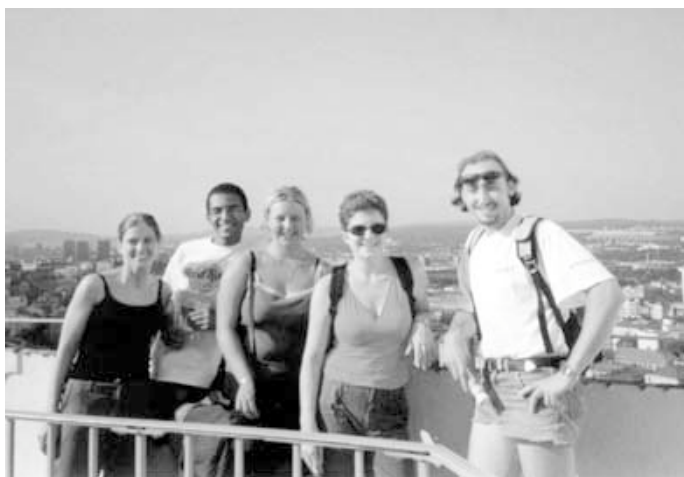
Studenti intenzivního jazykového kurzu českého jazyka při výletu na Špilberk.

výcviku specifických dovedností až po volné přednáškové a diskusní formy. Jejich společným jmenovatelem budou metody založené na respektování zkušeností účastníků, na týmovém učení a metodách stimulujících diskusi a interaktivitu. Jsou to metody známé pod názvem empirické učení (experiential learning).