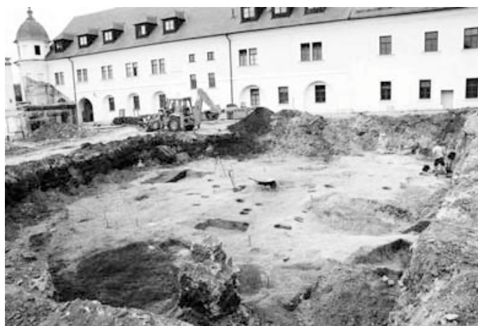
Kromě stavbařů se v areálu FEI VUT v Brně pohybují i archeologové.