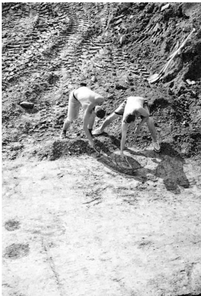
Archeologický výzkum doložil středověké i pravěké osídlení.