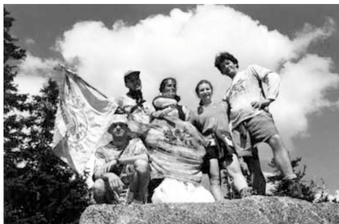
Vrchol Plechý, Šumava, Bohatýrská trilogie 2001.

je dále zpracováván formou zpětné vazby. Kurzy jsou naplněny hrami, sporty, diskusemi, tvořivými dílnami, relaxací, pohybem, rozjímáním. . .