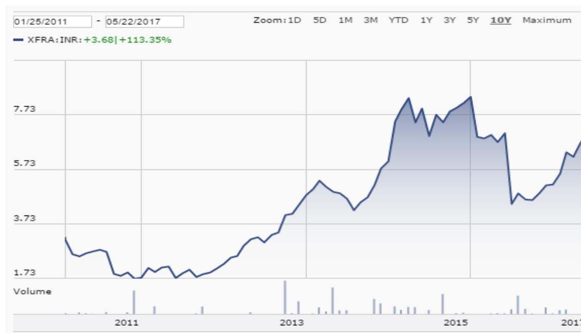
Graf. 9: Kurz akcie IAG za posledních 6 let (převzato z 24)

Cena akcií IAG je znázorněna na následujícím grafu.