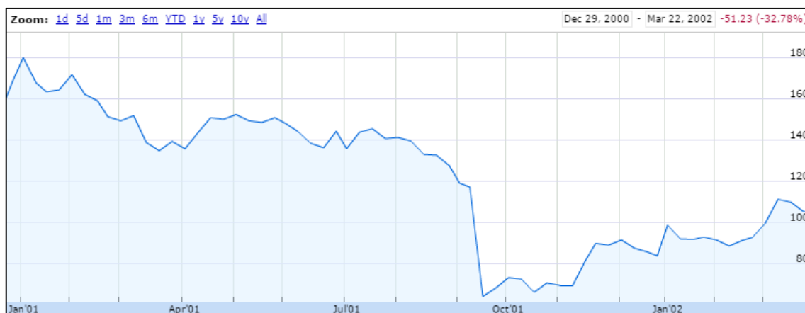
Graf. 2: Index XAL v roce 2001 (převzato z 10)

Rizik pro letecké odvětví může být mnohem více, snažil jsem se však vyjmenovat ty nejpodstatnější. Dále za zmínku stojí letecké katastrofy a teroristické útoky, které podkopávají důvěru v leteckou dopravu. Poslední slova perfektně prezentuje následující graf, kde je vidět, jak index XAL po teroristických útocích 11. září 2001 spadl o více jak 50 %.