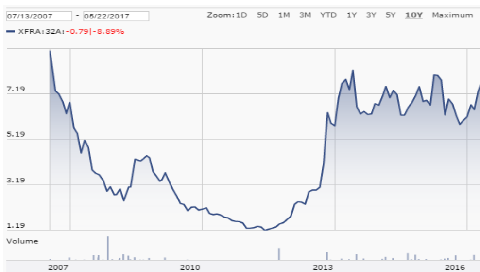
Graf. 4: Kurz akcie Aegean Airlines za posledních 10 let (převzato z 19)