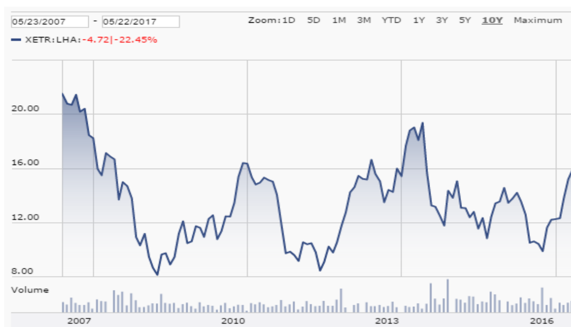
Graf. 7: Kurz akcie Deutsche Lufthansa za posledních 10 let (převzato z 22)

Dividendy společnost vyplácí v rozmezí 10-25 % z EBIT za podmínky, že tato částka nepřesahuje čistý zisk v daném roce (15).