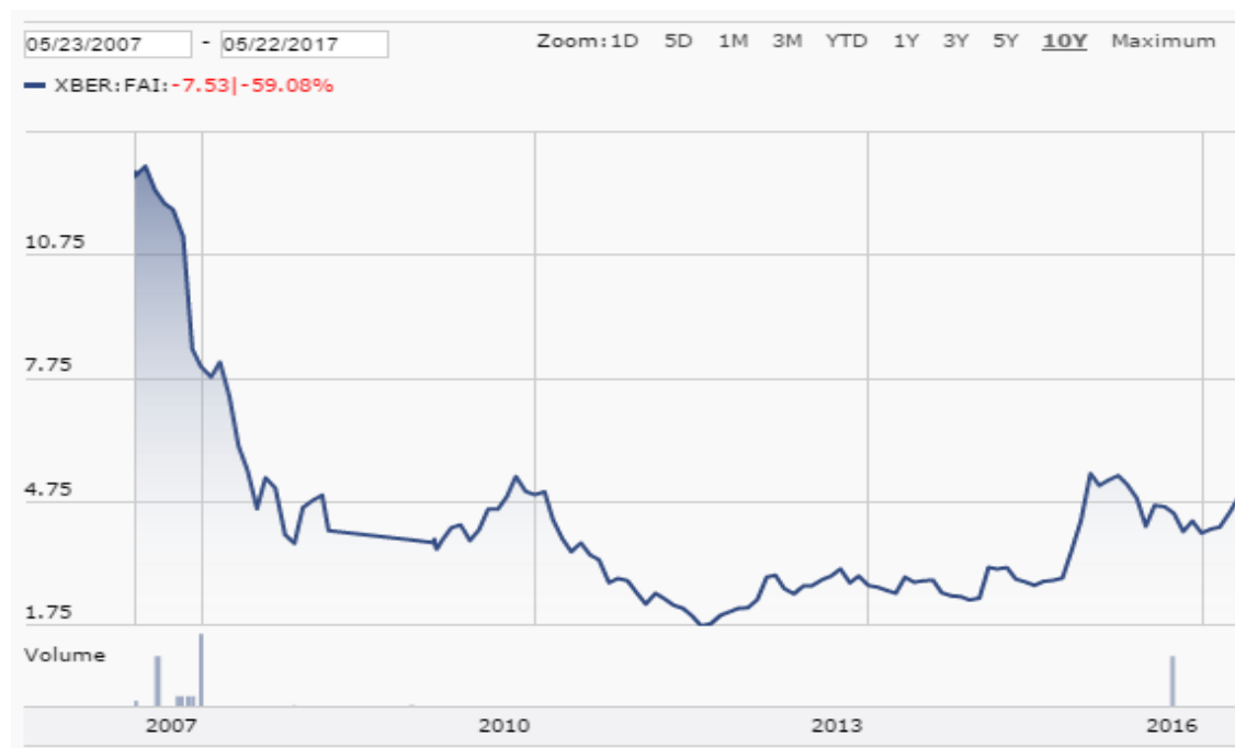
Graf. 8: Kurz akcie Finnair za posledních 10 let (převzato z 23)

Kurz akcie společnosti Finnair zaznamenal prudký pokles v letech 2007 až 2008. Od roku 2012 má kurz velice mírný stoupající trend.