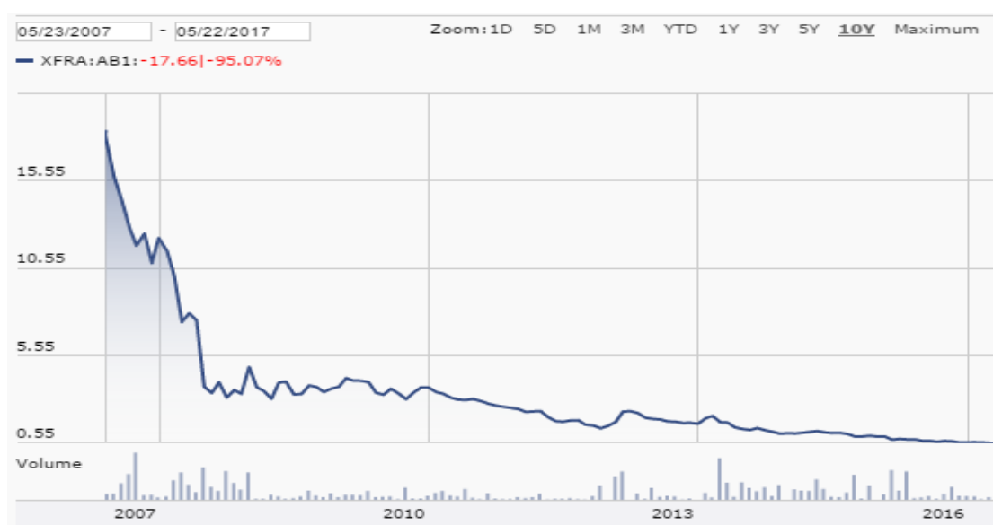
Graf. 5: Kurz akcie Air Berlin za posledních 10 let (převzato z 20)

Z následujícího grafu je patrné, že kurz má býčí trend. Pozitivní impuls ovšem přišel po zveřejnění zprávy o restrukturalizaci, která je popsána na následující straně. Kurz se tak odrazil od hodnoty 0,6, a to až na hodnotu přesahující cenu 1 euro za akcii.