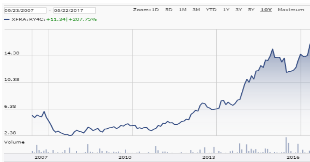
Graf. 10: Kurz akcie Ryanair za posledních 10 let (převzato z 25)

Z grafu je jasně rozpoznatelný býčí trend akcií Ryanair. Za období posledních deseti let dosáhl nárůstu přes 200 %.