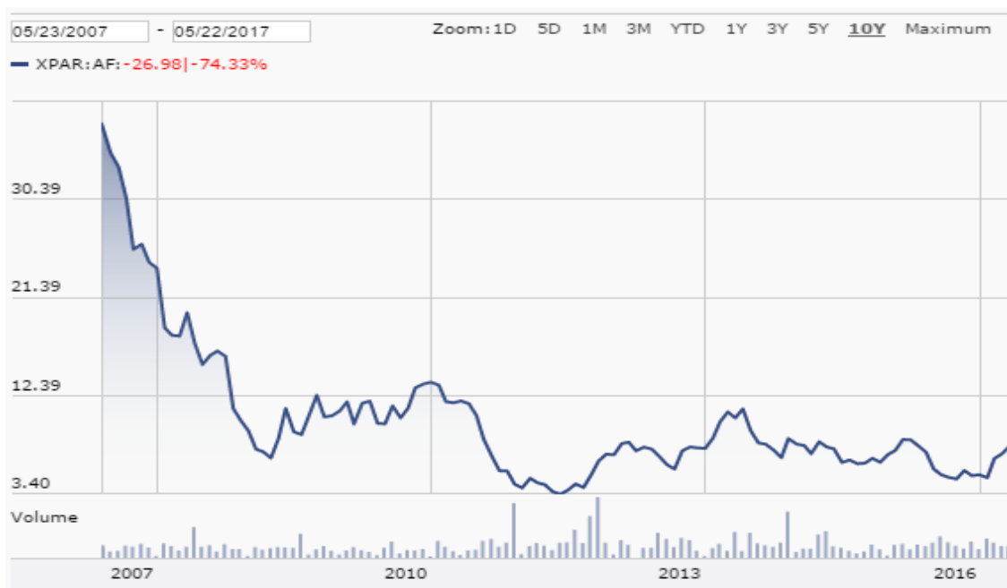
Graf. 6: Kurz akcie Air France-KLM za posledních 10 let (převzato z 21)