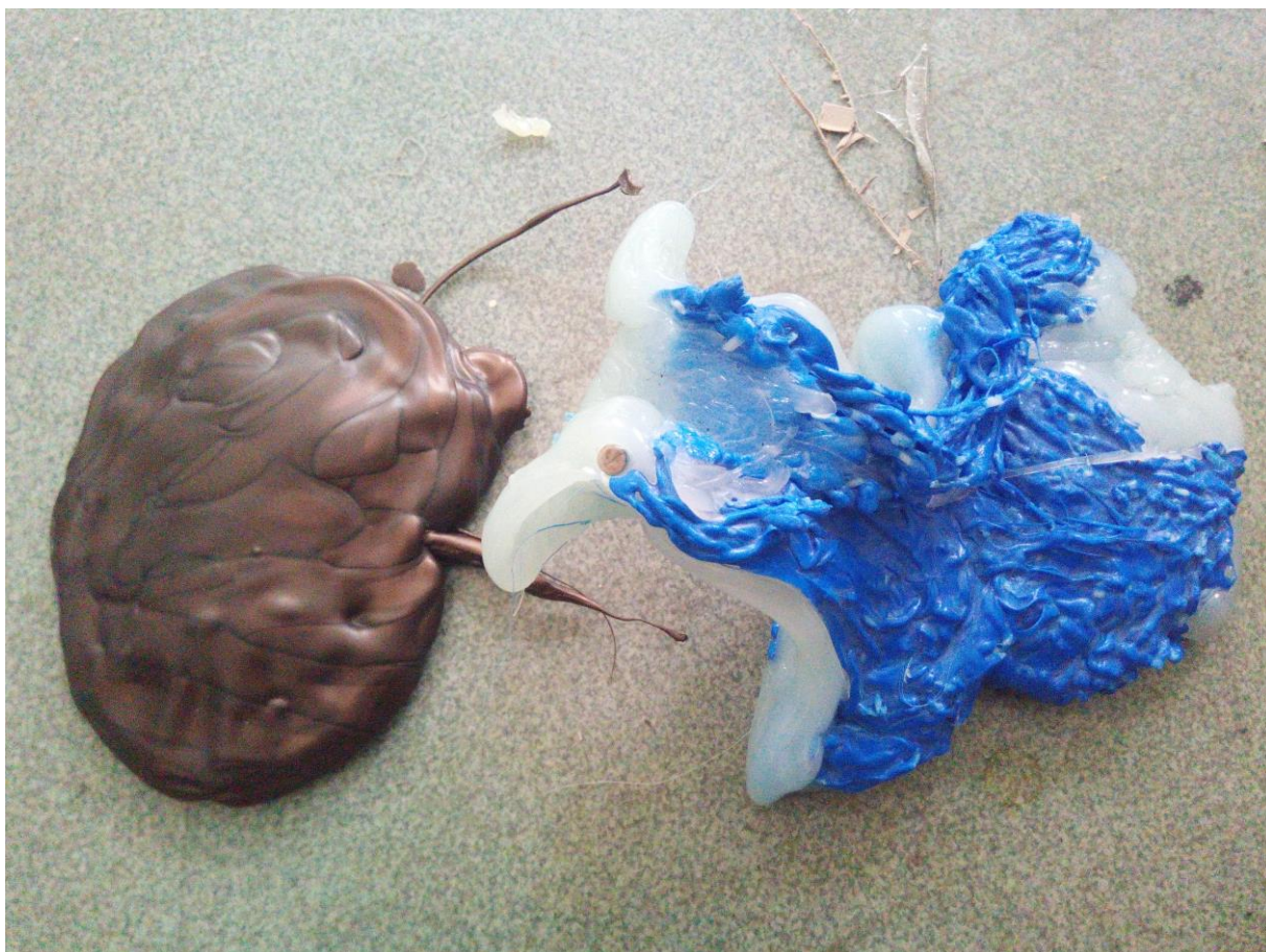
Odstřiky z továrny (nahore) ; Výrobní pás