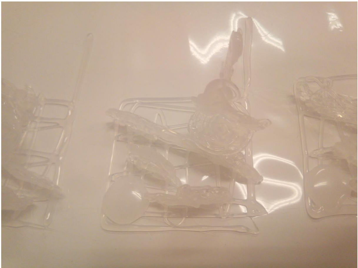
Detail výrobku (2) ; Vizualizace instalace