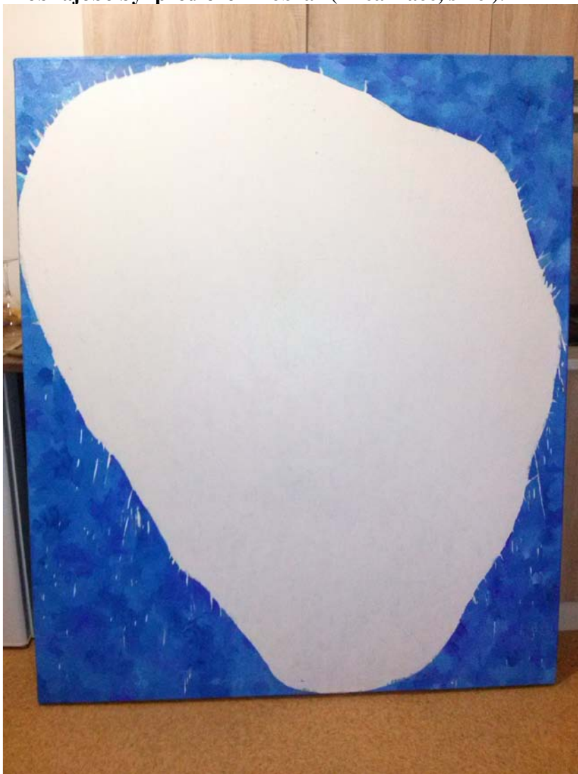
Martin Cáb, ol.na plátně, 160x135, obraz, 2015 (nedokončeno, rozmalováno)

K obhajobě byl předložen 1 obraz (1 realizace, skici).