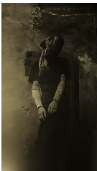
název: Cherubín materiál/technologie: digitální tisk na hliníku výška x šířka v cm: 89 x 49 cm rok vzniku: 2010