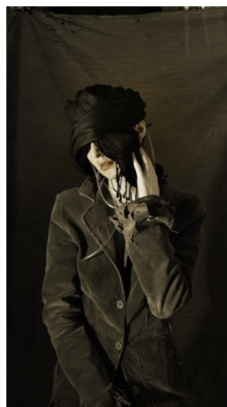
název: Serafín materiál/technologie: digitální tisk na hliníku výška x šířka v cm: 89 x 49 cm rok vzniku: 2010