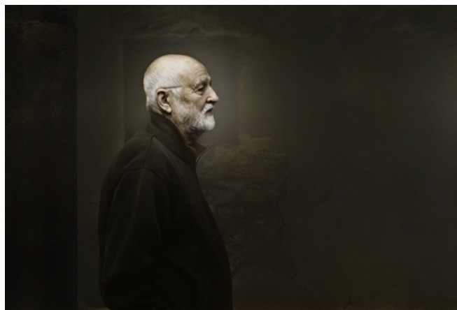
název: Vergilius materiál/technologie: digitální tisk na hliníku výška x šířka v cm: 70 x 110 cm rok vzniku: 2010