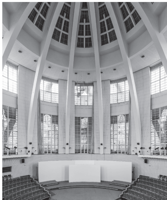
Obrázek 5 - Rotunda pavilonu A (zdroj: [21])

představují, a posoudit potřebu ochrany dosud existujících areálů a staveb. Druhým důležitým úkolem je analytický rozbor postavení výstavních areálů ve městech, z něhož by měla vyplynout obecně platná doporučení pro jejich budoucí ukotvení v územně-plánovací dokumentaci a především ve výkresech funkčního členění ploch, které jsou v současnosti jedním z nejdůležitějších nástrojů územních plánů. Z obou předchozích výzkumů, tj. z dokumentace prostorového vývoje výstavišť a analýzy jejich postavení ve městech by pak měla vzejít i případná doporučení pro památkovou ochranu historických výstavišť, a to nikoliv nutně ve smyslu plošné památkové ochrany území, ale především ve smyslu manuálů a příkladů dobré praxe pro regionální správu a provozovatele těchto areálů.