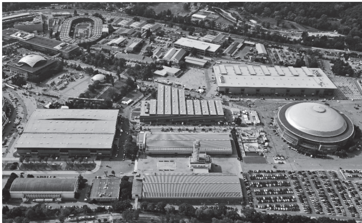
Obrázek 4 – Moderní haly brněnského výstaviště postavené po roce 1995 (zdroj: [18])

veletržní areál v Praze-Letňanech je v provozu od roku 2003 a po roce 2010 začal vyrůstat nový výstavní a volnočasový areál v Kroměříži. V řadě měst se o historické lokalitě sloužící dřívě trhům nebo výstavám stále hovoří jako o výstavišti, přestože reálně je pro výstavní účely využívána pouze v malé míře. To svědčí o tom, že výstavnictví reprezentuje kulturní hodnotu, která charakter místa utváří a dlouhodobě se podepisuje na jeho identitě.