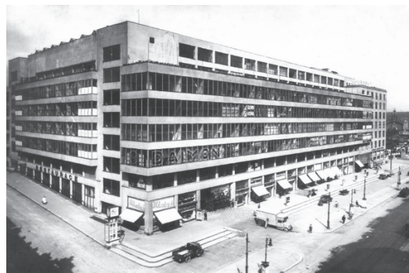
Obrázek 3 - Veletržní palác

výstavní tradici. V roce 1947 se konala na pražském výstavišti Slovanská zemědělská výstava [11, s. 47], další velká výstava