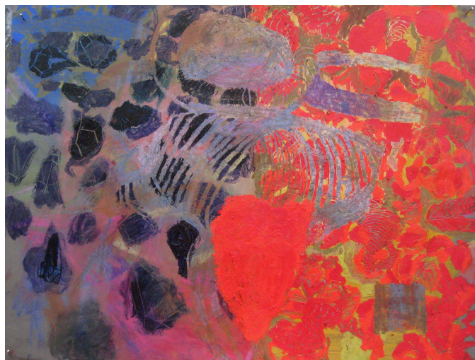
Horní menu - vložit - obrázek - ze souboru ...

název: Tereza materiál/technologie: Olej na plátně výška x šířka v cm: 150x120 rok vzniku: 2009