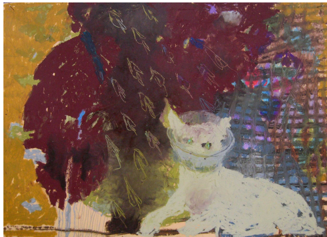
Horní menu - vložit - obrázek - ze souboru ...

název: Adriena materiál/technologie: Olej na plátně výška x šířka v cm: 100x60 rok vzniku: 2009