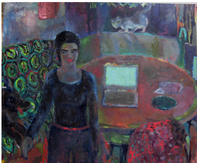
Horní menu - vložit - obrázek - ze souboru ...

název: Límeček materiál/technologie: Olejoyé pastely, papír výška x šířka v cm: 70x50 rok vzniku: 2009