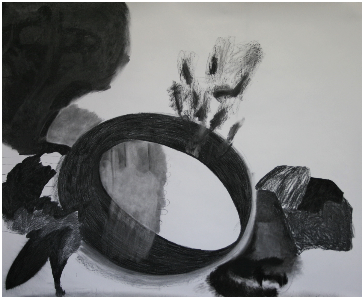
fotografie kresby z průběhu práce – květen 2021, uhel na papíře, 1,8 × 2,2 m