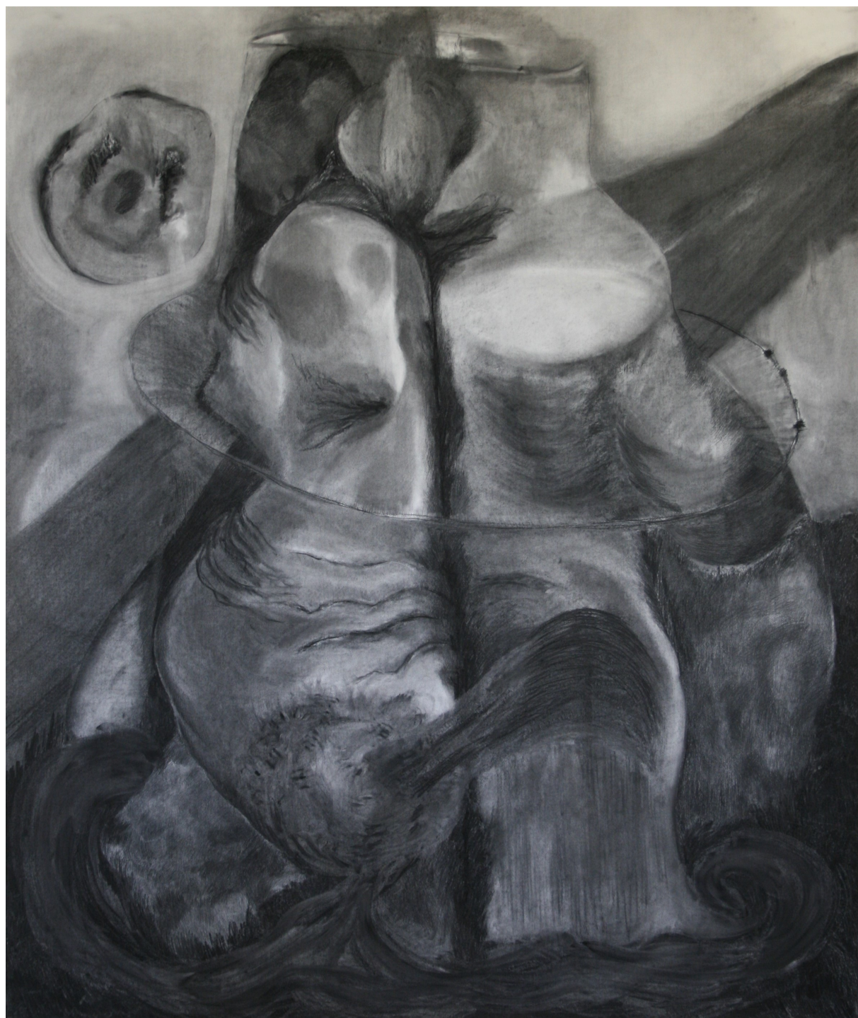
Splývání, květen 2021, uhel na papíře, 2,4 × 2 m