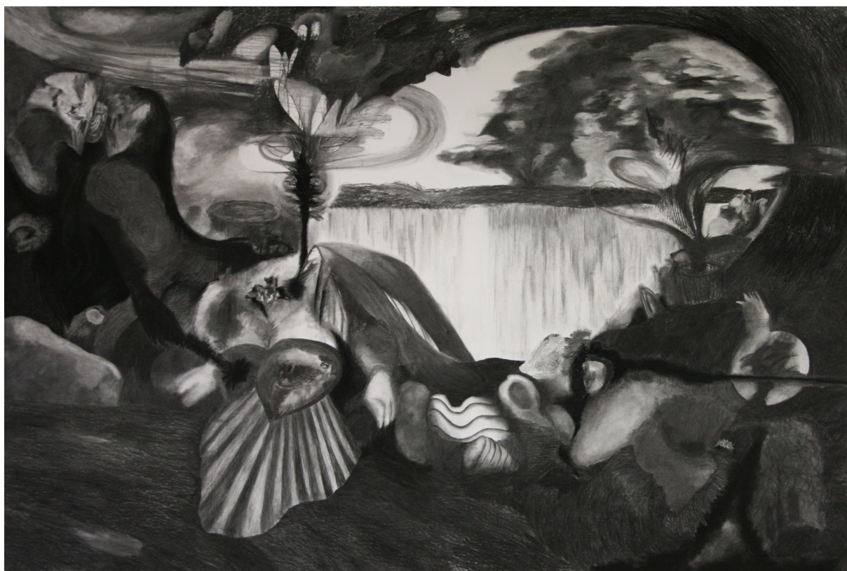
Rozklad, květen 2021, uhel na papíře, 2,7 × 4 m