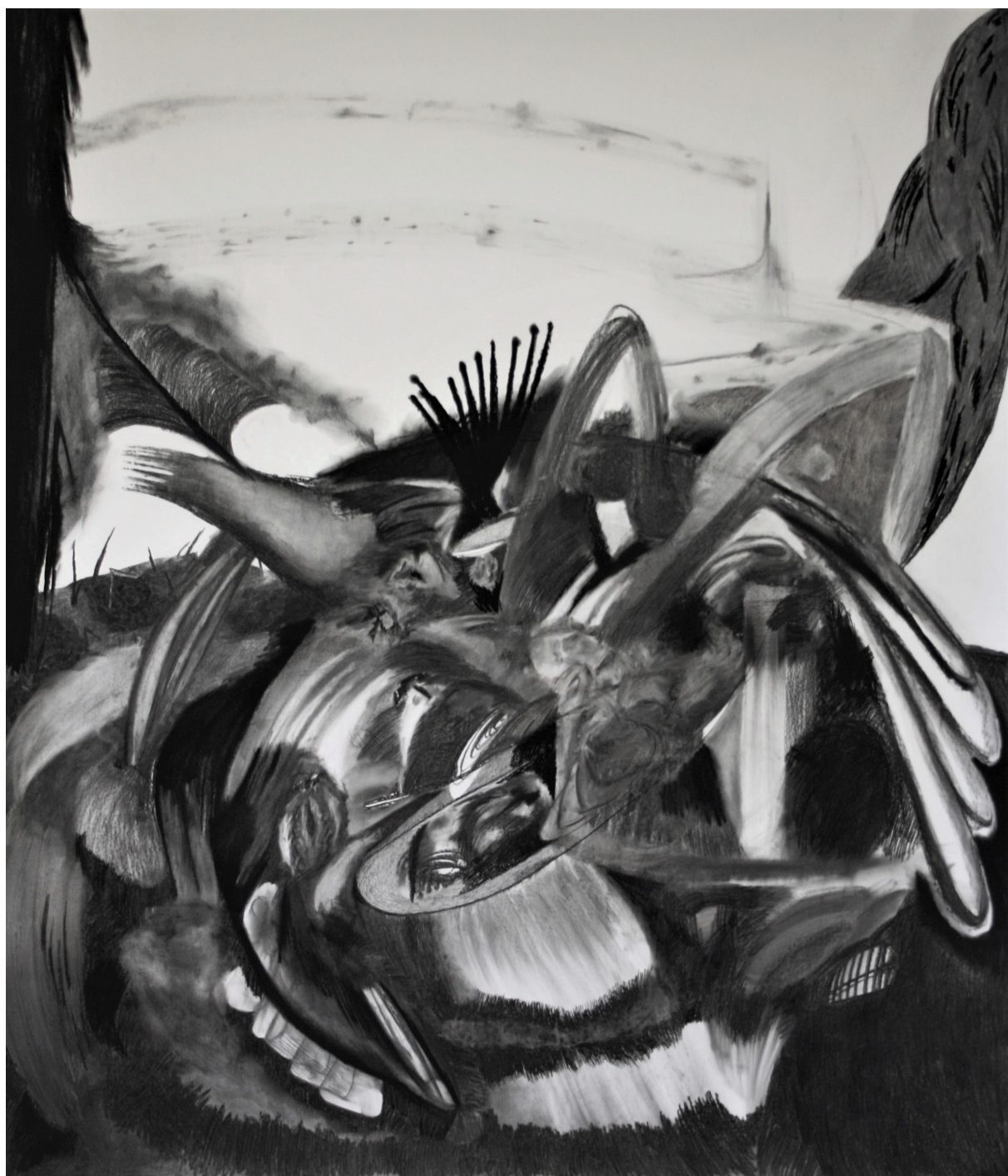
Zvrat, květen 2021, uhel na papíře, 2,4 × 2 m