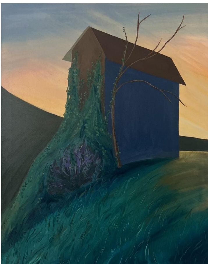
Obrázek 4 Nové ráno, olej na plátně, 100x80 cm, 2024