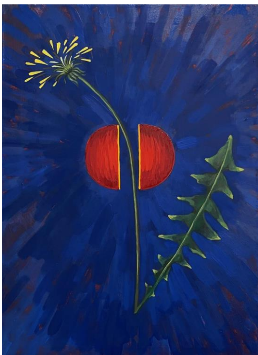
Obrázek 8 Jan 8,12, olej na plátně, 80x60 cm, 2024