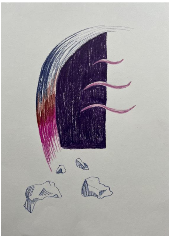
Obrázek 11 Hlas jemný, tichý II., pastelky na papíře, 29x21 cm, 2023