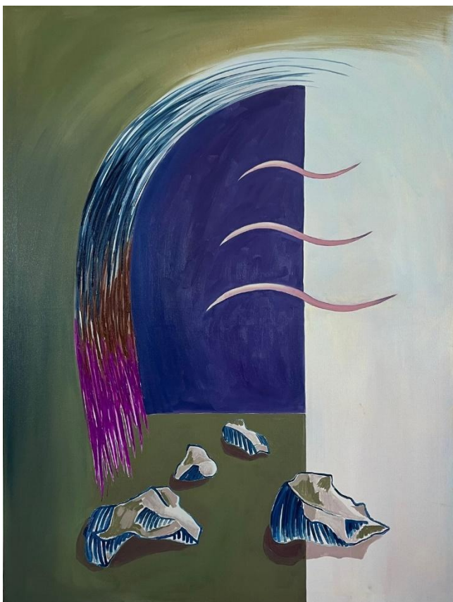
Obrázek 7 Hlas jemný, tichý, 145x110 cm, 2024