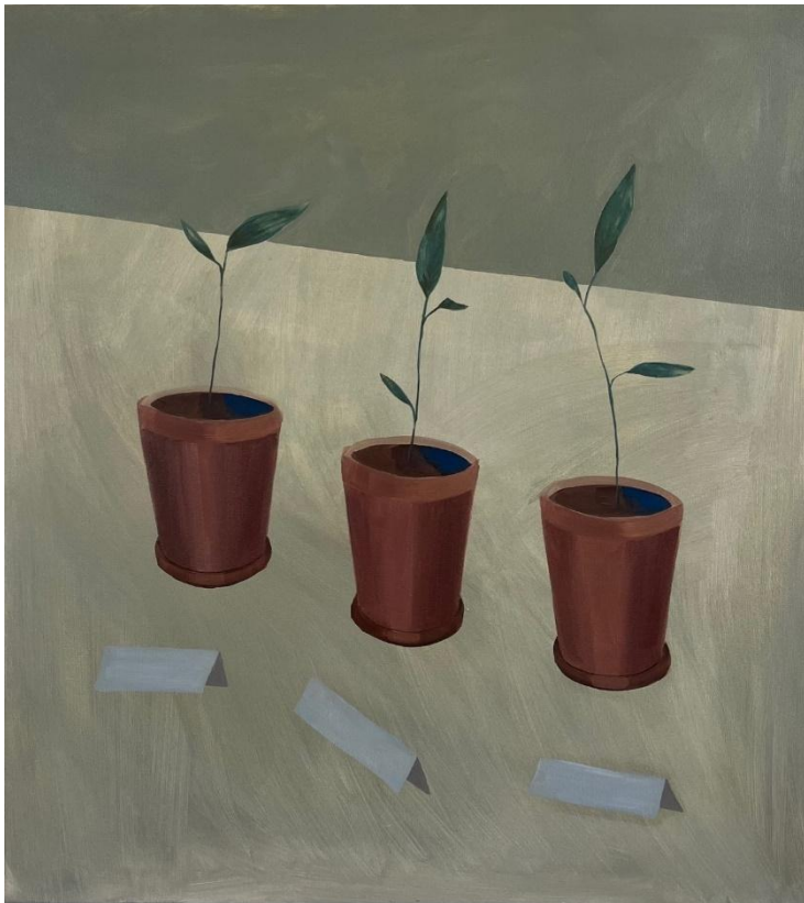
Obrázek 5 Dobrota, spravedlnost, pravda, olej na plátně, 100x90 cm, 2024