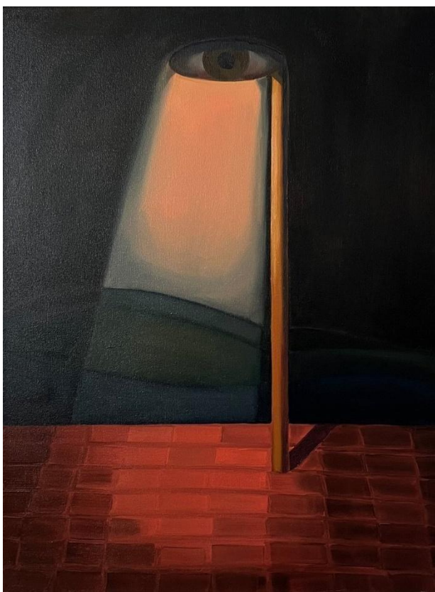
Obrázek 2 Oko je lampou těla, olej na plátně, 80x60 cm, 2024