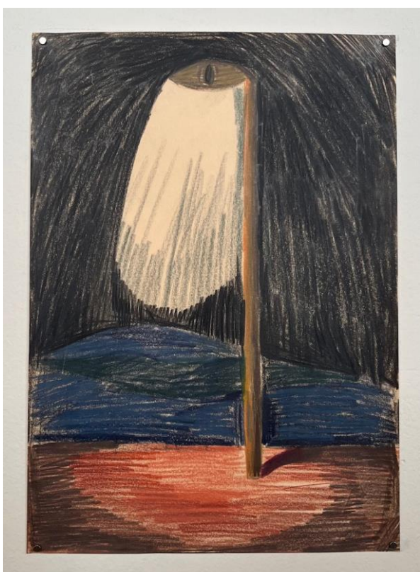
Obrázek 10 Oko je lampou těla II., pastelky na papíře, 29x21 cm, 2024