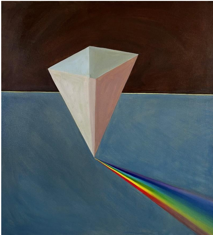
Obrázek 6 Prisma, olej na plátně, 110x100 cm, 2024