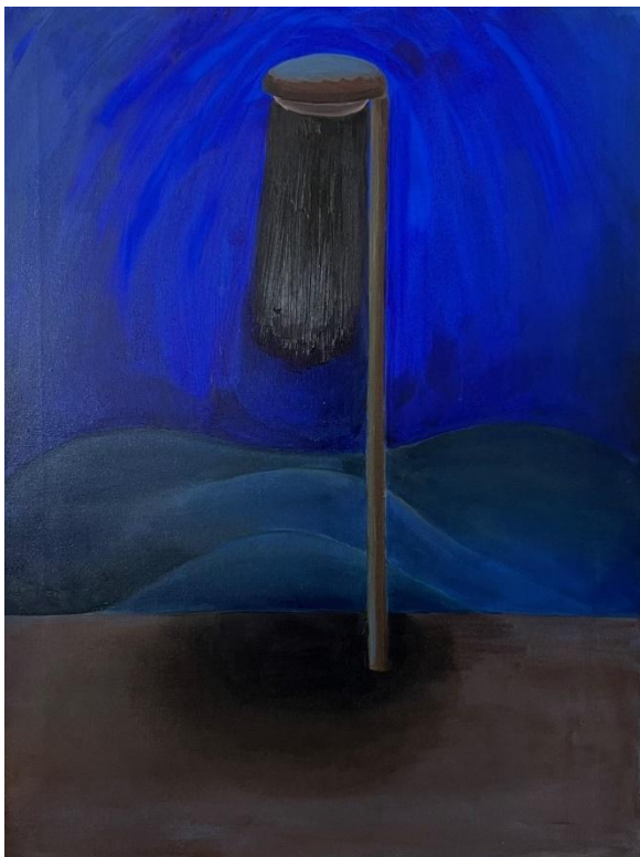
Obrázek 1 Lampa, olej na plátně, 80x60 cm, 2024