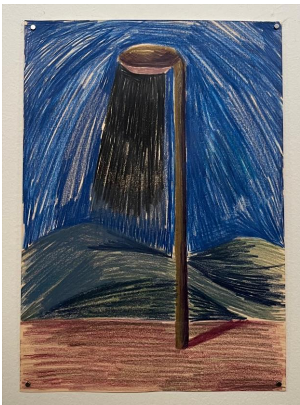
Obrázek 9 Lampa II., pastelky na papíře, 29x21 cm, 2024