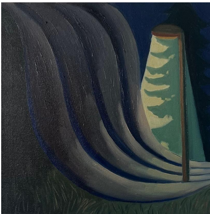
Obrázek 3 Lampa 3, olej na plátně, 40x40 cm, 2024