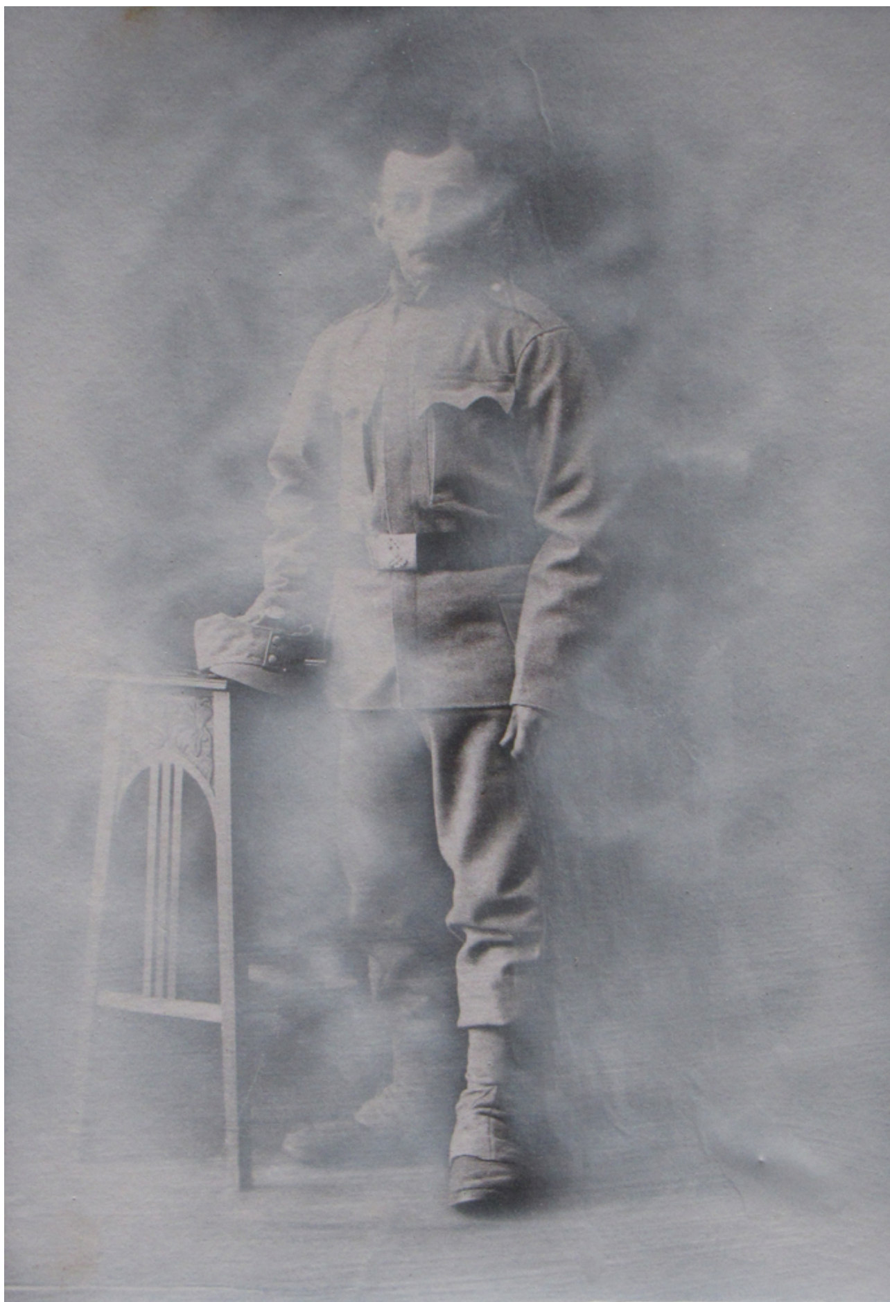
Určení na večnost' (pravá část' diptychu), skica na lepenke A4, 2013