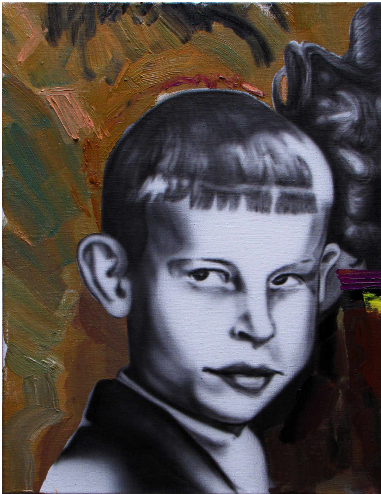
Zahřadený do seba (pravá část diptychu), 70 x 55 cm, airbrush a olej na plátne, 2013