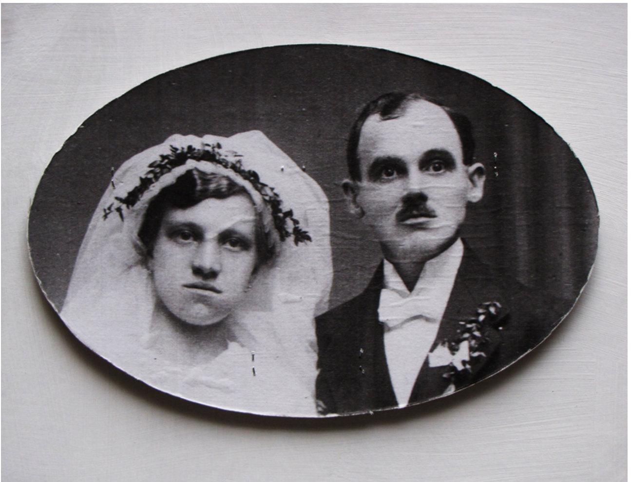
Pár milencov, elipsa A4, skica na lepenke, 2013