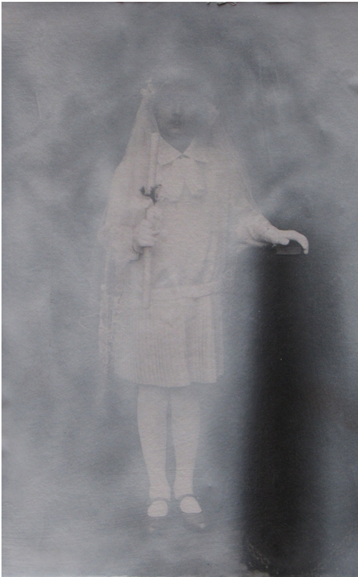
Určení na věčnost (řavá část diptychu), skica na lepenke A4, 2013