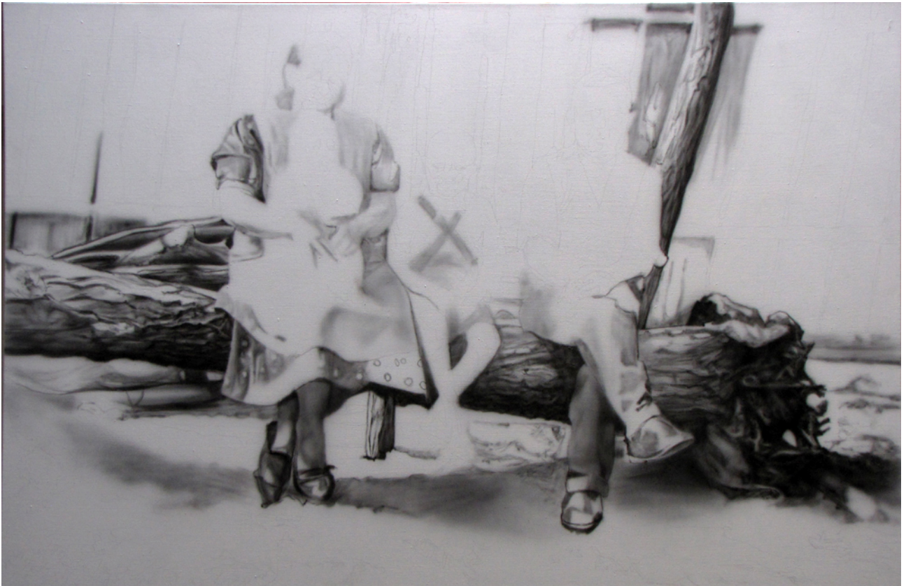
Hľa drevo kríža, 200 x 130 cm, airbrush a olej na plátne, 2013