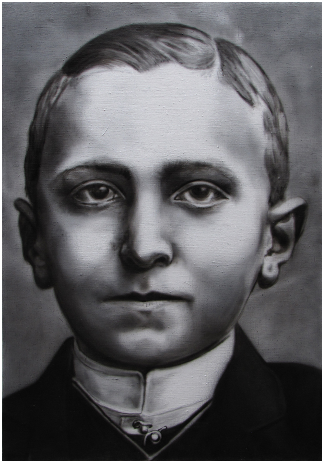
Děda, airbrush na plátne, 100 x 70 cm, 2013