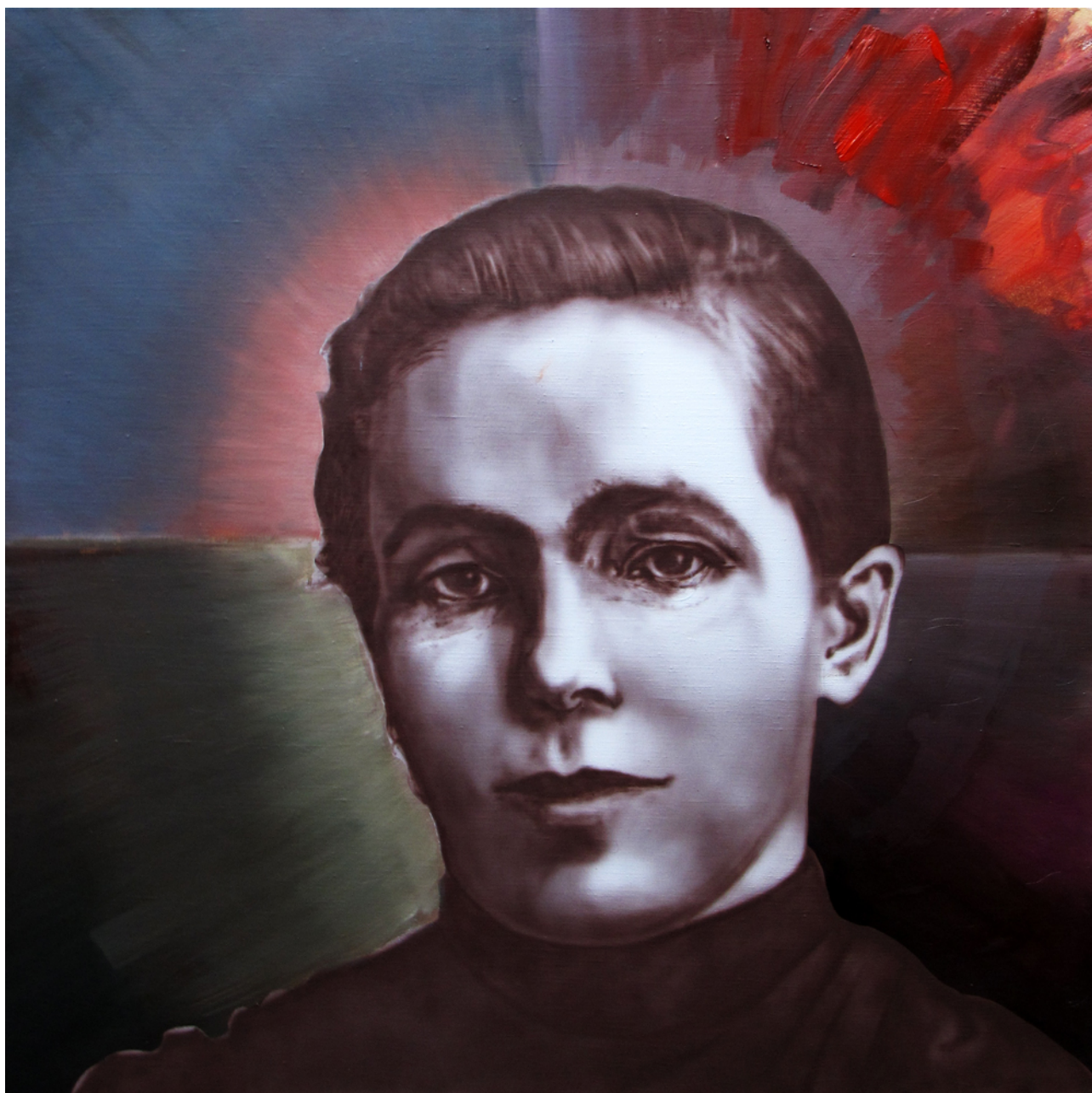
Svätá, airbrush a olej na plátne, 100 x 100 cm, 2013