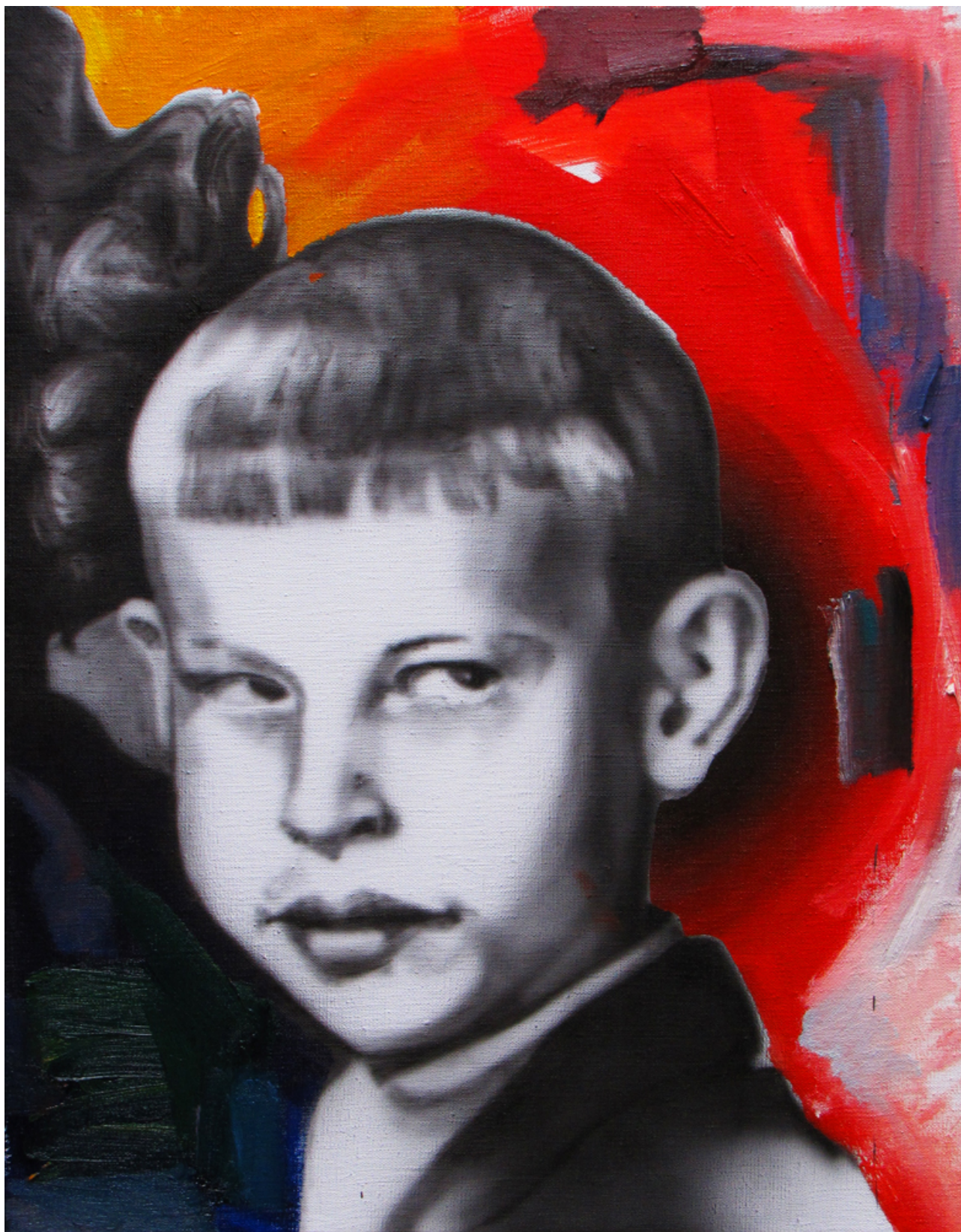
Zahřadený do seba (ľavá časť diptychu), airbrush a olej na plátne, 70 x 55 cm, 2013