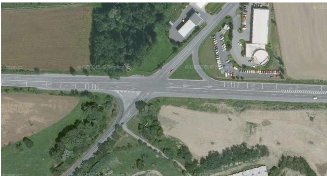
Obrázek č. 1 Křižovatka v Olomouci "U Peugeotů" [23]

Jako první nebezpečný úsek pro zhodnocení ve své práci jsem si vybral čtyřramennou stykovou křižovatku (tvaru X), "U Peugeotů" těsně za koncem obce, kde řízení dopravy bylo upraveno pouze zákonem o provozu na pozemních komunikacích a dopravním značením. Silnice č. I/35 Olomouc – Lipník nad Bečvou byla označena značkou P 2 (hlavní pozemní komunikace), kde ze čtyř jízdních pruhů v daném směru byl pravý jízdní pruh odbočovací na Olomouc – Holice, ulice Hamerská, dva jízdní pruhy přímým směrem na Lipník nad Bečvou a levý jízdní pruh byl odbočovací na Bystrovany. Rovněž v protisměru byly čtyři jízdní pruhy, dva přímé jízdní pruhy a po stranách odbočující – vlevo na Olomouc - Holice, vpravo na Bystrovany. Před křižovatkou byla rychlost omezena na 60 km/h v obou směrech. Pro automobily přijíždějící po ulici Hamerské platila dopravní značka „Dej přednost v jízdě“, kdy vozidla odbočovala doprava - směrem na Lipník nad Bečvou, do přípojovacího pruhu. Řidičům vozidel přijíždějících zprava – od Bystrovan přikazuje dopravní značka č. P 6 „Stůj, dej přednost v jízdě“, aby zastavili svá vozidla před vjezdem do křižovatky.