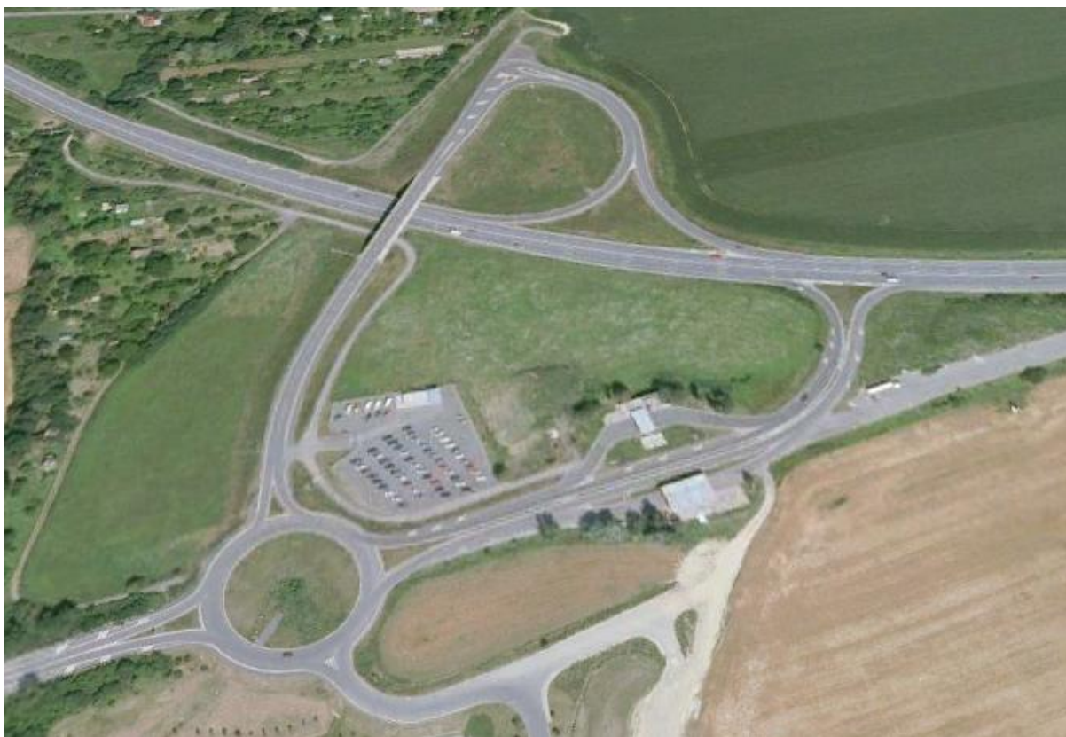
Obrázek č. 4 Přestavěná křižovatka za Lipníkem nad Bečvou [23]

Podle výše uvedených skutečností se musela tato křižovatka přestavět na křižovatku s mimoúrovňovým křížením ve směru od Hranic. Toto křížení umožňuje napojení východní části Lipníku nad Bečvou na rychlostní komunikaci R 35 na Olomouc a na dálniční úsek D1 na Ostravu. Součástí mimoúrovňové křižovatky je i kruhové křížení na silnici č. II/434 u vojenských kasáren a průmyslové zóny na ulici Hranická, na které je centrální sklad společnosti Penny Market.