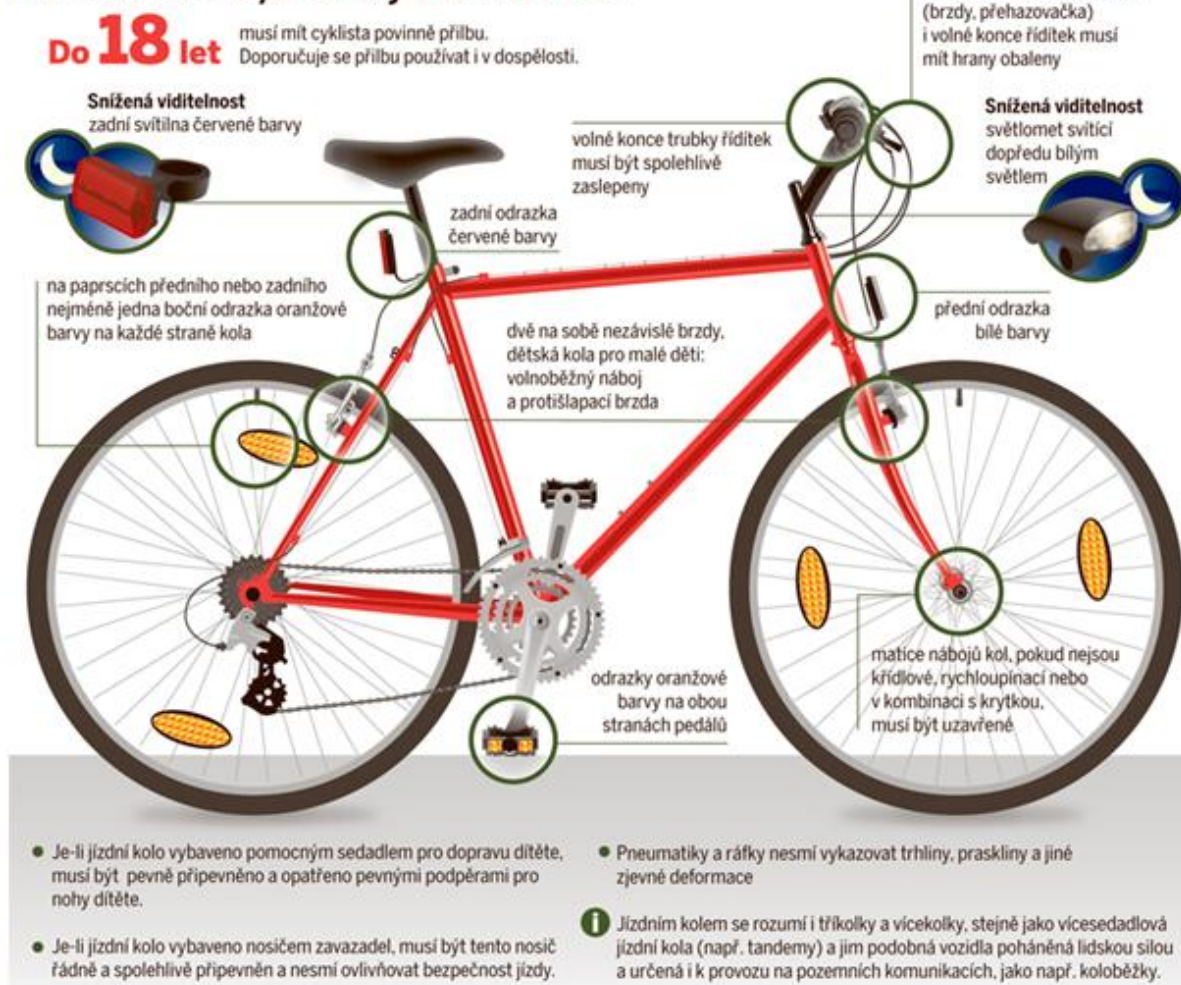
Obrázek č. 10 Povinná výbava jízdního kola [19]

Jako další významný bezpečnostní prvek je cyklistická přilba. Podle statistik v polovině všech dopravních nehod cyklistů došlo k poranění hlavy ať už v důsledku střetu s vozidlem či