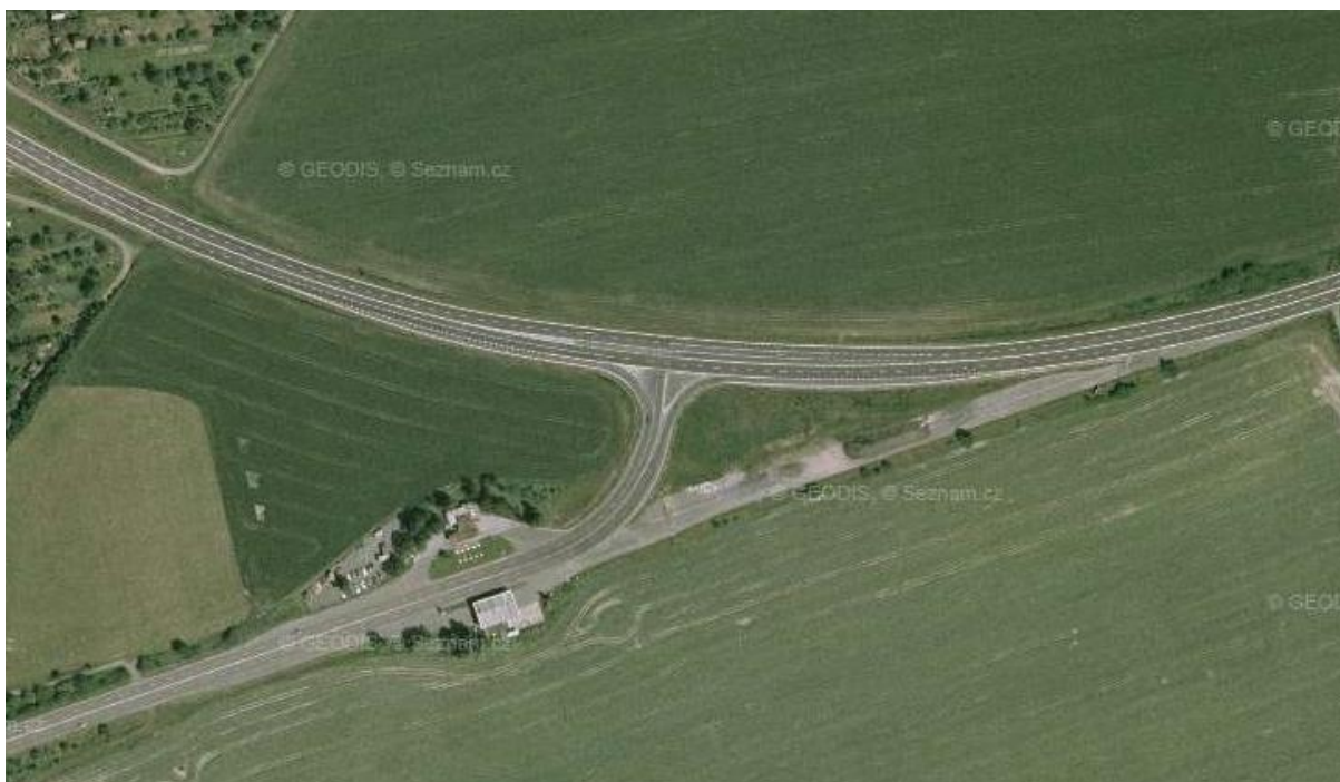
Obrázek č. 3 Křižovatka za Lipníkem nad Bečvou[22]

Jednalo se o tříramennou stykovou křižovatku, na které bylo řízení dopravy upraveno zákonem o provozu na pozemních komunikacích. Silnice č. I/47 vedoucí z Olomouce směrem na Ostravu o celkové šířce 16 m je čtyřpruhová, v každém směru jízdy vedly dva jízdní pruhy, které byly od sebe odděleny souvislou dvojitou čarou, a v obou směrech jízdy označeny dopravní značkou P 2 (hlavní pozemní komunikace). Ve směru jízdy z Olomouce byl pravý jízdní pruh odbočovací směrem do Lipníku nad Bečvou. Tento jízdní pruh a přípojovací jízdní pruh vedoucí z Lipníku nad Bečvou byly od sebe v křižovatce odděleny betonovým obrubníkem. Na hlavní pozemní komunikaci byla před křižovatkou v obou směrech rychlost omezena dopravní značkou B 20 a (nejvyšší dovolená rychlost) na 70 km/h. Ve směru jízdy z Ostravy byly tři jízdní pruhy, ze kterých dva jízdní pruhy byly určeny pro přímý směr a levý jízdní pruh byl odbočovací na Lipník nad Bečvou. V opačném směru jízdy se nacházely rovněž tři jízdní pruhy. Dva průběžné jízdní pruhy umístěné blíže ke středové čáře vedly přímým směrem na Ostravu a pravý jízdní pruh byl odbočovací na Lipník nad Bečvou. Z důvodů bezpečnosti automobilů odbočujících vlevo byla tyto vozidla chráněna před vozidly jedoucích v protisměru přímým směrem betonovým ostrůvkem.