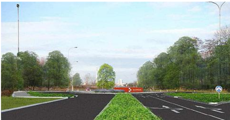
Obrázek č. 2 Okružní křižovatka "U Peugeotu" [18]

Aby průsečná křižovatka na ulicích Lipenská – Hamerská splňovala bezpečnostní požadavky, bylo rozhodnuto o přestavbě na okružní křižovatku. Tato křižovatka slouží ke zpomalení provozu vozidel jedoucích po hlavní pozemní komunikaci tak, aby zde nepřekračovali maximální dovolenou rychlost. Navíc automobily přijíždějící z vedlejších silnic mohou bezpečně projet touto křižovatkou, aniž by jim hrozilo jakékoliv nebezpečí. Výstavba této okružní křižovatky byla zahájena 26.7.2010. Tato křižovatka má netradiční tvar – eliptický a téměř po celém obvodu kruhového křížení, se vyskytují dva jízdní pruhy. Rychlost přijíždějících automobilů je před samotnou křižovatkou snížena na 30 km/h, přičemž řidiči jedoucí po ulici Lipenské ve směru od Lipníku nad Bečvou mohou odbočit vpravo, aniž by museli vjet na kruhový objezd.