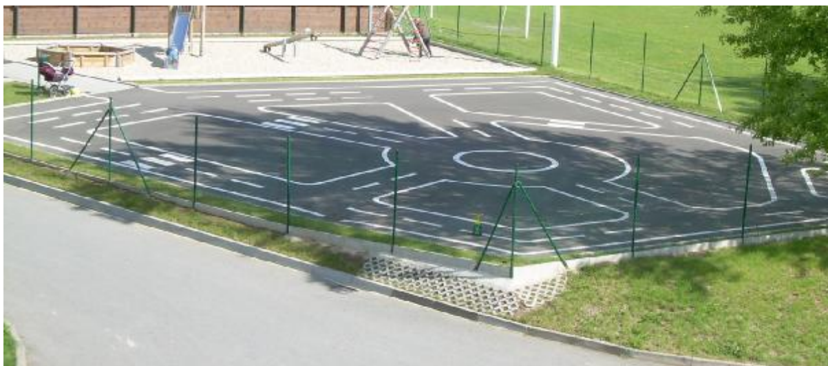
Obrázek č. 9 Dopravní hřiště v Dolním Újezdě

Je dobré, že se staví nová dětská dopravní hřiště, na kterých se děti mohou setkat s dopravními značkami a dopravními situacemi. Navíc pro zvýšení bezpečnosti silničního provozu na pozemních komunikacích bych ve školách vložil do výuky povinnou dopravní výchovu. Měla by se vyučovat na prvním stupni základních škol, jelikož děti od 10 let se stávají účastníky silničního provozu na pozemních komunikacích jako řidiči, neboť mohou jezdit na kole (na silnici, místní či účelové komunikaci) bez dozoru osoby starší 15 let dle § 58 odst. 2 platného zákona 361/2000 Sb., o provozu na pozemních komunikacích. Aby dopravní výchova děti nenudila, měla by být pojmuta i formou her. Samozřejmě součástí dopravní výchovy by byla i výuka na nově se budujících dopravních hřištích. Zde se děti neučí jen jezdit podle dopravních značek, ale také se zdokonalují v ovládnutí jízdního kola jako např. jízda pomocí jedné ruky, objíždění překážek (slalom) či jízda v kolejnici (příloha č. 12).