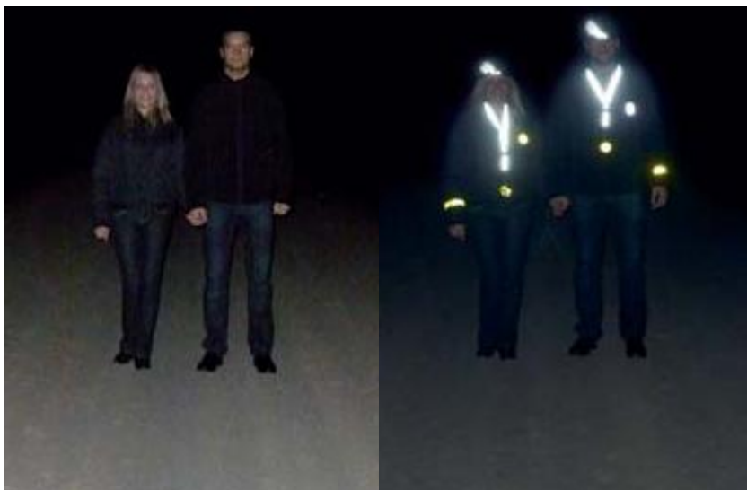
Obrázek č. 8 Rozdíl viditelnosti bez reflexních prvků a s nimi[21]

Při rychlosti 75 km/h potřebuje řidič nejméně 31 m na to, aby si uvědomil nebezpečí a odpovídajícím způsobem zareagoval. Pouze s reflexními materiály na oblečení dají chodci řidiči dostatek času na včasnou reakci.