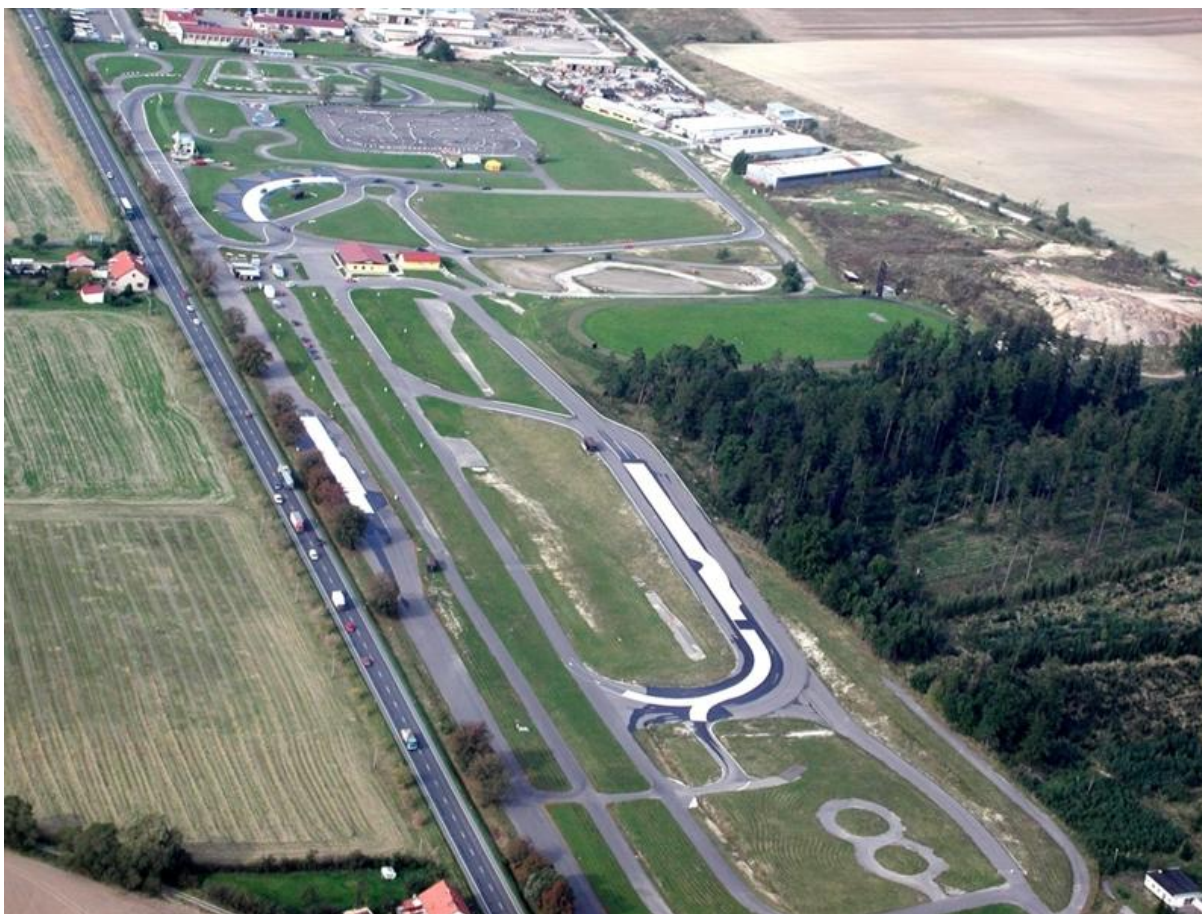
Obrázek č. 11 Polygonní okruh ve Vysokém Mýtě [20]