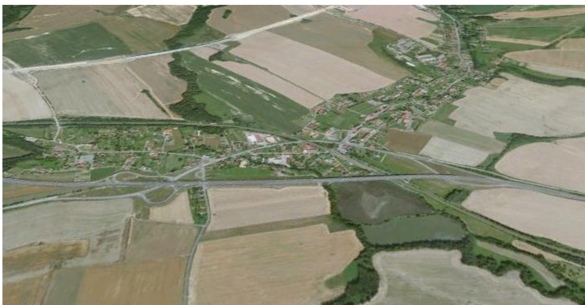
Obrázek č. 6 Obchvat obce Běloutín [23]

Základním předpokladem, aby se na této křižovatce omezily dopravní nehody, bylo omezení intenzity provozu v prostoru kritické křižovatky. V návaznosti na tuto myšlenku byl vybudován obchvat obce Běloutín. Jelikož je obec Běloutín situována do údolí, je její obchvat řešen mostem dlouhým 580 m, který vede i přes železniční trať a rybník. Obchvat je součástí rychlostní komunikace R 48, který slouží nejen pro odlehčení dopravy v obci Běloutín, ale i jako přivaděč na dálnici D1. Součástí mostu je i protihluková zeď, která je po celé jeho délce.