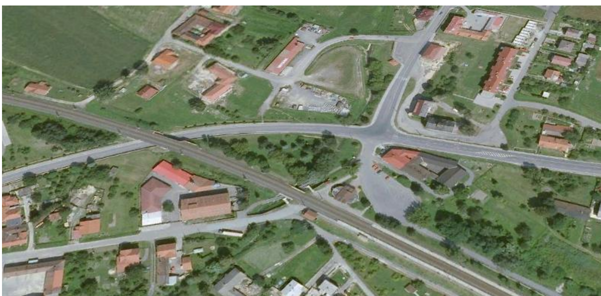
Obrázek č. 5 Křižovatka "U Žida" v Běloučíně [23]

Jedná se o čtyřramennou stykovou křižovatku "U Žida", na které bylo řízení dopravy upraveno zákonem o provozu na pozemních komunikacích. Běloučín se nachází v údolí na hlavním tahu z Hranic na Moravě na Český Těšín – hraniční přechod ČR-Polsko. Křižovatka je umístěna v centru obce Běloučín, kudy po hlavní pozemní komunikaci jedou řidiči z Hranic přímým směrem na Český Těšín. Dva jízdní pruhy z obou stran hlavní pozemní komunikace se před obcí sbíhaly do jednoho jízdního pruhu. Řidiči, kteří přijíždějí ke křižovatce ve směru od Hranic na Moravě po silnici č. I/47, projíždějí pod železničním mostem, který je součástí táhlé levotočivé zatáčky. Tato zatáčka má po obou stranách násypy zpevněné betonovou zdí. V tomto směru jsou v křižovatce dva jízdní pruhy – jeden pro odbočení vlevo na Odry, což je pokračování silnice č. I/47, druhý pro přímý směr na Český Těšín a pro odbočení vpravo k železniční stanici a parkovišti restaurace "U Žida". Ve směru od Českého Těšína řidiči přijíždějí po silnici č. I/48, na které jsou v křižovatce rovněž dva jízdní pruhy, levý pro odbočení k železniční stanici a pravý pro přímý směr a pro odbočení směrem na Odry.