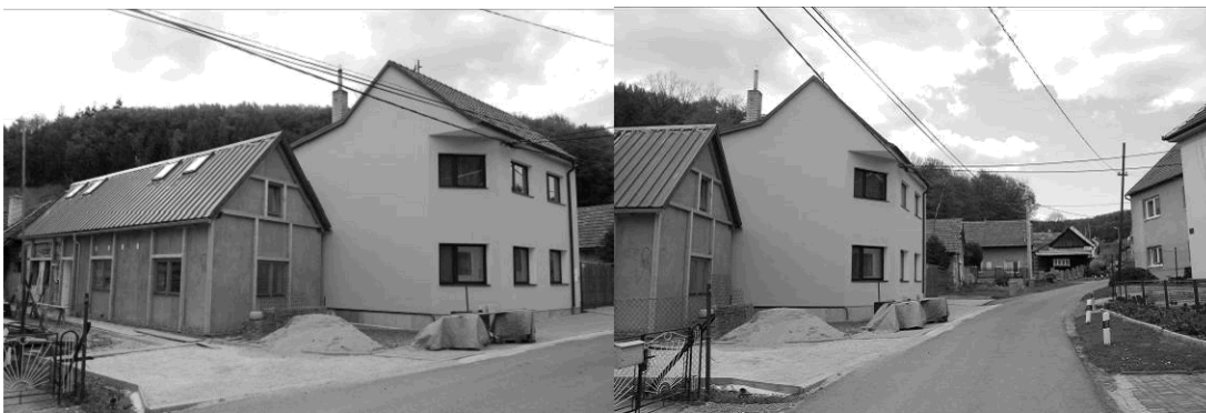
Foto, současný pohled na zástavbu v Prakšicích – Vinohradech. (Autor fotografií: A. Korčáková). 10

většina architektů, pracujících na realizacích spojených s vernakulární architekturou, nečerpá z relevantních zdrojů pro danou oblast?