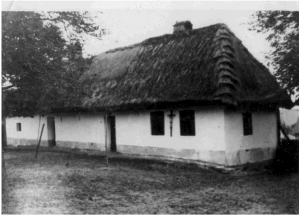
Foto, r. 1942, čelní pohled na dům č. p. 9 (obecní kronika obce Kelníky).