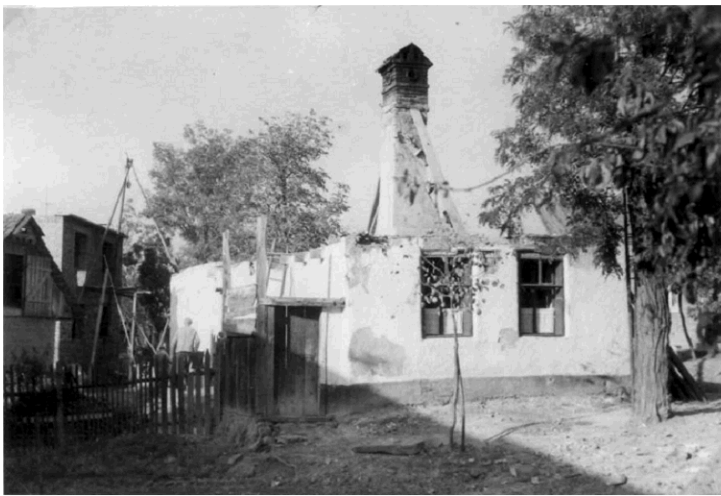
Foto, r. 1962, bourání domu č. p. 13 (obecní kronika obce Kelníky).