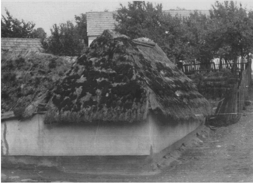
Fotografie domu č. p. 135 v Boršicích u Blatnice z archivu od p. Víta Hrabala. (Autor fotografie: K. O. Hrubý, r. 1952-53).