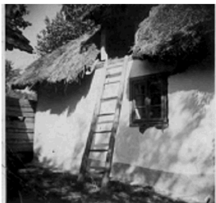
Foto, r. 1940, pohled ze dvora na dům č. p. 1 (obecní kronika obce Kelníky).

Obrazová příloha: Staré fotografie již neexistujících objektů: