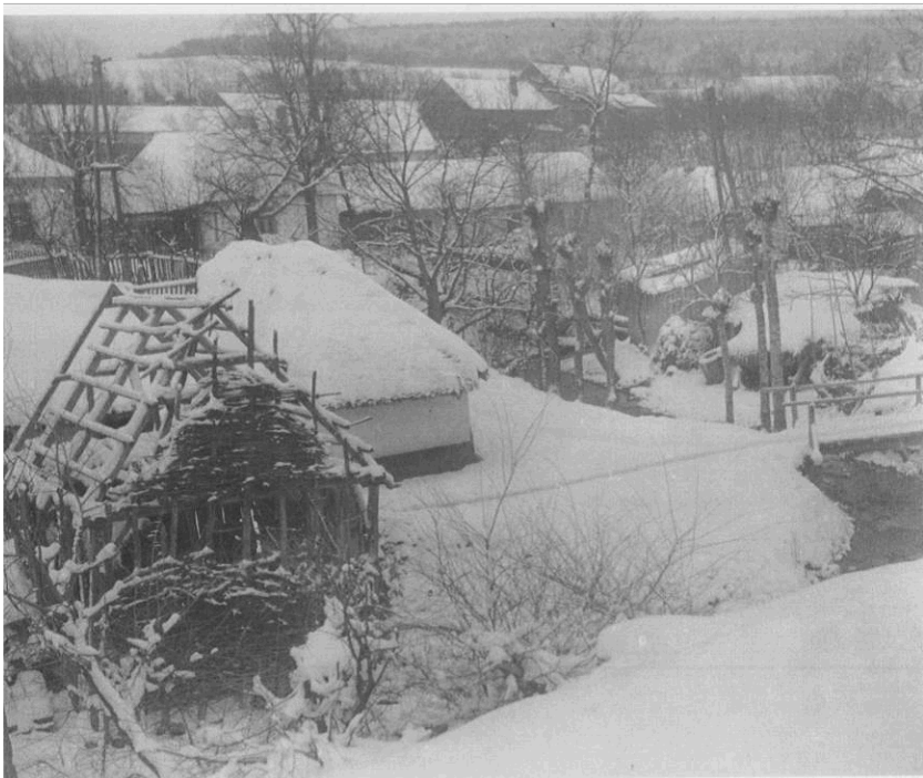
Fotografie domu č. p. 135 a seníku v Boršicích u Blatnice z archivu p. Víta Hrabala. (Autor fotografie: K. O. Hrubý, r. 1952-53).

Jak je vidět na těchto pár fotografiích, lidová architektura začala nejvíce mizet od 50. let 20. stol., posléze pak v dalších vlnách, zejména v 60. - 70. letech 20.stol. V těchto letech můžeme ještě vidět mnohé doznívající formy lidového domu, můžeme se zde setkat ještě s valbovou střechou a doškovou krytinou, kterou dnes známe buď z muzeí v přírodě nebo v některých případech ojediněle u chráněných nemovitých kulturních památek. Vše ostatní zůstává v paměti a na fotografiích, které se nám Dochovaly. Území Moravského Slovenska (Slovácka) bylo a je do značné míry dokumentováno, proto můžeme vycházet i z těchto Dochovaných relevantních zdrojů.