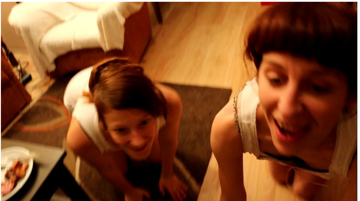
Domáci miláčik 4 video