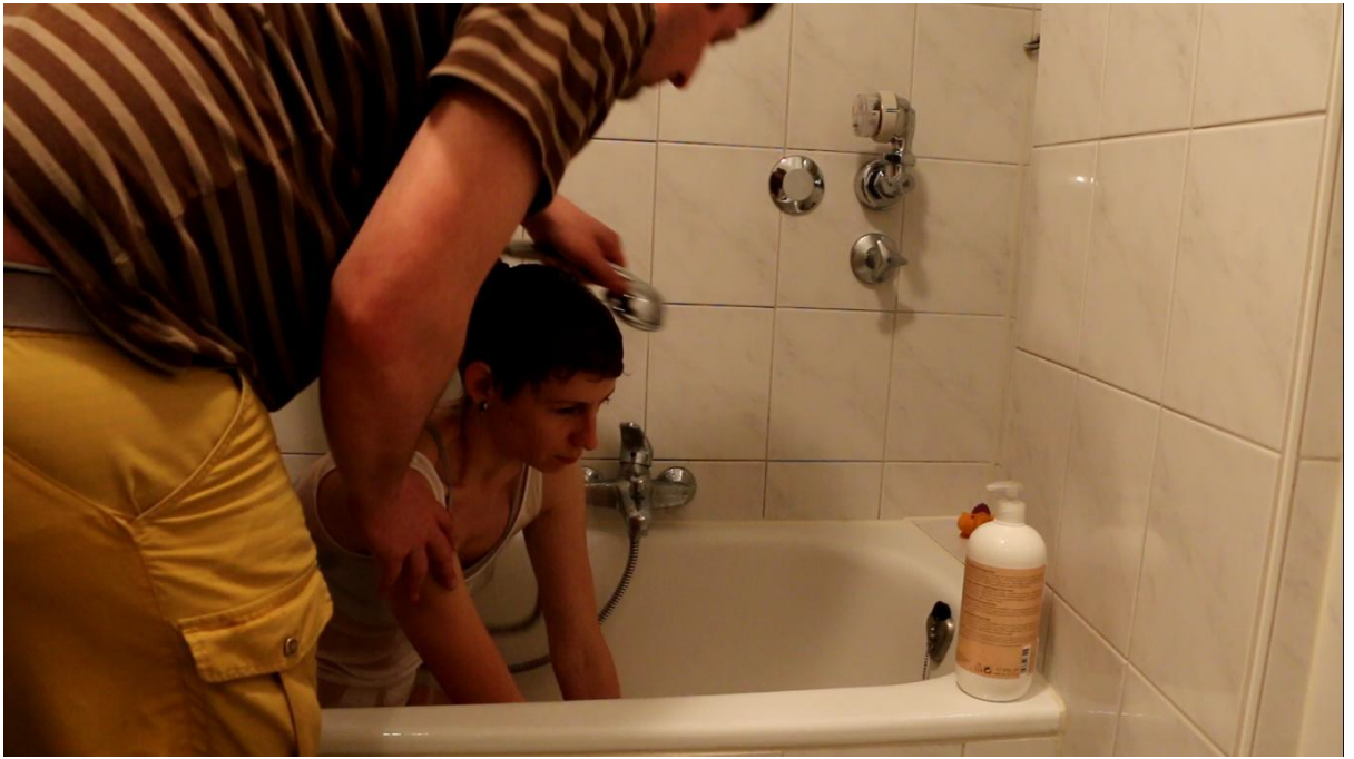
Domáci miláčik 3 video