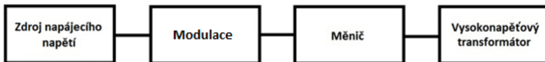
Obrázek 1: Blokové schéma obvodu