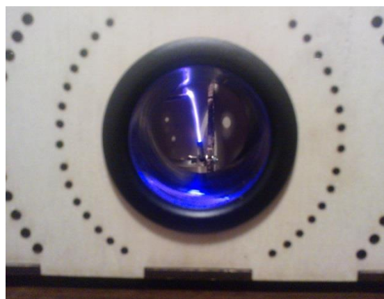
Obrázek 4: Hrající výboj ve funkci