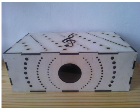
Obrázek 3: Sestavený konstrukční box

V programu AutoCAD byl vytvořen grafický návrh konstrukčního boxu. Tento návrh byl vyexportován do laserové řezačky a ze dřeva byly vyřezány jednotlivé díly pro box. Z jednotlivých částí byl sestaven konstrukční box a do něj zasazen sestavený obvod. Elektrody z wolframu byly uchyteny na elektrodotý systém, který zajišťuje udržení správné vzdálenosti elektrod.