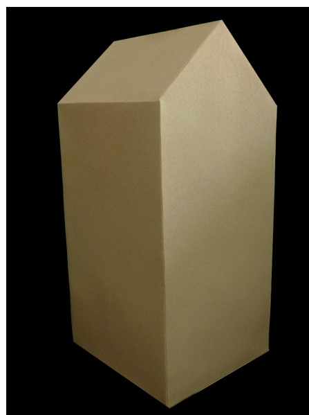
název: Kartonový domeček materiál/technologie: papír výška x šířka v cm: 235x120x100 rok vzniku: 2010