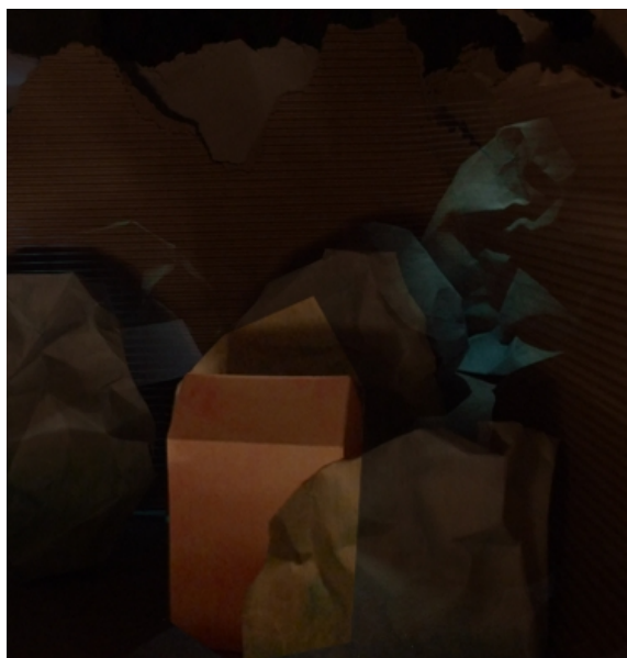
název: Simulace možného výsledku instalace materiál/technologie: Papírový model, kresba na papíře výška x šířka v cm: 50x100cm rok vzniku: 2010