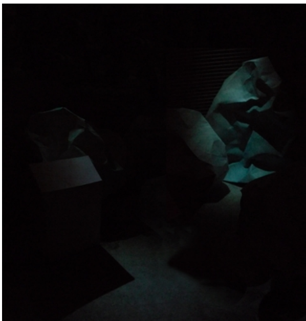
název: Simulace instalace materiál/technologie: Paprový model, kresba na papíře výška x šířka v cm: 50x100cm rok vzniku: 2010