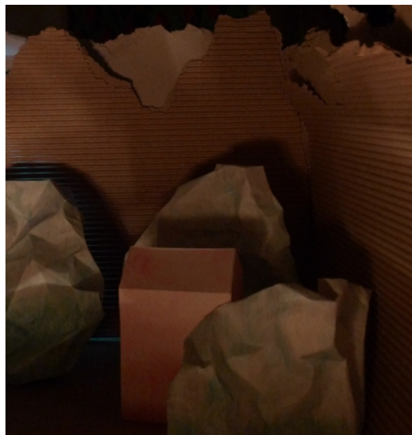
název: Simulace projekce materiál/technologie: Digitální fotografie výška x šířka v cm: 5x10 rok vzniku: 2010