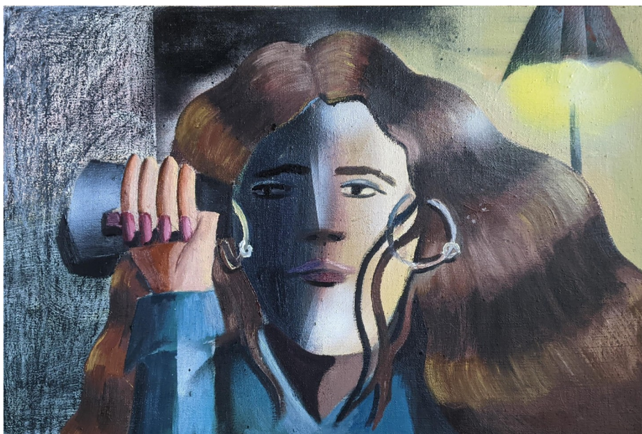
Za zdí , kombinovaná technika na plátně, 60 x 40 cm, 2022