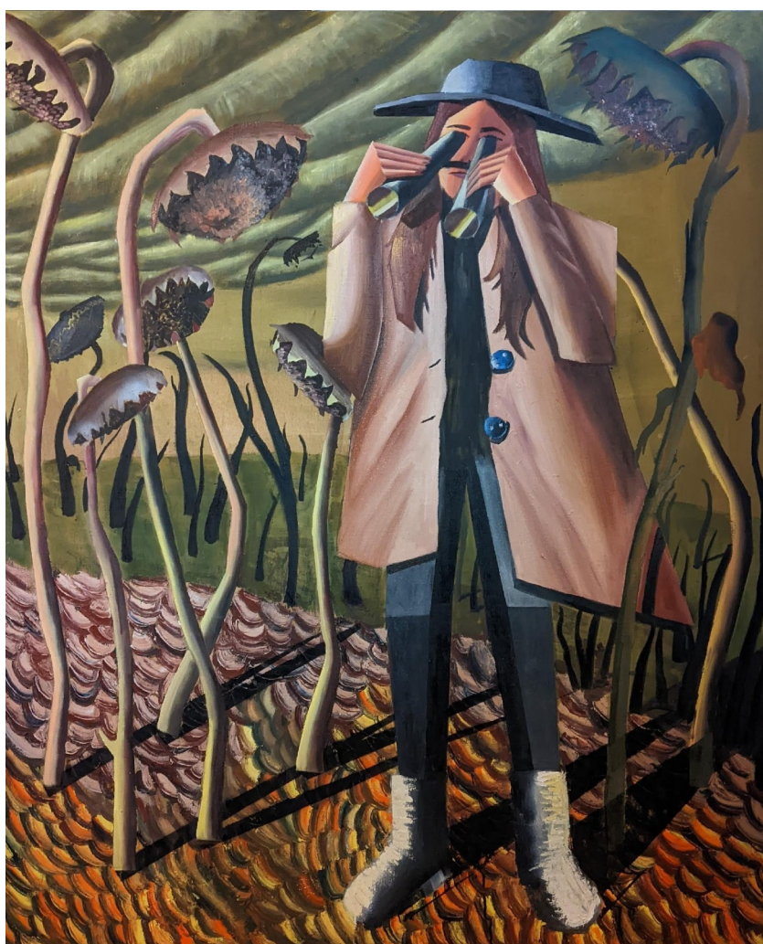
Slunečnicové pole, kombinovaná technika na plátně, 165 x 135 cm, 2022