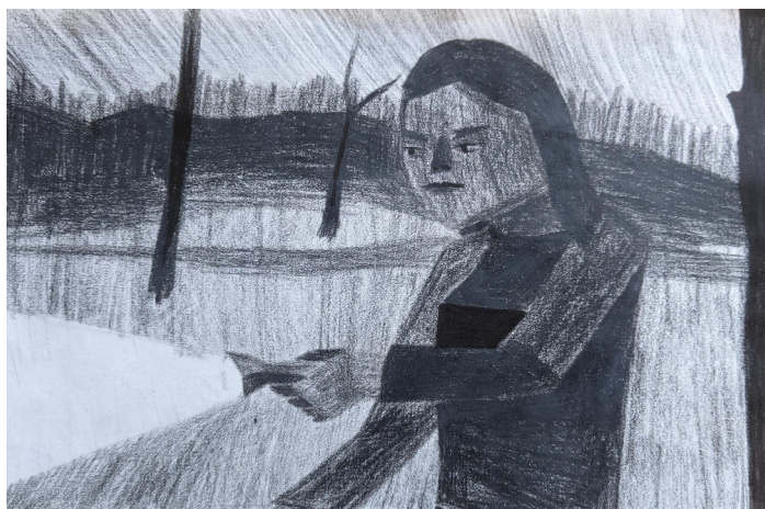
SKICY, kresby na papíře, A5, 2022/2023