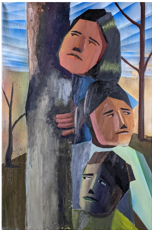
Bez názvu, kombinovaná technika na plátně, 60 x 40 cm, 2023