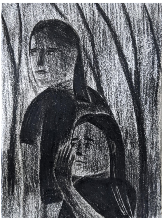
Kresba III. , kresba na papíře, 14 x 11,2 cm, 2023