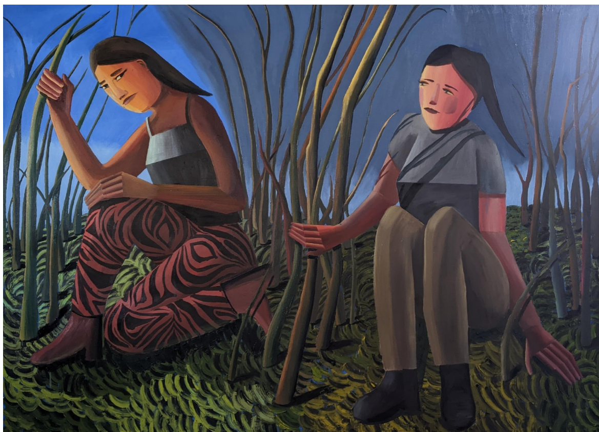
Vteřiny před bouří, kombinovaná technika na plátně, 150 x 200 cm, 2023