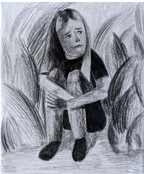
Kresba I. , kresba na papíře, 14,5 x 12,4 cm, 2023