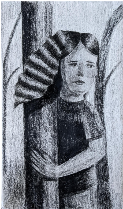
Kresba II. , kresba na papíře, 17,8 x 13 cm, 2023