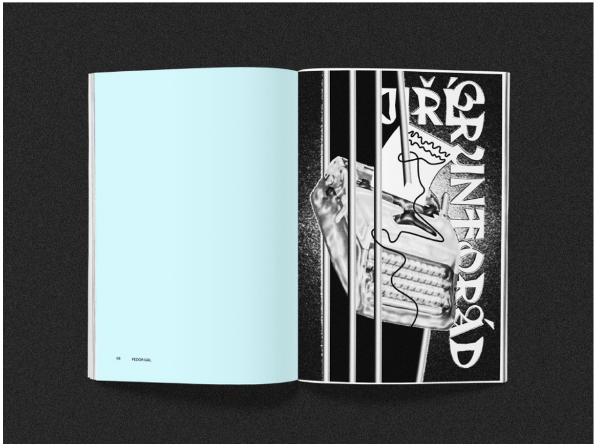
publikácia Pravda zvt'azi, risografia, A5: PREDELY KAPITOL