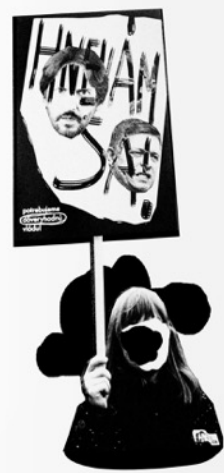
publikácia Pravda zvt'azí, risografia, A5: OBRAZOVÉ DVOJSTRANY

...nara Je priateľky martiny nám naplno od- štátu. Mafia v tesnej blízkosti premié- a vsadč... kryla zlo ukryté v základoch nášho štátu. Mafia v tesnej blízkosti premié- čkou ľa Trnavčania, ra a všadepritomná korupcia sú len šdia bl ohavná vražda novinára Jána a jeho odom, priateľky Martiny nám naplno od- Tma ohavi kryla zlo ukryté v základoch nášho štátu. Mafia v tesnej blízkosti premié- vriatel ra a všadepritomná korupcia sú len vľa zlk špičkou ľadovca. Dúfali sme, že táto tu. M tragédia bude pre vládu budičkom vsad a dôvodom na zásadné změny . Av- ou ľe šak namiesto toho môžeme posledné ia bi dni vnímať iba ohlušujúcu aroganciu om moci. Ján zasvätil svoj život boju za est' lepšie Slovensko a my máme povin- "ib: nosť v tomto boji pokračovať. Podme est' (v piatok) pripomenúť mocným, že sme est' ľudia, ktorí si ctia pravdu a spravodli- žšá vosť. Ukážme im, že odmietame žiť oji v unesenej krajine. te. Postavme sa za slušné Slovensko! p... a st. (v piatok) ... že odmieta, ľudia, ktorí si ctia pravdu a spravodli- v... odmietame žiť ...ali sme, že táto ádu budičkom né změny . Av- rôžeme posledné ujúcu aroganciu 'oj život boju za ny máme povin- kračovať. Podme ľ mocným, že sme avdu a spravodli- e odmietame žiť slušné Slovensko!