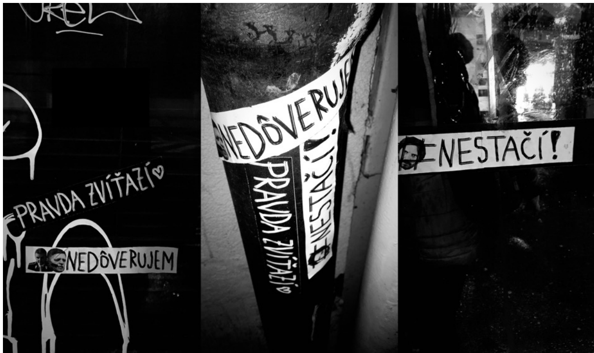
protest plagáty, čiernobiela digitálna tlač, A3 protest nálepky, čiernobiela digitálna tlač, 210×50 mm