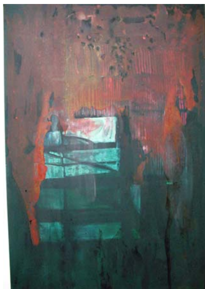
název: Bez názvu 2 materiál/technologie: Akryl na knihařském plátně výška x šířka v cm: 120x85 cm rok vzniku: 2010