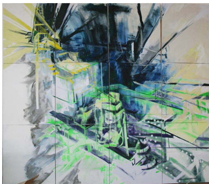
název: Bez názvu 4 materiál/technologie: Akryl na knihařském plátně výška x šířka v cm: Dvanáckrát 61x 71, 5 ( =244x214.5) rok vzniku: 2009