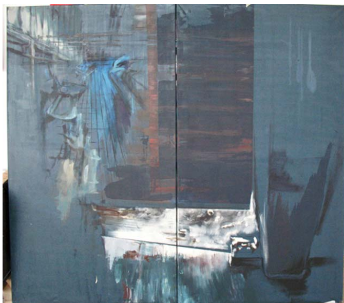
název: Bez názvu 3 materiál/technologie: Akryl a kvaš na knihařském plátně výška x šířka v cm: Dvakrát 95x170 ( =190x 170) rok vzniku: 2009