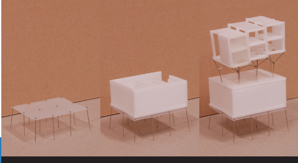
Základové piloty do únosné hloubky Hydroizolační vana Ztužený ocelový skelet