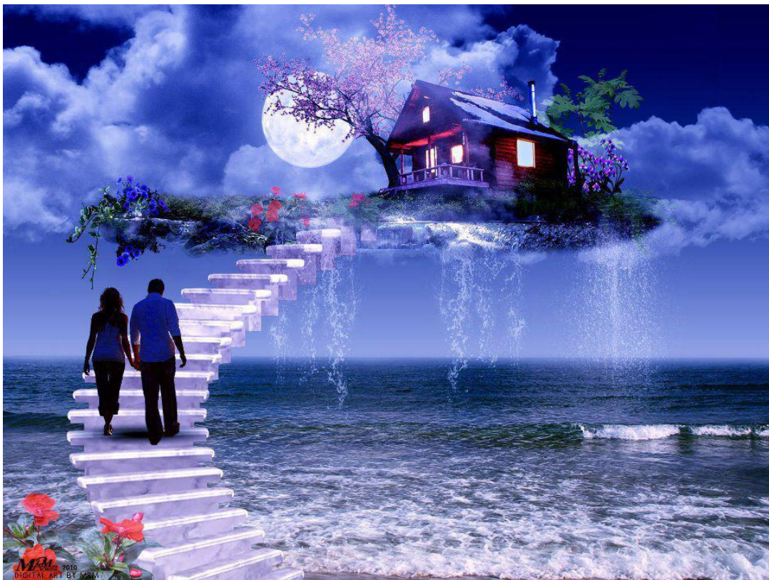
Ilustrační obr., stažený z internetu 19.2. 2012, autor neznámý