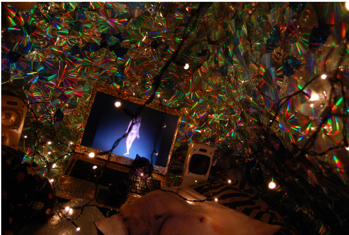
Rosarium rozličných rozkoší , video-instalace a performance, 16.7. 2011, 10.00 – 18.00, Videokemp, park za Domem umění, Brno

K obhajobě bude předložena performance, zde prozatím úvahové skici, předešlé související performance a ilustrace.