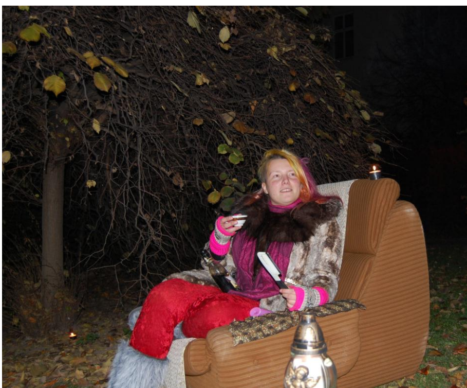
Návrat královny , performance na vernisáži výstavy, 16.11. 2011, 18.00-20.00 Galerie 115/55, FFMU, Arne Nováka 1, Brno