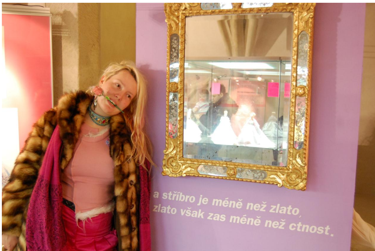
fotoperformance, 29.1. 2012, Hrad Špilberk