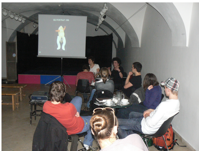
Horní menu - vložit - obrázek - ze souboru ...

název: To už tu bylo a doufám, že stále bude ... rozsah (délka trvání, počet zúčastněných): 27.4.-29.4 2010, 3 zúčastněné popis akce (další údaje dle potřeby): Painting-performance: Zdenka Řezbová-Morávková, Denisa Belzová, Lenka Vráblíková rok vzniku či další časové údaje: 2010