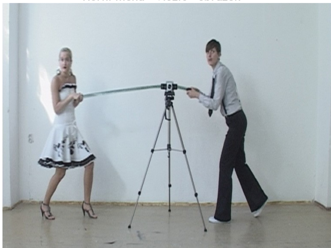
ze souboru ...