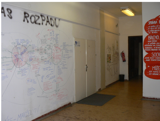
Horní menu - vložit - obrázek - ze souboru ...

název: BDSM, hranice normality a konsensus v sexualitě rozsah (délka trvání, počet zúčastněných): 19.4.2010, 14.00-18.00 hod, 8 zúčastněných popis akce (další údaje dle potřeby): Workshop a diskuse, ve spolupráci s Gender Fuck Fenny rok vzniku či další časové údaje: 2010