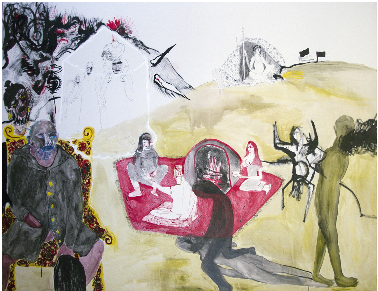
8., olej a tuš na plátně, 150x200, 2015