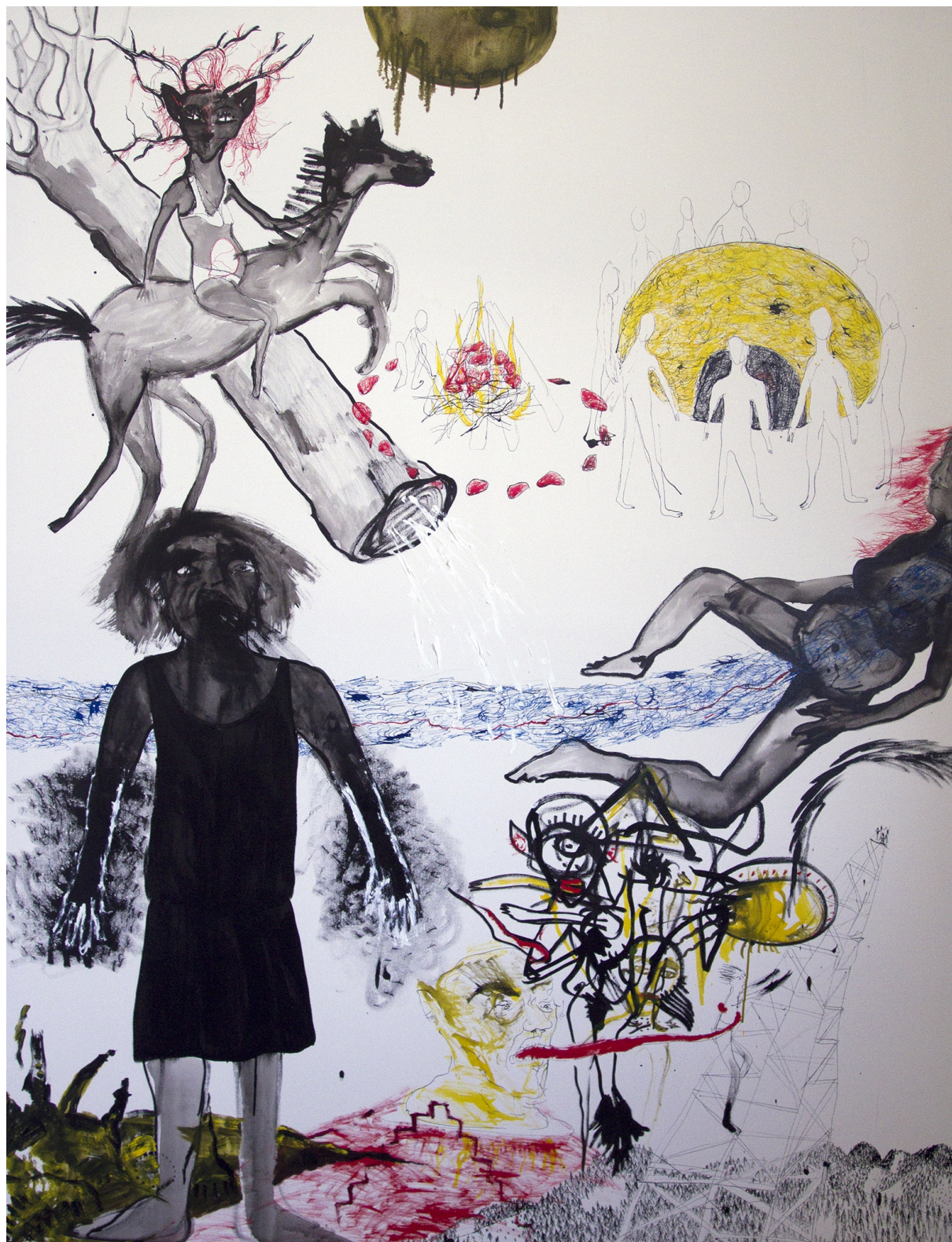
2., olej a tuš na plátně, 200x150, 2015