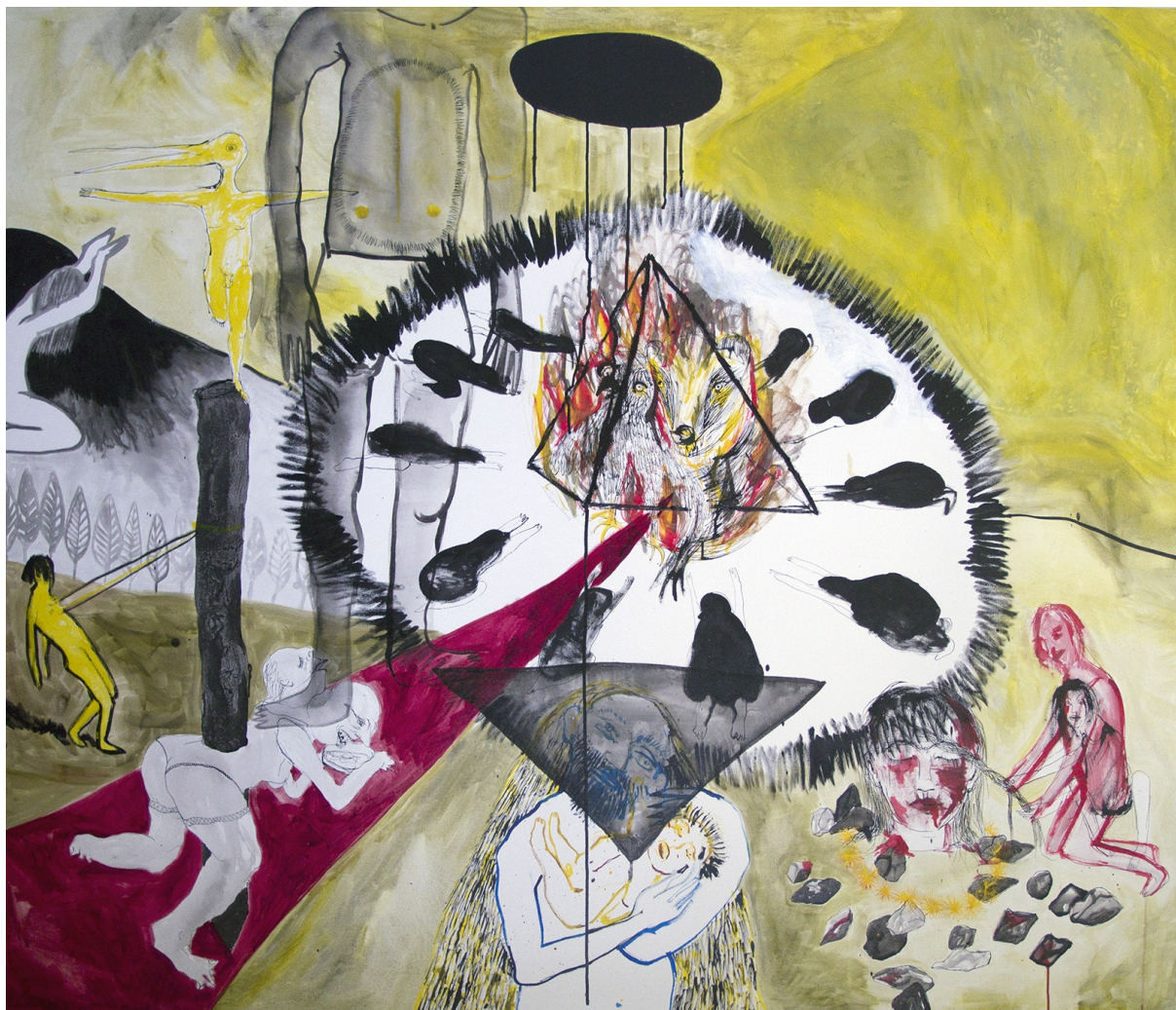
6., olej a tuš na plátně, 170x200, 2015