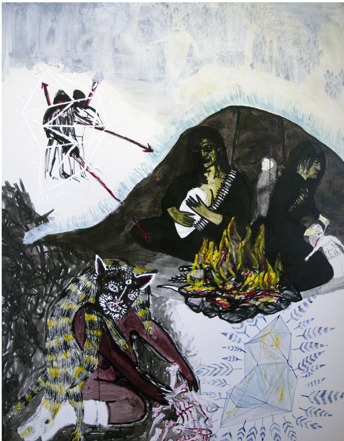
7., olej a tuš na plátně, 150x170, 2015