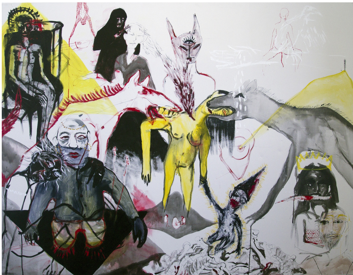
3., olej a tuš na plátně, 130x170, 2015