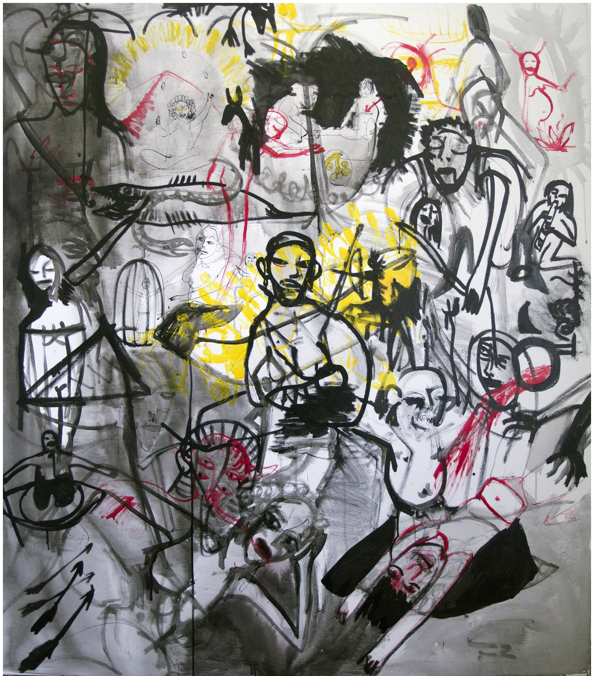
9., olej a tuš na plátně, 130x150, 2015