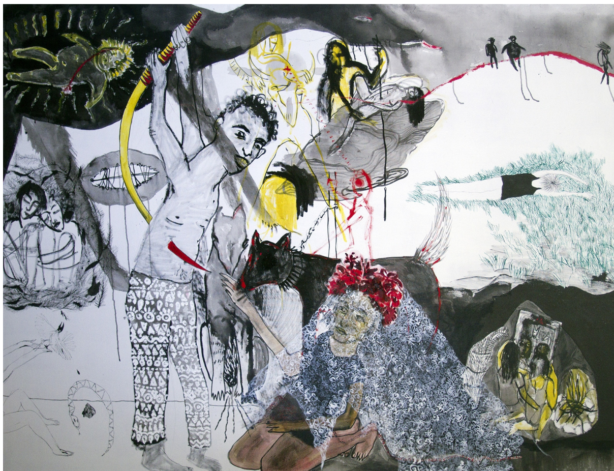
10., olej a tuš na plátně, 150x200, 2015