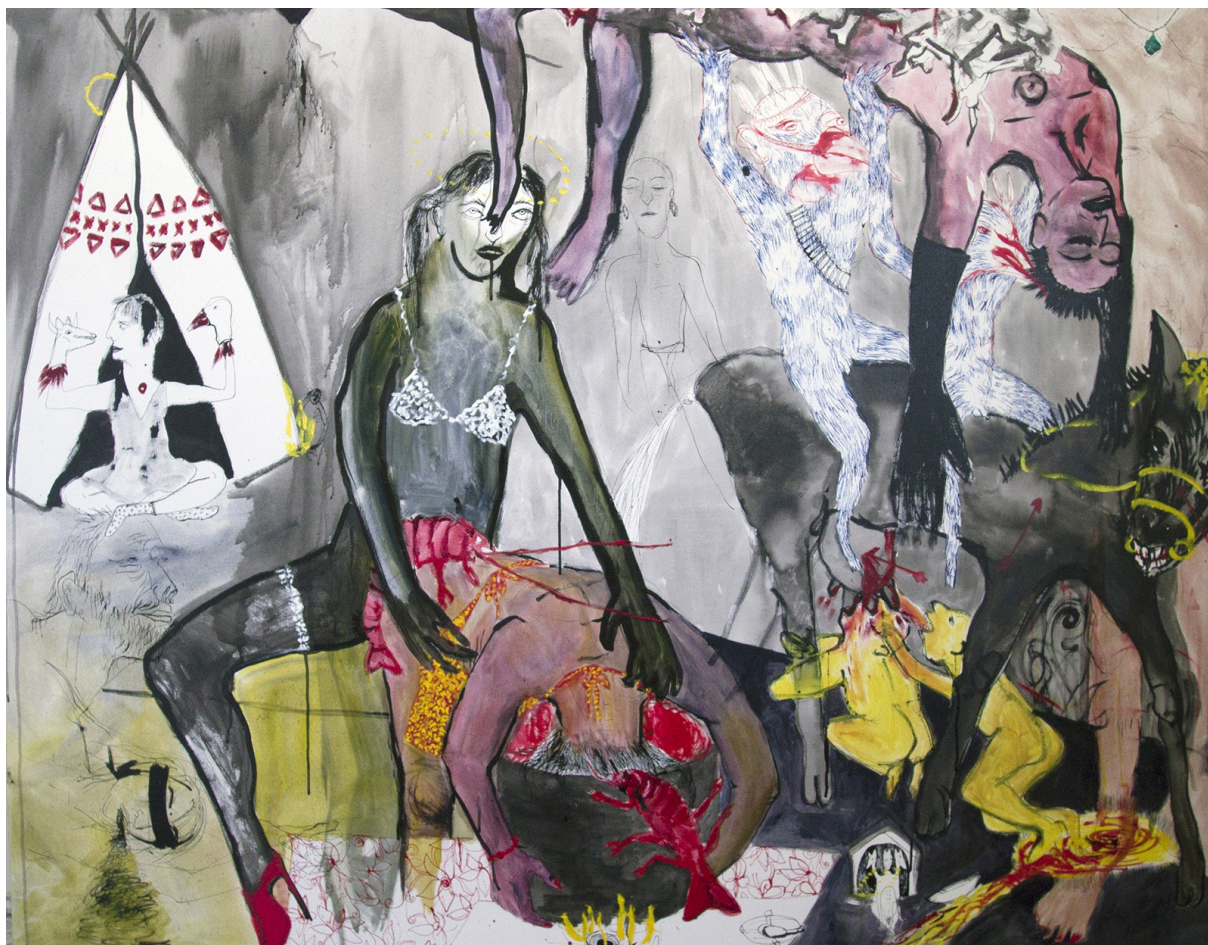
4., olej a tuš na plátně, 130x170, 2015