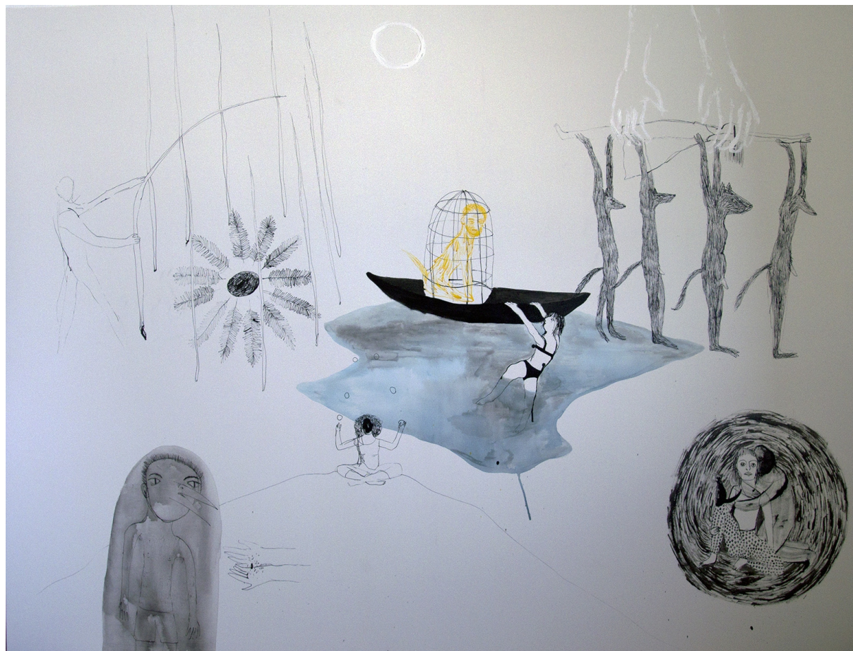
1., olej a tuš na plátně, 150x200, 2015

K obhajobě předkládám 10 obrazů na plátně: