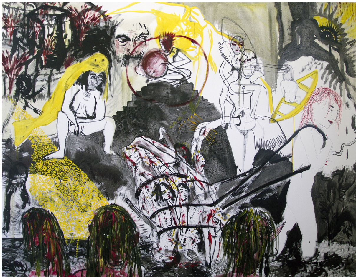
5., olej a tuš na plátně, 130x170, 2015