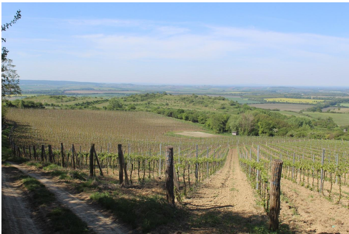
Pohled na viniční trať Růžová