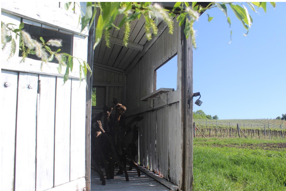
Vrůstání (fáze 1)