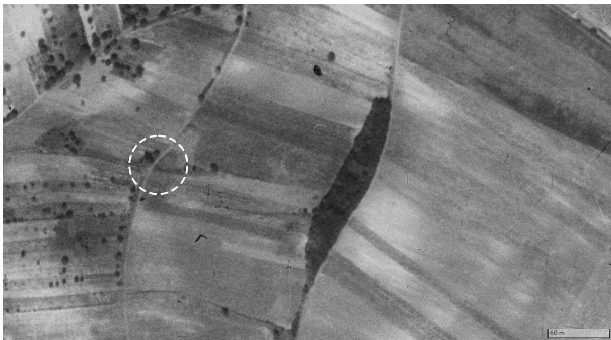
Růžová, rok 1953