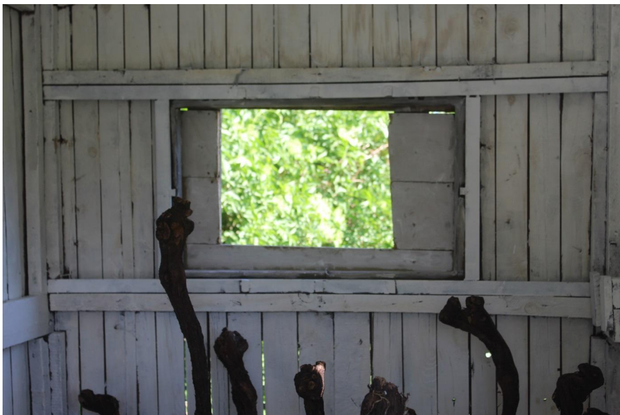
Průhled a instalace Vrůstání (fáze 1)