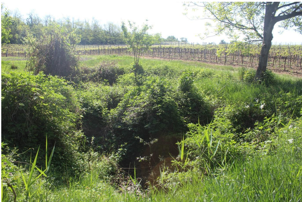
Jáma s pramenem