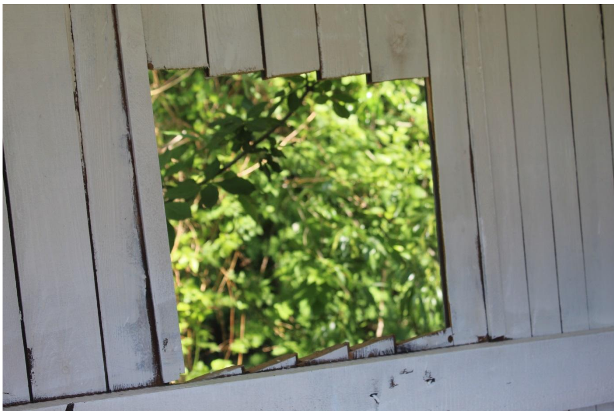
Průhled západním oknem