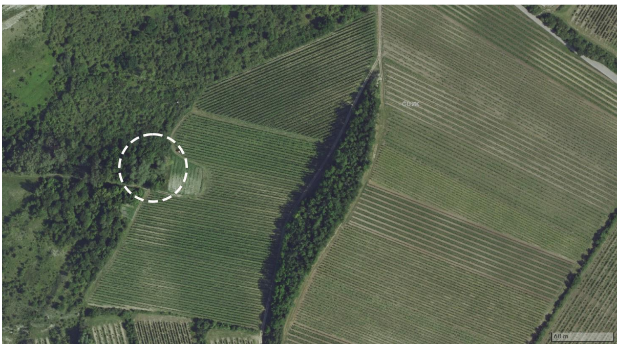
Růžová, současnost