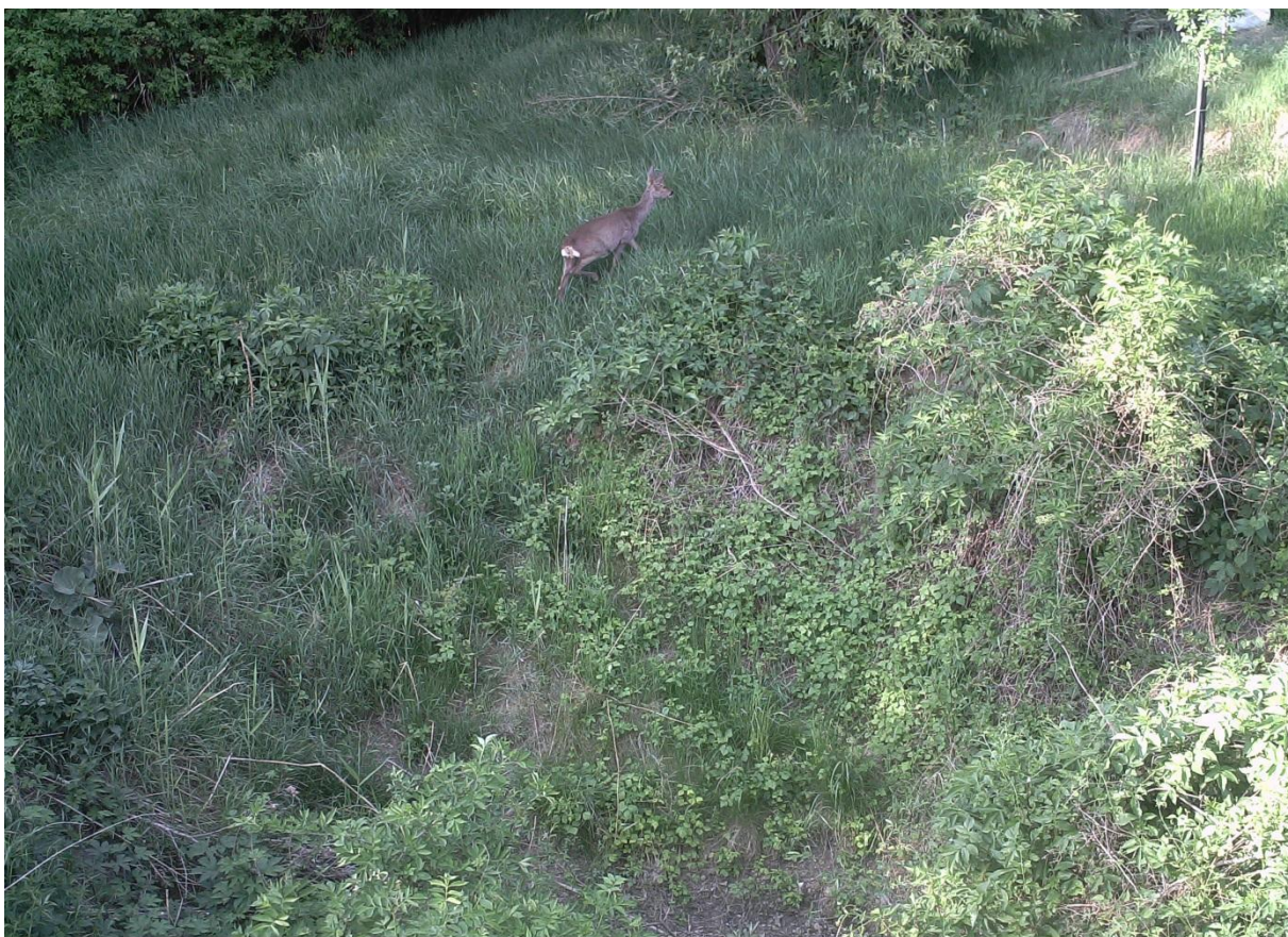
Fotografie z fotopasti