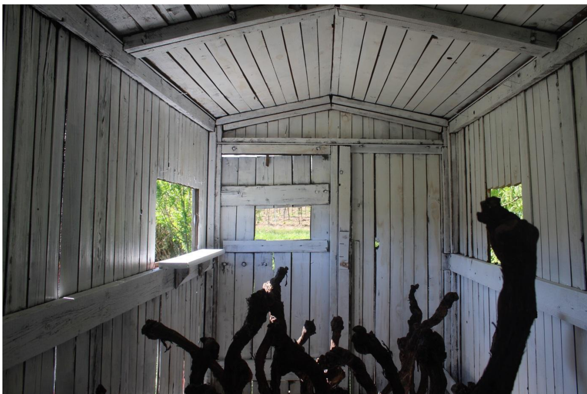
Interiér maringotky a instalace Vrůstání (fáze 1)