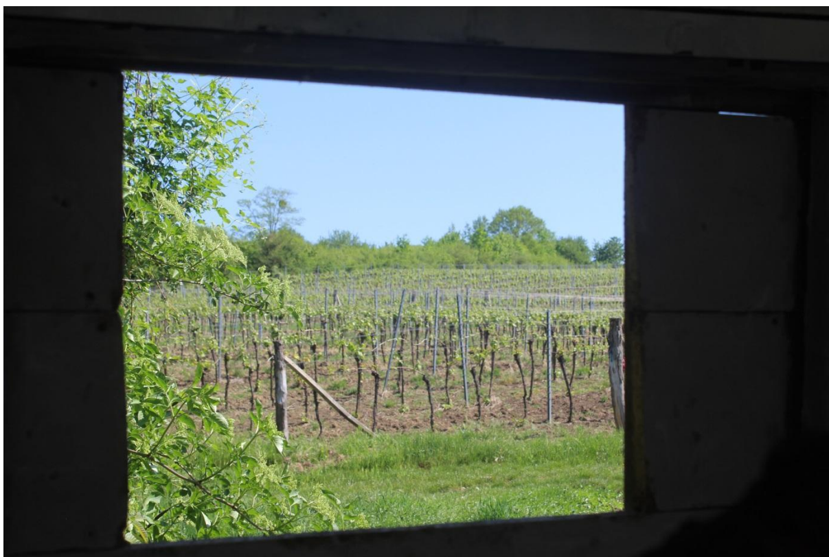
Průhled severním oknem