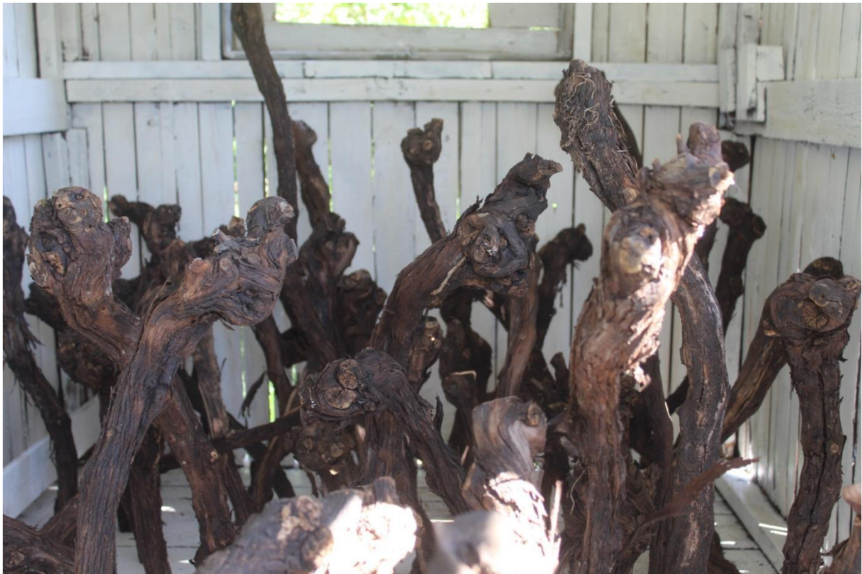
Vrůstání (fáze 1), detail