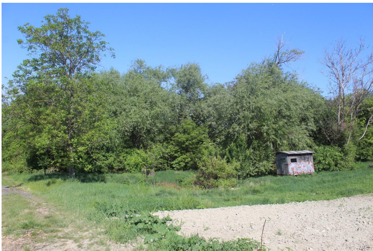
Pozemek s maringotkou a jámou s pramenem