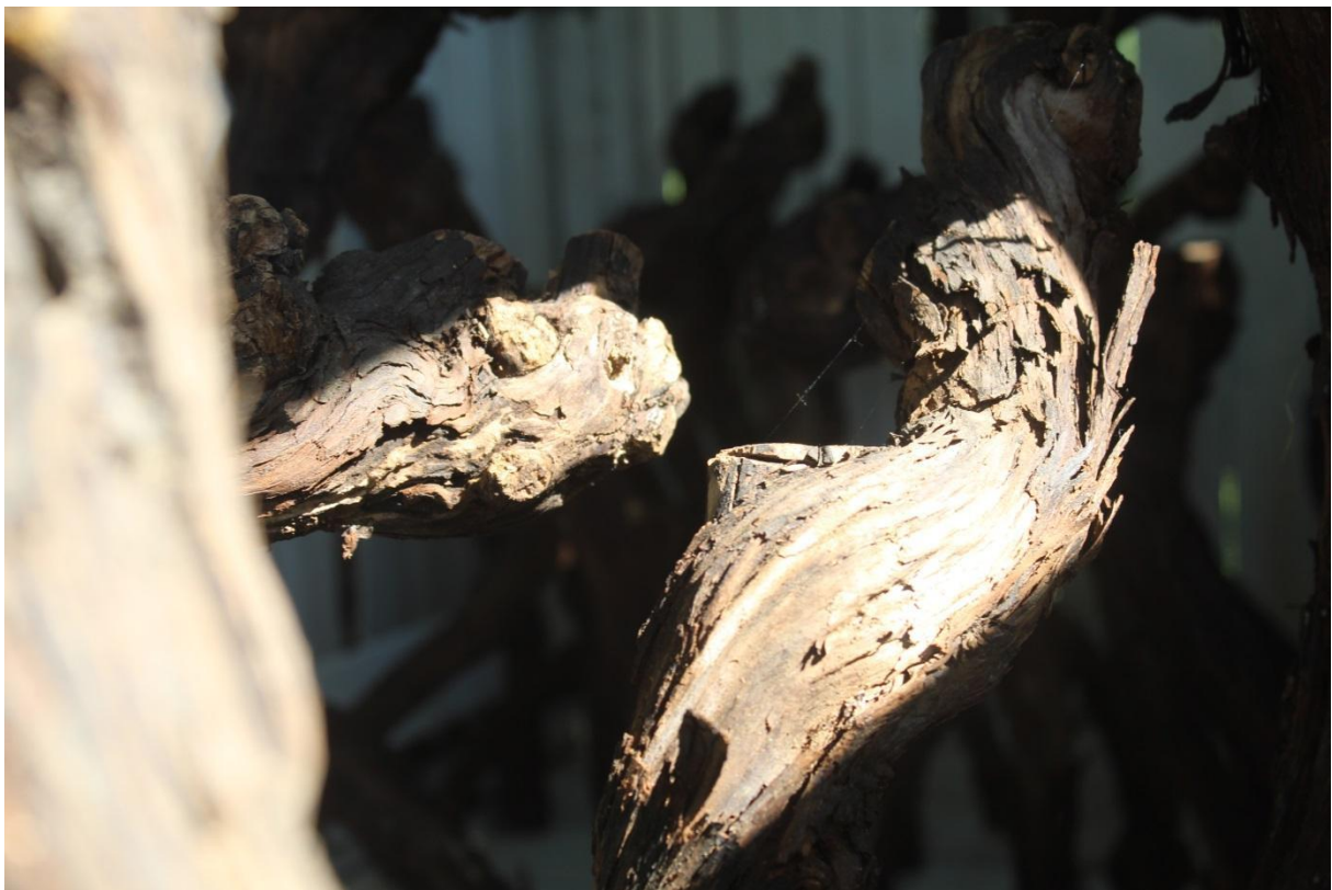
Detail vinné révy