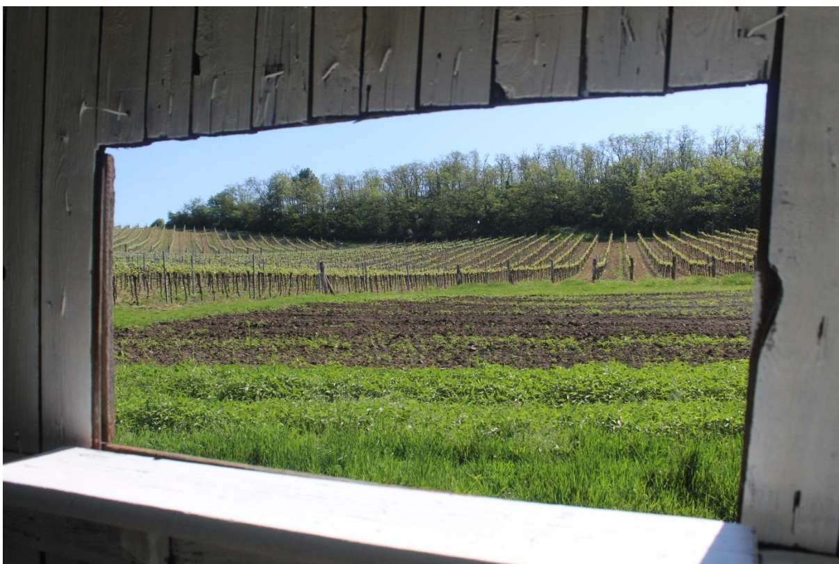
Průhled východním oknem