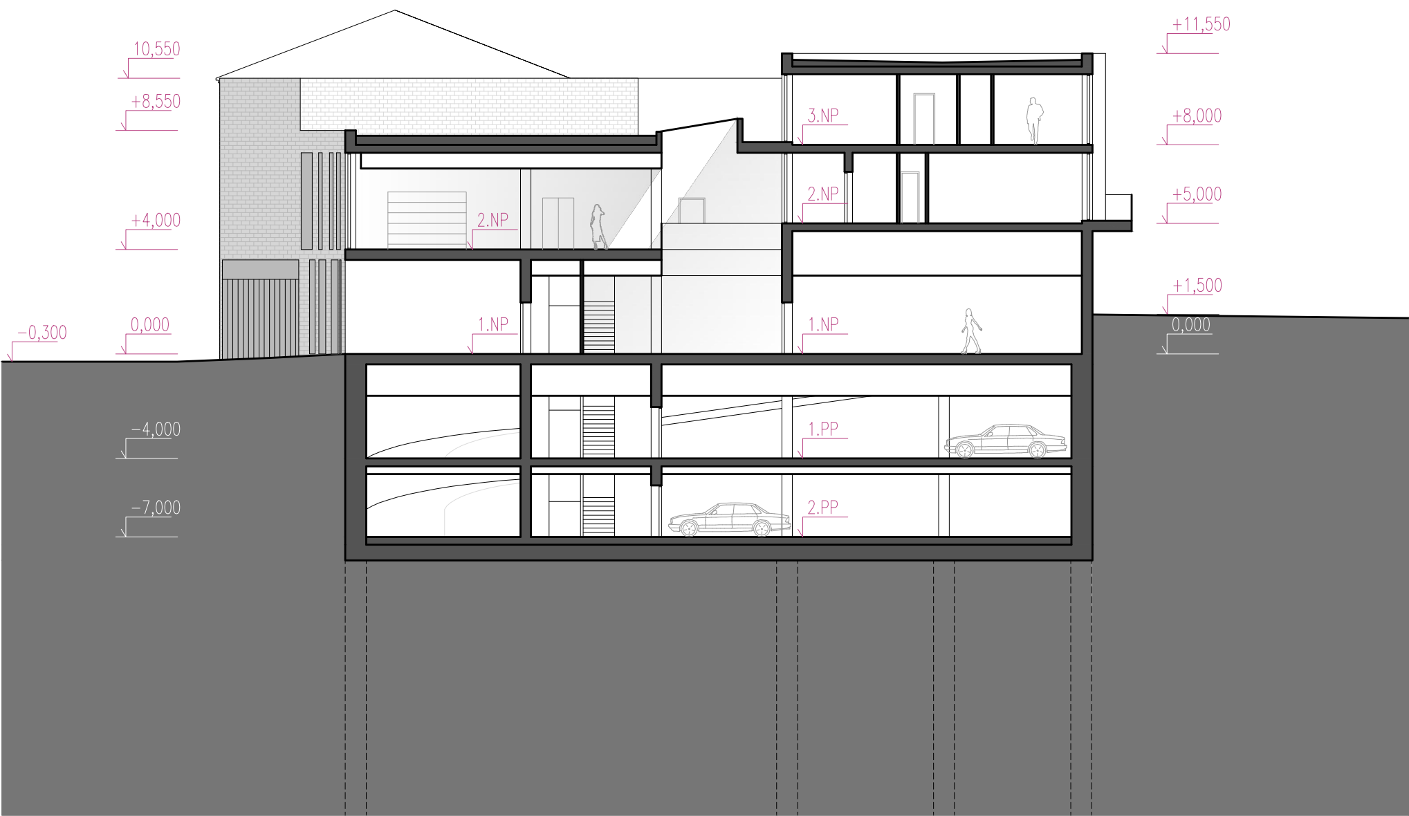
Řez B-B' (M 1:200)