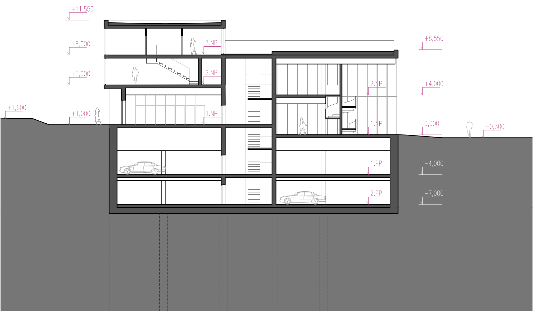
Řez C-C' (M 1:200)