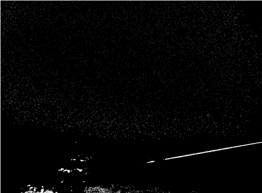
Vstupný binárny obraz

Predpočítanie uhlov \cos\theta a \sin\theta