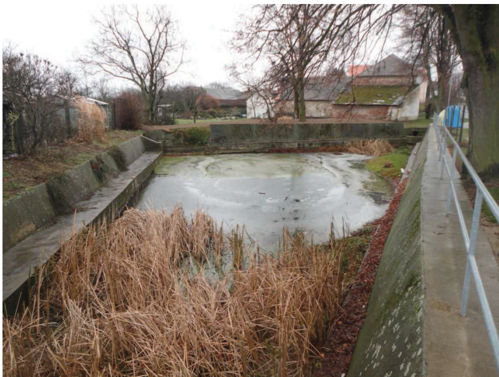
Obr. 10 Požární nádrž v obci