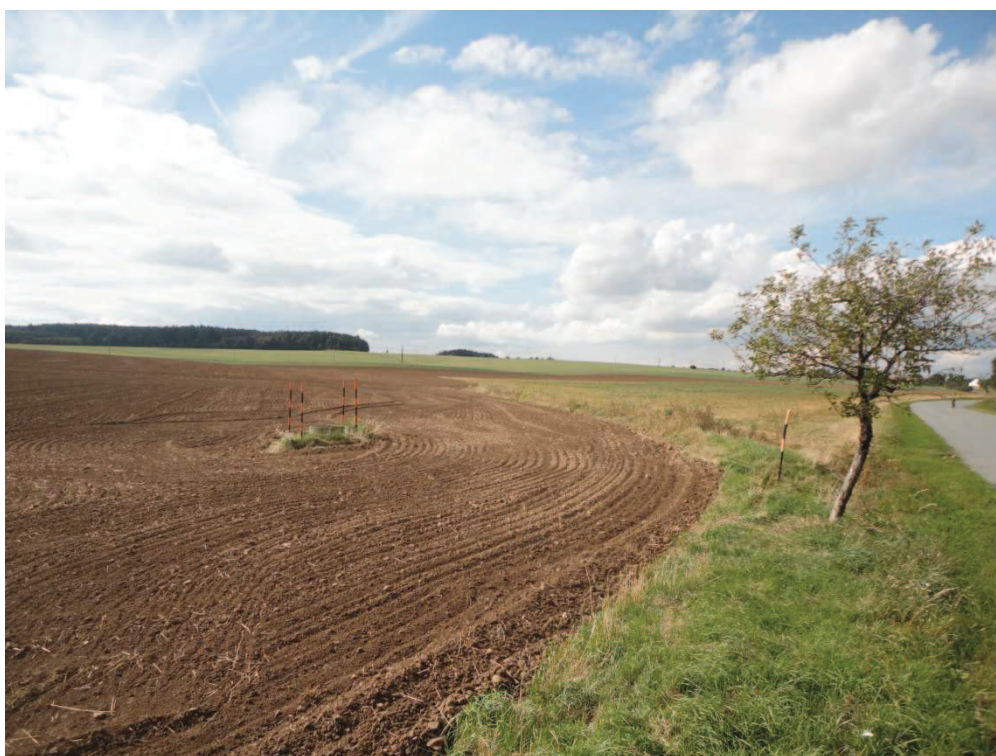
Obr. 3 Lokalita pro navržený přeliv