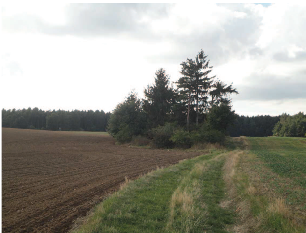
Obr. 7 Polní cesta tvořící odtokovou linii