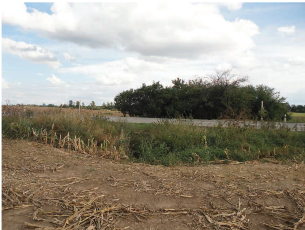
Obr. 8 Retenční prostor v jižní části