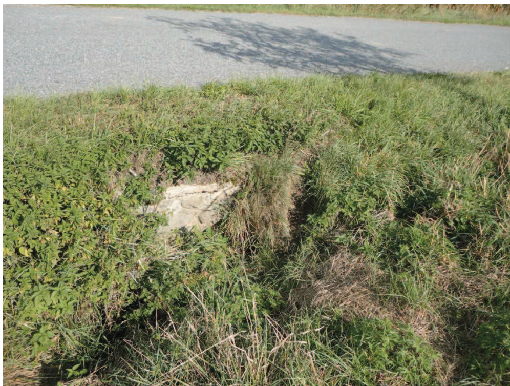
Obr. 4 Stávající stav propustků