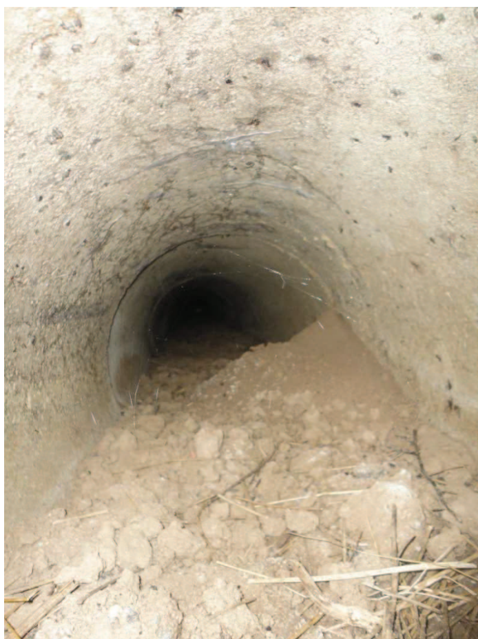
Obr. 5 Stávající stav propustků