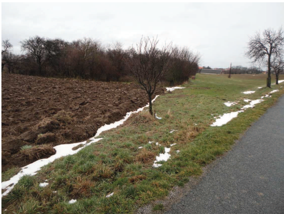
Obr. 12 Lokalita pro navrženou retenční nádrž