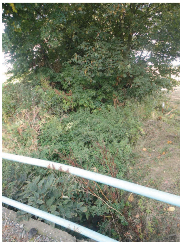
Obr. 9 Stav odvodňovacích příkopů