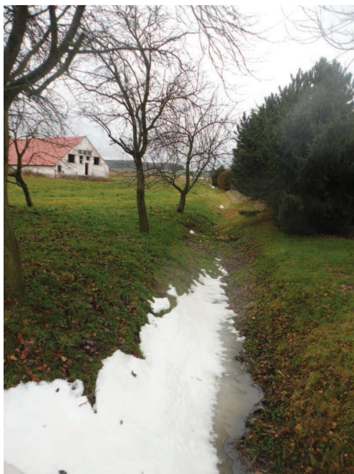
Obr. 11 Stávající příkop v obci