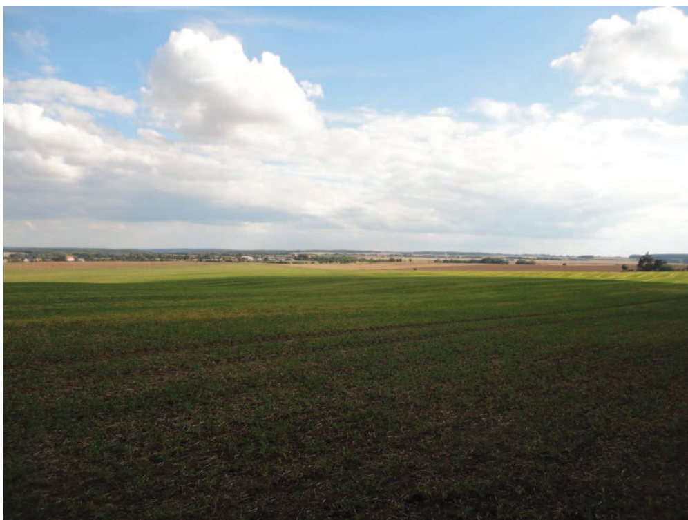
Obr. 6 Pohled na obec Račice z nejvyššího bodu řešeného povodí