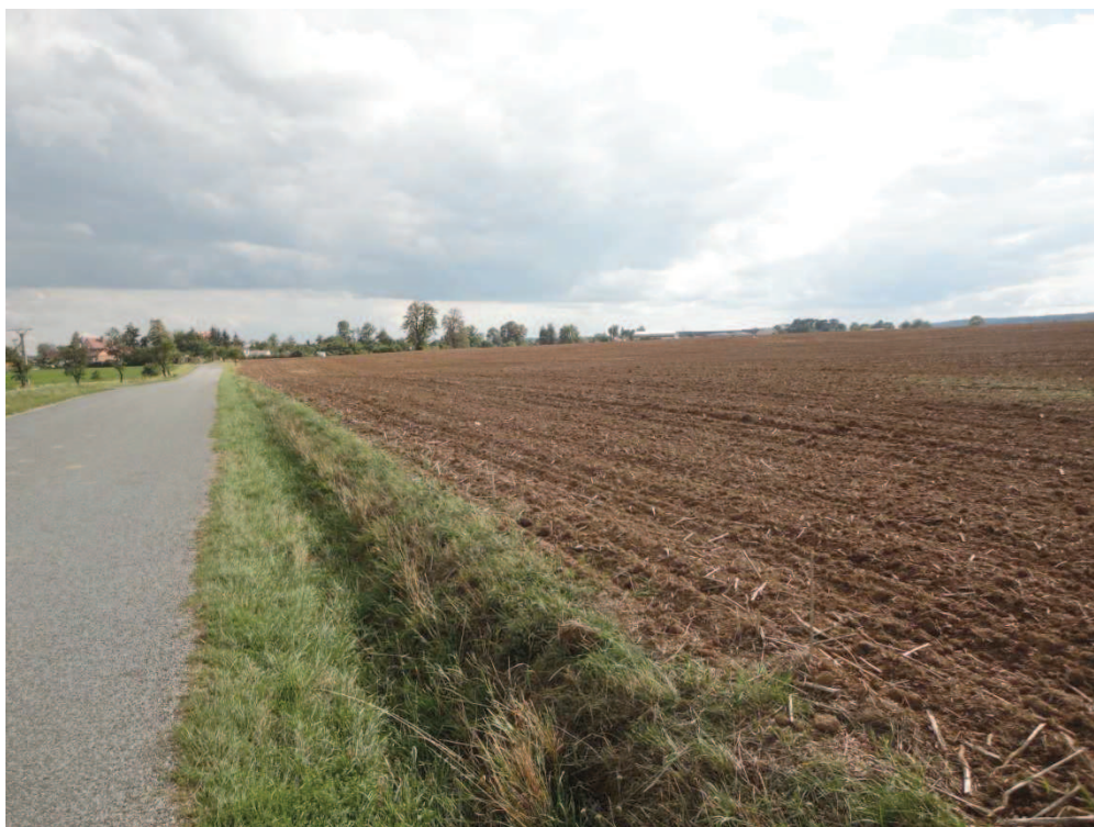
Obr. 2 Stávající odvodňovací příkop