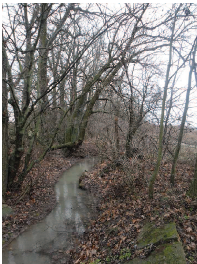
Obr. 13 Račický potok