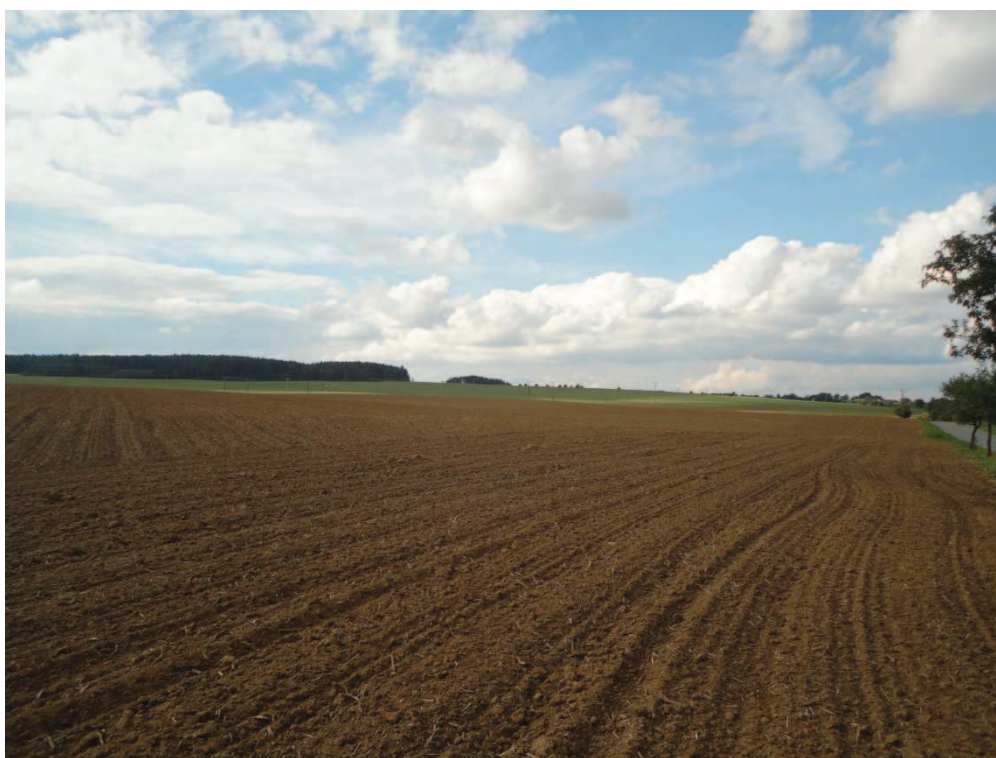
Obr. 1 Část řešeného povodí

Prováděná fotodokumentace byla využita později ať už pro výpočet odtoků z dílčích povodí a také pro návrh nových hydrotechnických opatření.