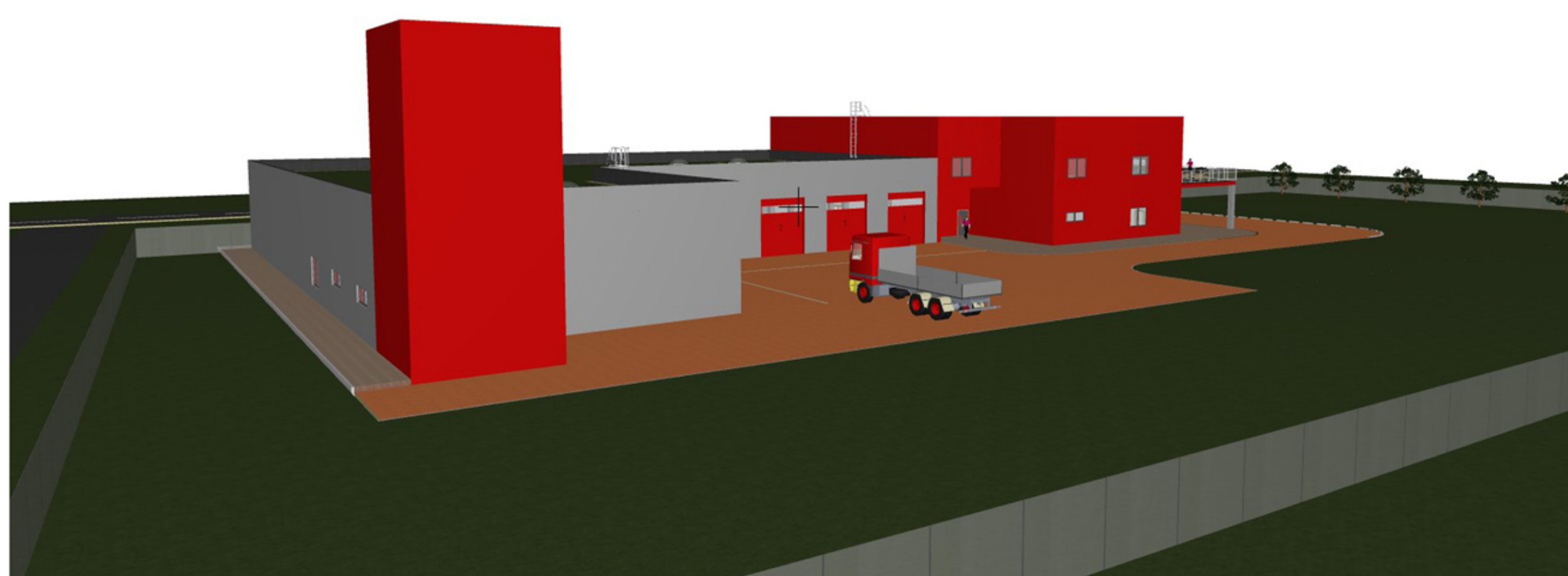
Pohled - jih