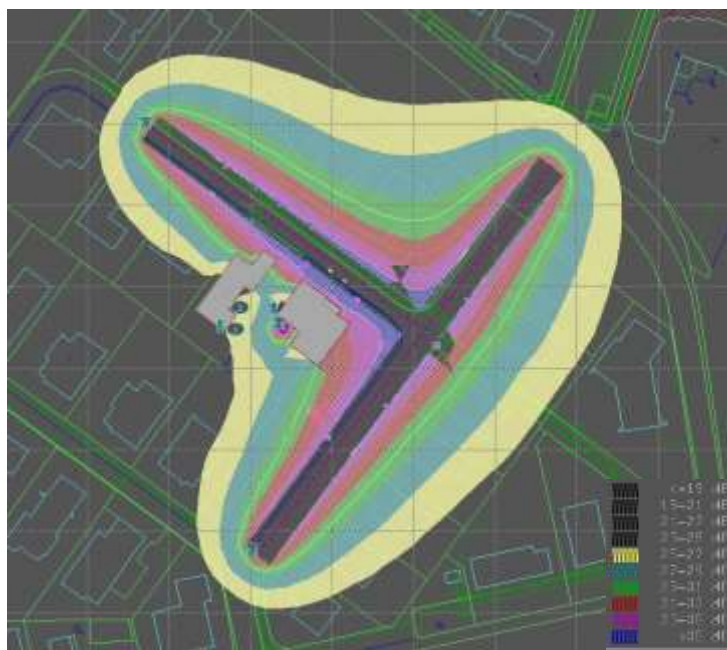
Obr. 7 Hluková mapa pro noc [Autor, Hluk+]