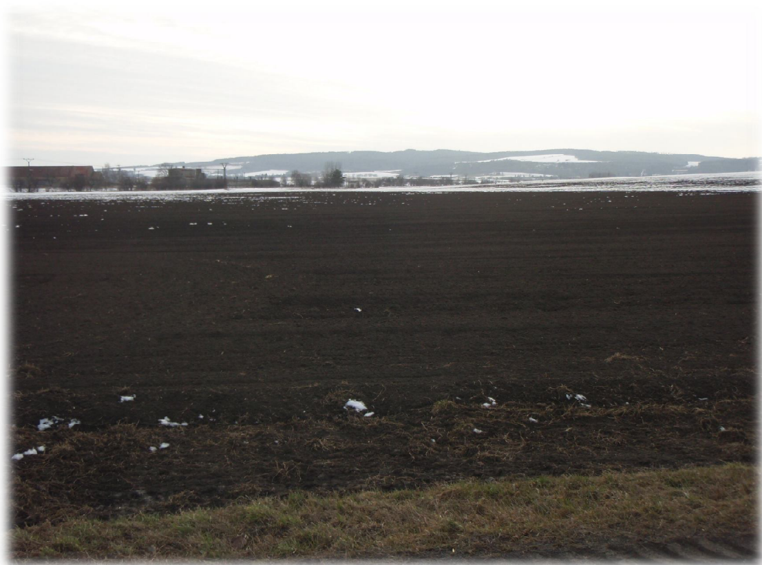
(17) Pohled západně od křížení 2 s komunikací III. třídy