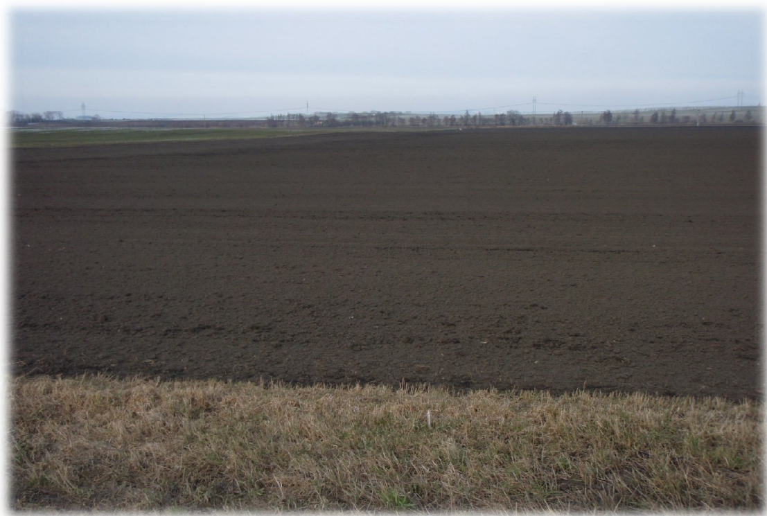
(16) Pohled východně od křížení 2 s komunikací III. třídy