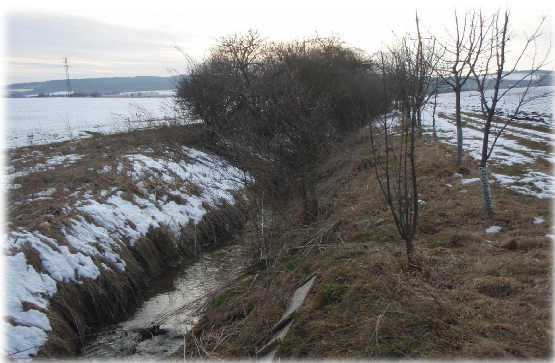
(18) Křížení s vodotečí 2 – potok Slatinka