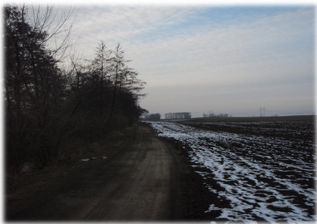
(11) Křížení s vodotečí 1 – řeka Blata