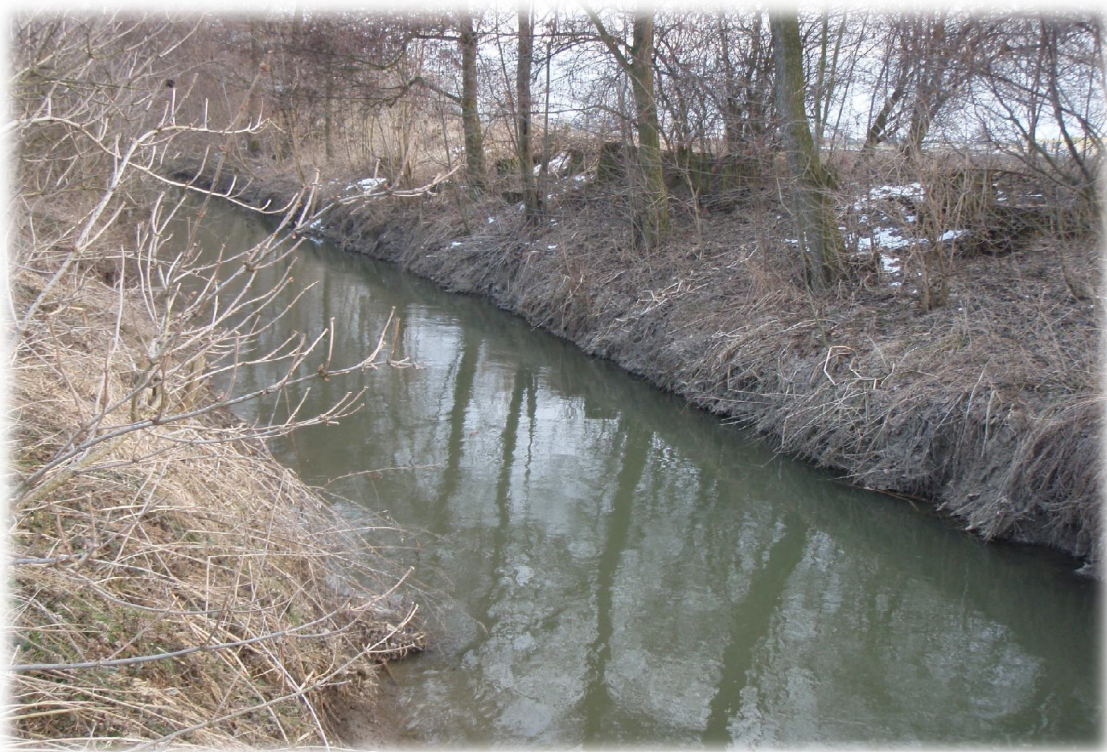
(12) Řeka Blata