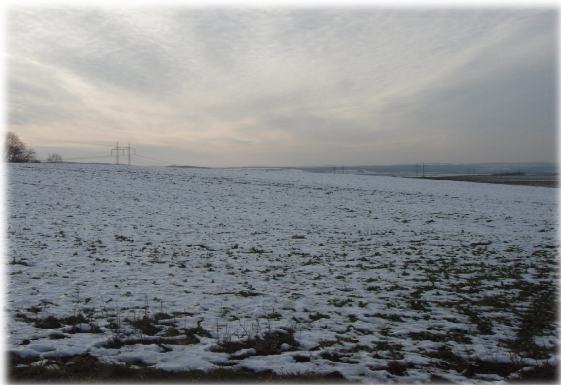
(7) Křížení 1 s komunikací III. třídy – pohled na západ