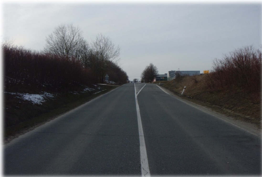
(1) Začátek úseku