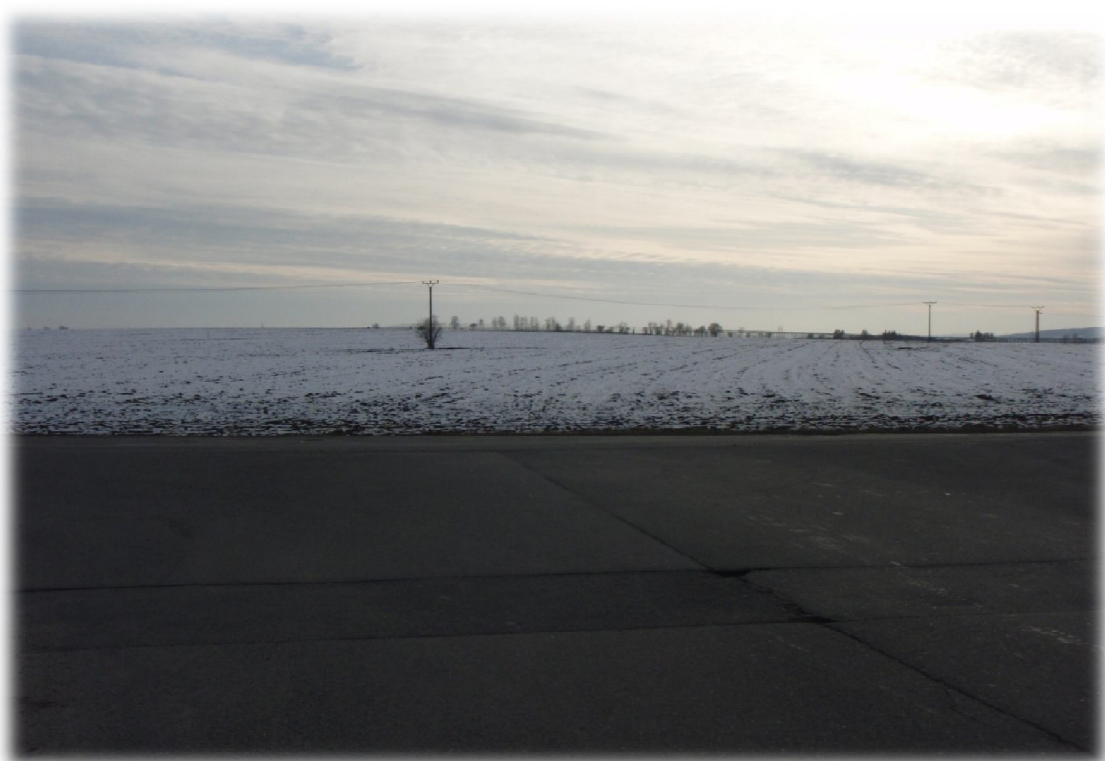
(3) Zájmové území - pohled na napojení stávajícího stavu na nový pomocí stykové křižovatky