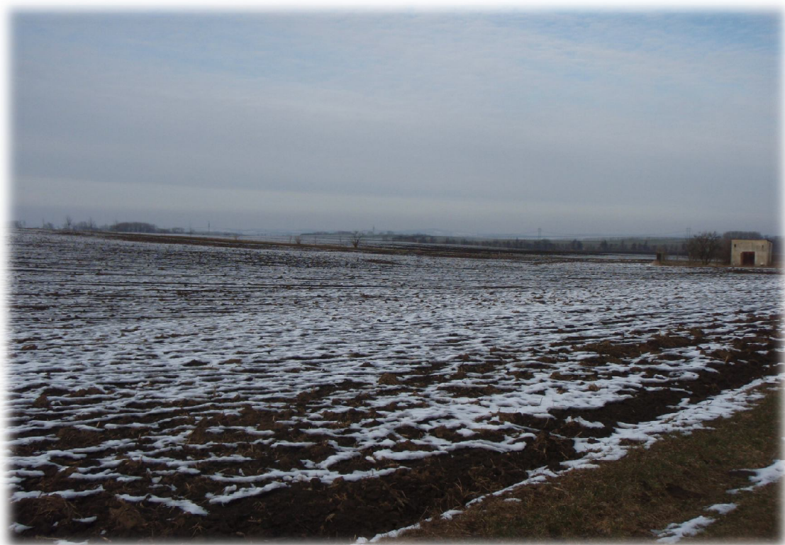
(19) Zájmové území východně od křížení s vodotečí 2