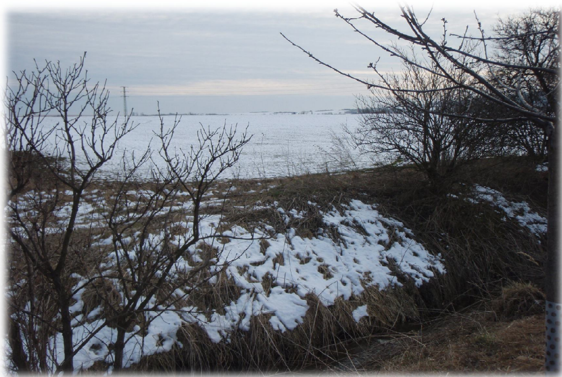
(20) Zájmové území západně od křížení s vodotečí 2