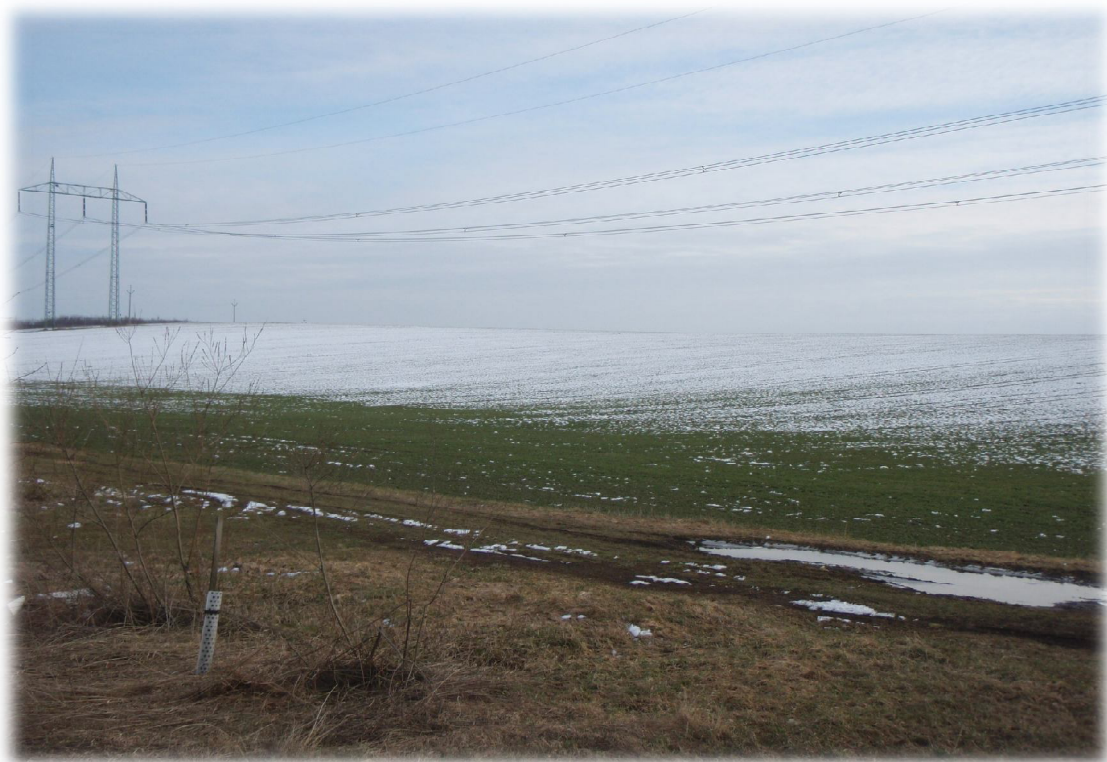
(9) Zájmové území východně od křížení s II/570