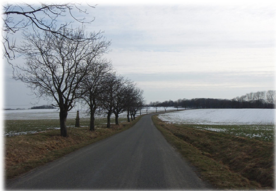
(5) Pohled na křížení 1 s komunikací III. třídy jižně od Hněvotína