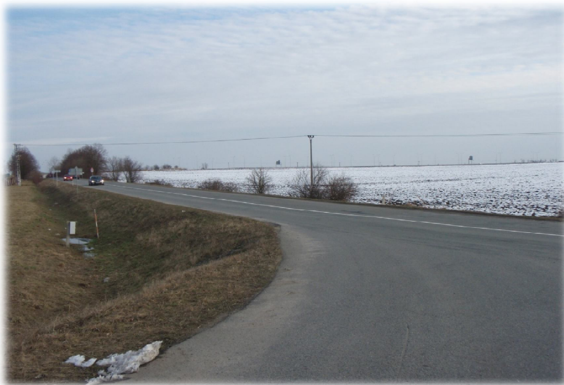
(2) Pohled na začátek úseku