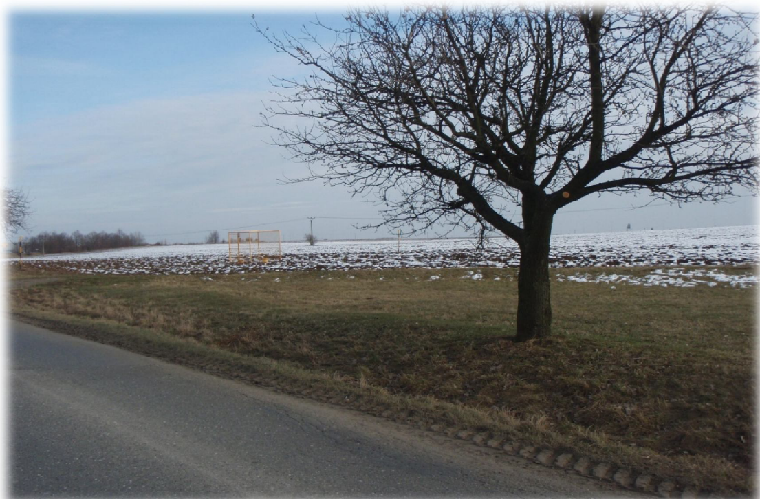
(4) Pohled ve směru přeložky komunikace II/570