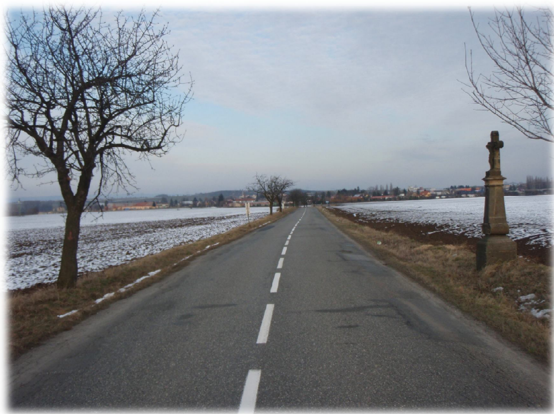
(21) Konec úseku