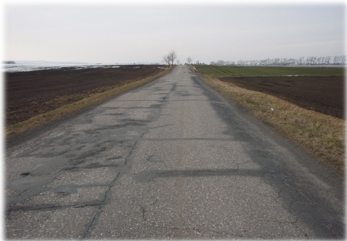
(15) Pohled na křížení 2 s komunikací III. třídy