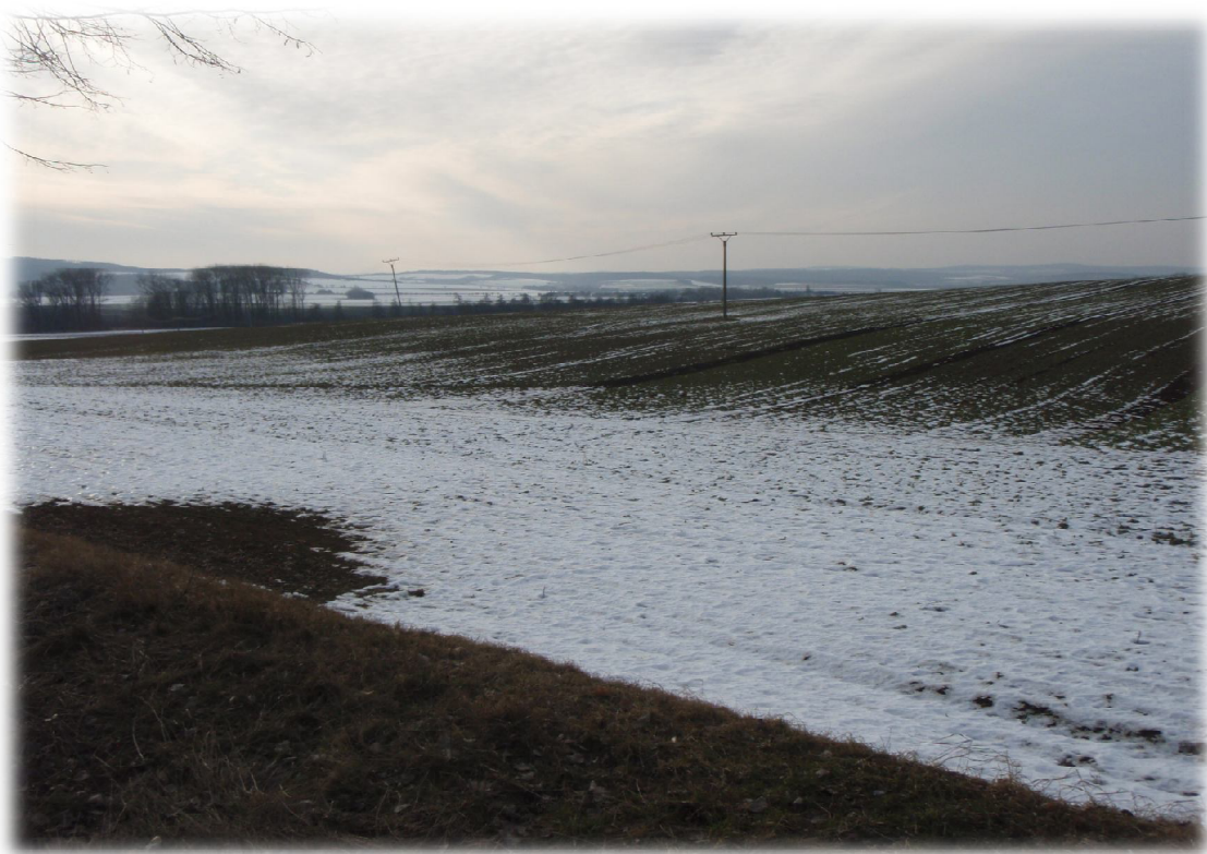
(10) Zájmové území západně od křížení s II/570