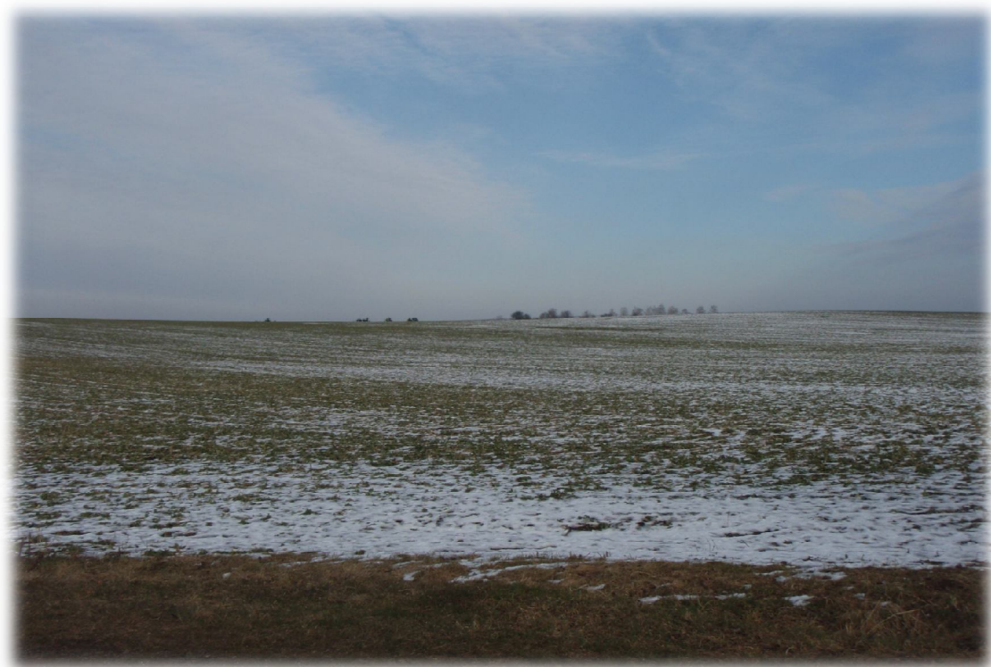
(6) Křížení 1 s komunikací III. třídy – pohled na východ