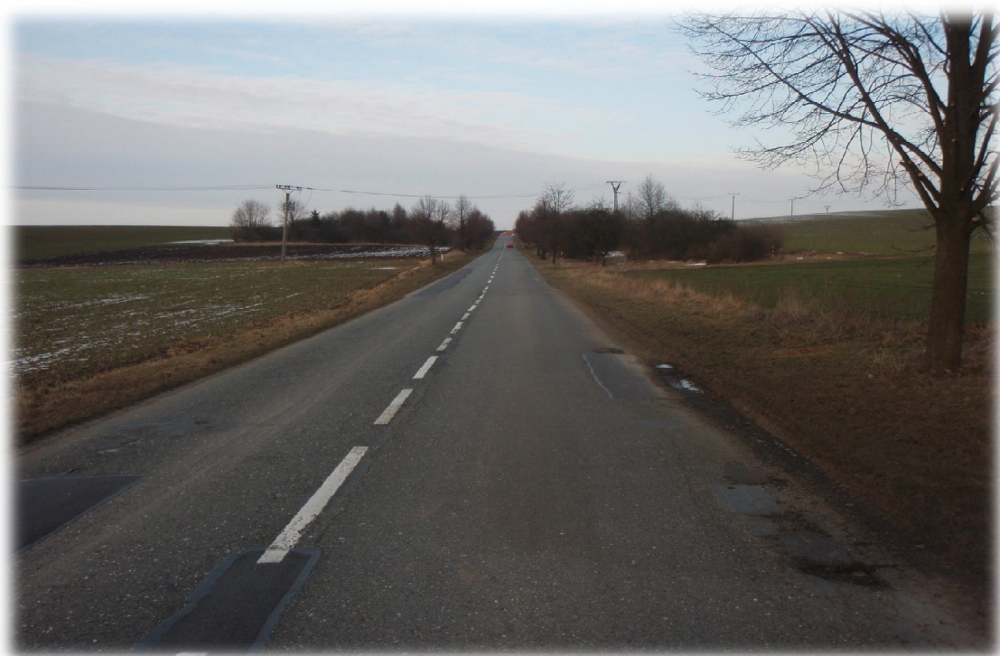
(8) Pohled na křížení s komunikací II/570