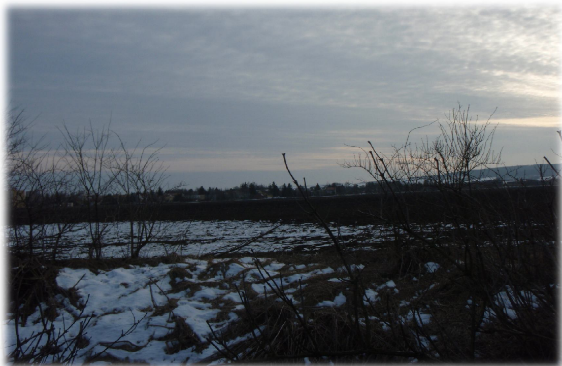
(14) Zájmové území západně od křížení 1 s vodotečí