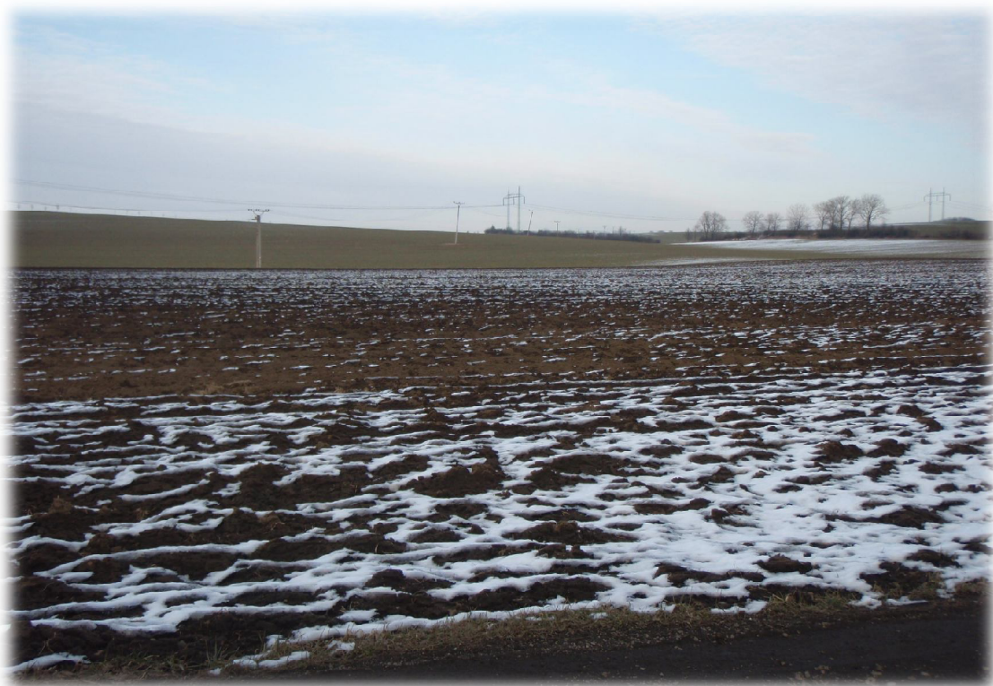
(13) Zájmové území východně od křížení s vodotečí 1