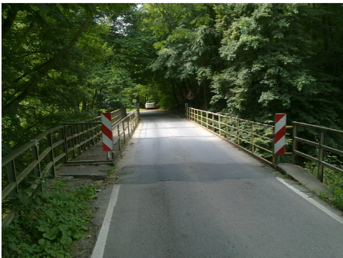
Obr. 1: Most určený k demolici [zdroj: [35]]

Demolice stávajícího mostu proběhne až po výstavbě mostu nového. Během výstavby bude stávající most využíván k převedení dopravy s dopravním omezením. Zároveň bude muset před výstavbou nového mostu, být ubourána část stávajícího mostu, což vyvolá zpřísnění dopravního omezení. Součástí tohoto stavebního objektu je i úprava koryta řeky Svitavy dle požadavků a dokumentace povodí Moravy.