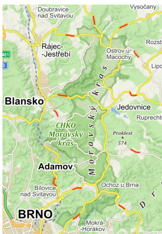
Obr. 5: Mapa hlavních příjezdových cest do CHKO Moravský kras

Dle výzkumu návštěvnosti CHKO Moravský kras, z roku 2019 [31], je vypočtená průměrná roční návštěvnost v období 2010 až 2018, celkem 335 893 návštěvníků. Bylo by pošetilé předpokládat, že všichni tito návštěvníci cestují silniční dopravou, a ještě pošetilejší by bylo předpokládat, že všichni využijí k dopravě hodnocený úsek. Z dotazníkového šetření uvedeného ve výzkumu [31] víme, že osobním automobilem do Moravského krasu cestuje 66 % návštěvníků. Další premisou je rovnoměrné rozložení návštěvníků mezi hlavních 12 příjezdových cest do CHKO Moravský kras, jak je znázorněno na obrázku níže.