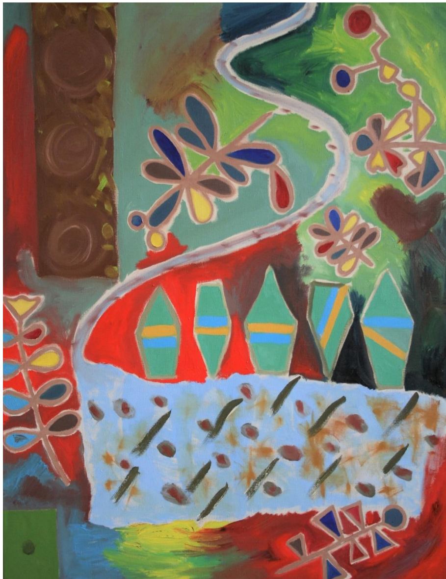
Vosy nad koláčem, duben 2021, olej na plátně, 135x105 cm