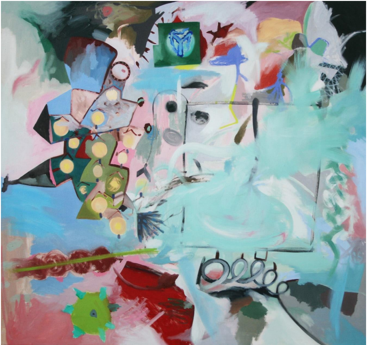
Pověří, květen 2021, olej na plátně, 170x180 cm