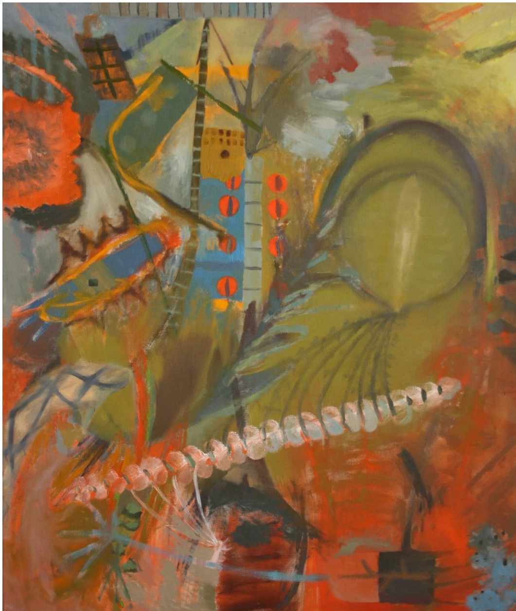
Světlo, duben 2021, olej na plátně, 130x110 cm