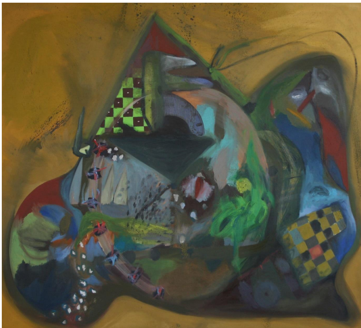
Harlekýn, květen 2021, olej na plátně, 190x170 cm