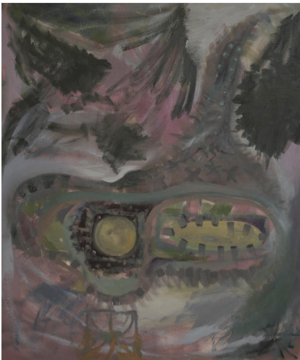
Neznámo odkud - Neznámo kam, duben 2021, olej na plátně, 130x110 cm