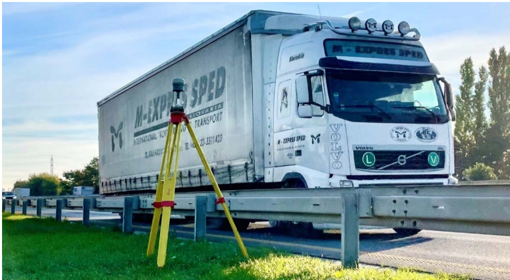
Obr. 4 Umiestnenie rovera pri diaľnici počas kontroly používania rušičiek.

Na Obr. 5 hore je graf zobrazujúci počet družíc počas vykonaného 5 hodinového statického merania. Na grafe je identifikovaných a zelenými šípkami zobrazených minimálne 5 výrazných poklesov v počte družíc, ktoré podľa našich skúseností popísaných v kapitole 4.1 evokujú vplyv použitia rušičky práve prechádzajúcim vozidlom. Na Obr. 5 dole je zobrazený jeden z identifikovaných poklesov, kde za 30 sekúnd počet družíc klesol z 32 družíc na 3 družice. Tento fakt signalizuje, že vozidlo s rušičkou sa najprv približovalo k roveru a následne sa od neho vzdalo.