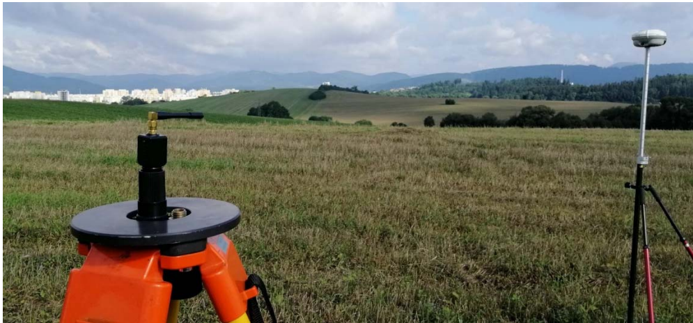
Obr. 2 Test dosahu rušičky.

Test prebiehal postupným vzdáľovaním rovera od rušičky až do momentu, kedy rušička prestala mať vplyv na meranie (Obr. 2).