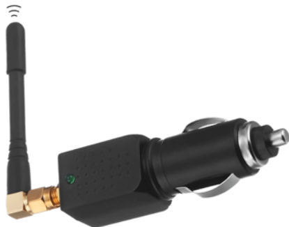
Obr. 1 Rušička GNSS signálu.

Rušička GNSS signálu vysiela šum na rovnakých frekvenciách ako GNSS signál, pričom výkon rušičky je väčší ako výkon skutočného GNSS signálu. Prijímač tak začne prijímať signál z rušičky namiesto skutočného signálu. Rušička vysiela šum, čo môže viesť k strate príjmu signálu z družíc. Používanie rušičiek je na Slovensku zakázané Nariadením vlády o sprístupňovaní rádiových zariadení na trh č. 193/2016 Z. z. Aj napriek tejto skutočnosti sú rušičky na našom trhu dostupné. Rušičky sa od seba líšia hlavne dosahom. Pre účely tohto článku sme sa zamerali na rušičky používané vo vozidlách. Od roku 2010 platia na Slovensku vozidlá nad 3,5 tony mýto na základe prejdených kilometrov. Prejdené kilometre sa zaznamenávajú v palubnej jednotke pomocou GPS navigácie. Práve to vedie k zvýšenému používaniu rušičiek GNSS signálu. Pre overenie vplyvu takejto rušičky na geodetické meranie sme zakúpili jednoduchú rušičku ( Chyba! Nenalezen zdroj odkazů. ). Výrobcom uvádzané parametre rušičky sa nachádzajú v (Tab. 1).