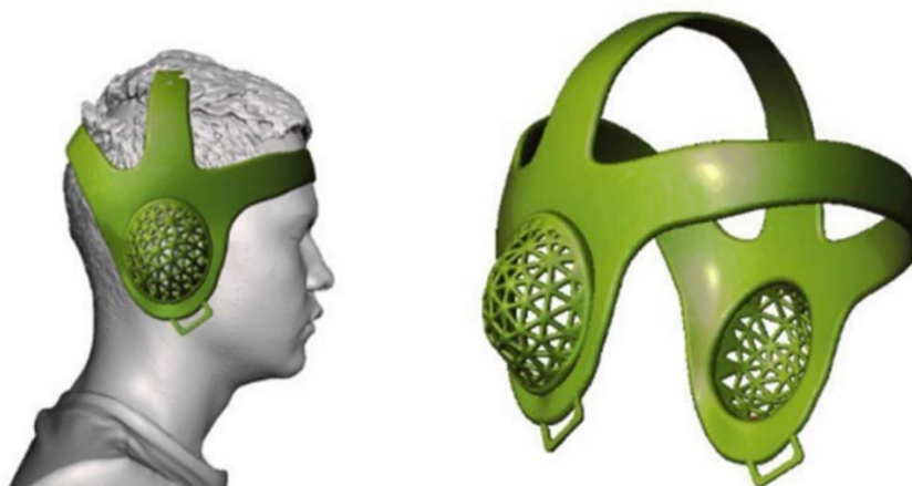
Obrázok 2 Finálny model chrániču uší.