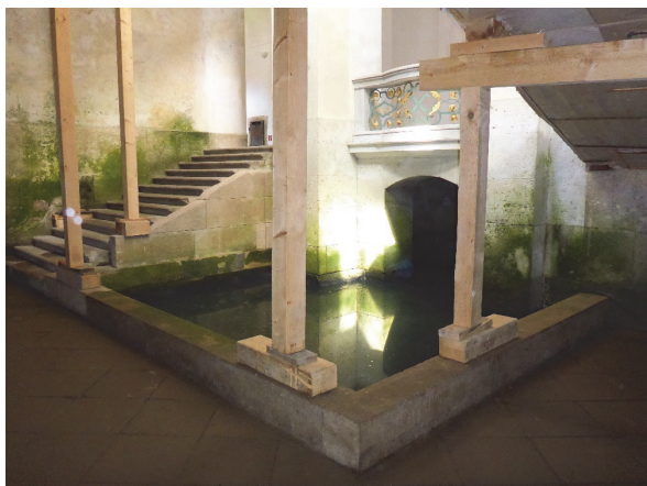
Obrázek 5 – Jižní signální bazén

Jelikož je základová konstrukce částečně nad hladinou podzemní vody, bylo nutné vodu udržet nad základovou konstrukcí. Tomu napomáhají dva základové jílové bazény [9], ve kterých jsou umístěny dubové piloty s roštem. Do bazénů ústila čerstvě přiváděná voda. K zajištění distribuce vody do všech částí základového bazénu jsou pod základovým roštem umístěny dubové tesané žlaby (Obr. 3). Bazény jsou rozděleny na dvě části, které fungují nezávisle na sobě. Pokud se vypustí voda z jednoho základového bazénu, voda ve druhém zůstane. Oba bazény jsou napojeny na regulační šachtu, která výškou přepadu reguluje hladinu vody ve vodním systému.