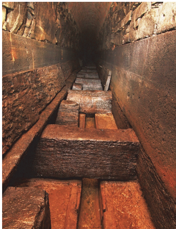
Obrázek 6 – Modrá štola

Vodní systém je pro budovu konventu tak důležitý, že v prostoru zrcadel tříramenných schodišť byly vybudovány signální bazény (Obr. 3 – bod 2 a 3), umožňující revizi základového roštu i kontrolu hladiny vody v systému. Pro obdobný účel byly vybudovány kontrolní šachty na vnějších rozích objektu (Obr. 3 – bod 6) a Modrá štola (Obr. 3 – bod 4), odhalující další část dubového roštu.