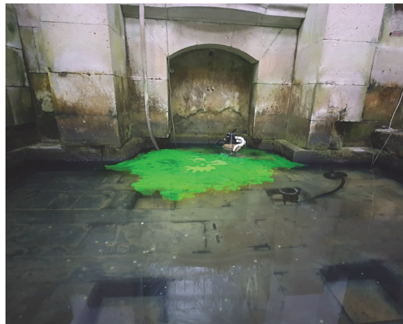
Obrázek 8 – Klášter Plasy – Severní signální bazén, aplikace uraninu

Po částečné obnově přetlakového vodního systému bylo do severního signálního bazénu aplikováno xanténové fluorescenční barvivo tzv. uranin.