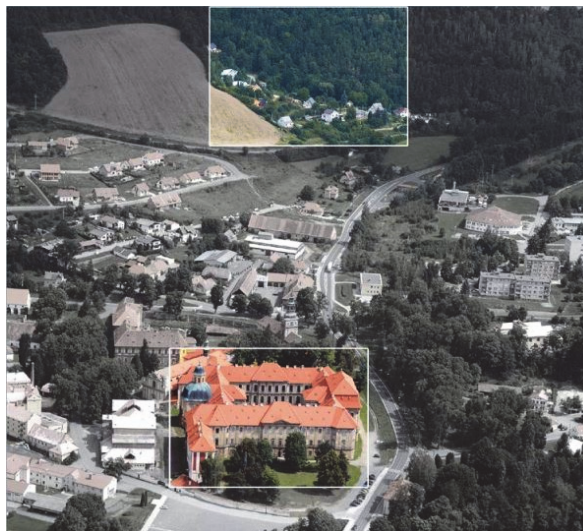
Obrázek 4 – Lokalizace místa jímání vody z pramene

Voda byla pro život v klášteře velice důležitým prvkem a pro cisterciácký řád obzvlášť. Vodu z řeky Střely mniši využívali primárně jako užitkovou a pro pohon mlýnských kol. Pro konzervaci základové konstrukce však tuto vodu nepovažovali za dostatečně kvalitní. Proto byla kvalitní voda přiváděna aquaduktem a vodovody ze tří pramenů vzdálených až dva kilometry [7]. Tím byl zajištěn neustálý přívod čisté studené vody. V období sucha se voda dovážela i z větších vzdáleností a pomocí napouštěcí a filtrační místnosti (Obr. 3 – bod 7) udržovala základovou konstrukci pod vodní hladinou.