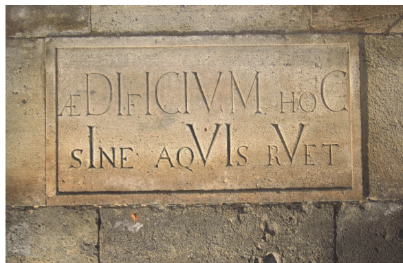
Obrázek 2 – Klášter Plasy – kryptogram v severním signálním bazénu „bez vody se stavba zřítí“

Jedinečnost založení kláštera nepramení z použití dřevěných základů a roštu, ale z použití tohoto způsobu založení částečně nad hladinou podzemní vody. Proto je vodní systém kláštera nejdůležitějším prvkem stavby, jak potvrzuje kryptogram s latinským nápisem „Aedificium hoc sine aquis ruet“ (r. 1790) v překladu „Bez vody se tato stavba zřítí“ umístěný v jednom z kontrolních bazénů. Důležitou částí kláštera je i ventilační systém, který zabráňuje pronikání vlhkosti z terénu rajského dvora uprostřed konventu do zdiva kláštera a podporuje jeho vysoušení.