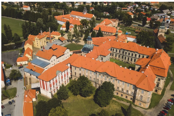
Obrázek 1 – Cisterciácký klášter Plasy

Barokní klášter Plasy, umístěný v údolní nivě řeky Střely, byl založen na zvodnělých nivních sedimentech, půdách nevhodných pro zakládání velkých staveb. Umístění kláštera však bylo pragmatickým rozhodnutím cisterciáckých mnichů. Jednak byli zvyklí na vodu ideálně proudící napříč klášterní obcí, jednak jim zbylo více obdělávatelné úrodné půdy. To předurčilo na 17. století velice odvážný a unikátní způsob založení kláštera na 5100 dubových pilot a roštu. Autorem návrhu je architekt Jan Blažej Santini-Aichel (1667–1723) [1].