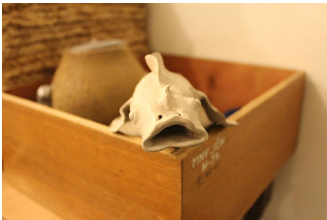
detail z průběhu instalace, říjen 2013