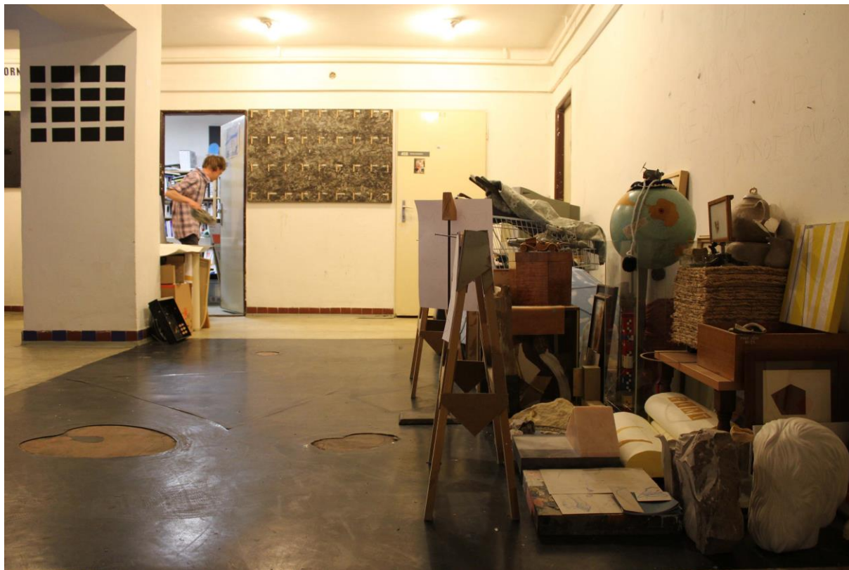
pohled na instalaci v prostoru, květen 2014

Zatím dobrý, různé objekty – dřevo, keramika, kámen, plasty, látky, sádra, sklo, malba – olej na plátně a dřevěné desce, kresba na papíře a autorské tisky, fotografie, LCD monitor zobrazující dokumentaci, rozměry variabilní“, 2013 – 2014 (září 2013 – září 2014, 3. patro budovy FaVU, Údolní 495/19, Brno)