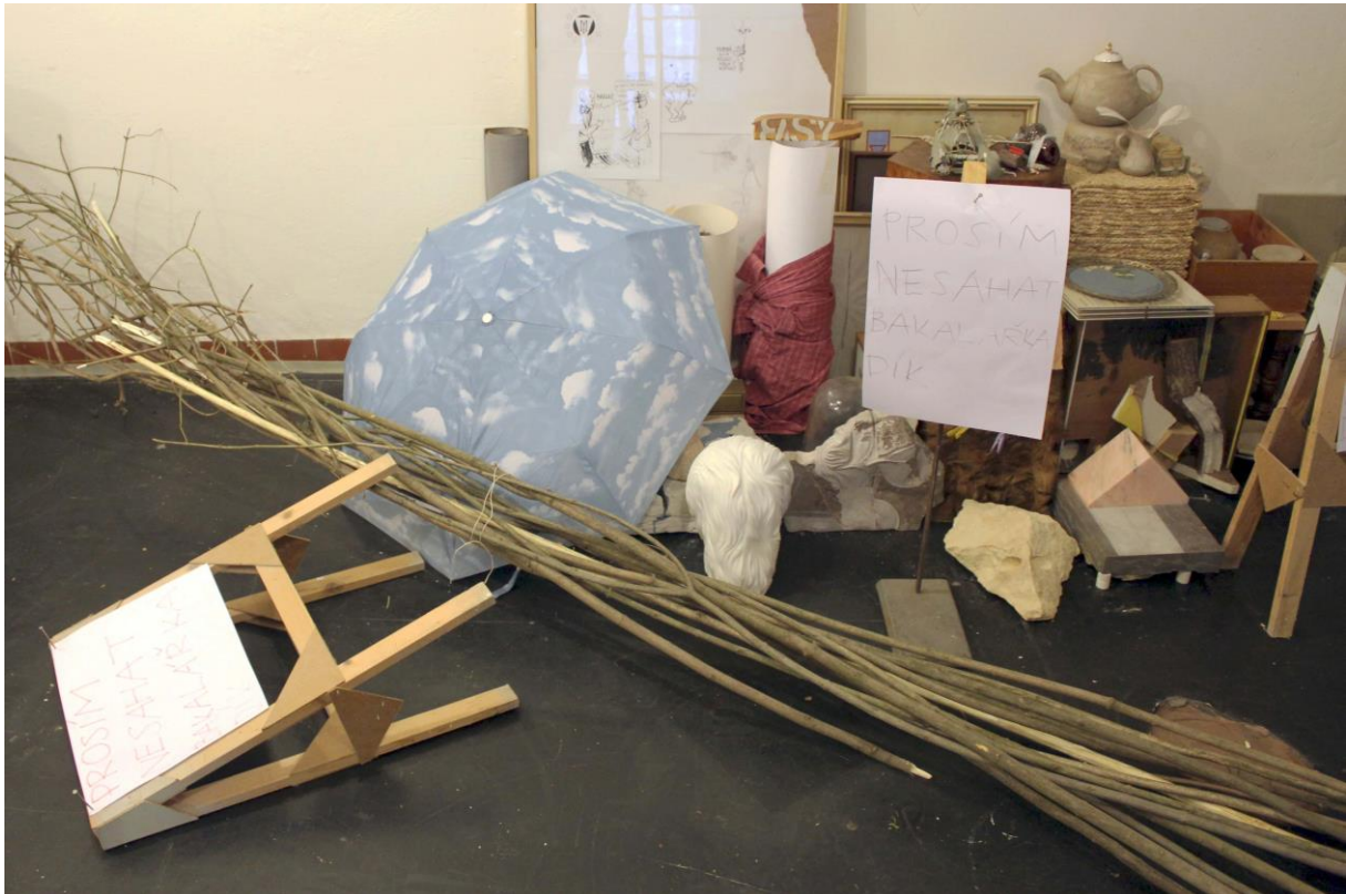
dokumentace poškození instalace neznámým pachatelem, březen 2014