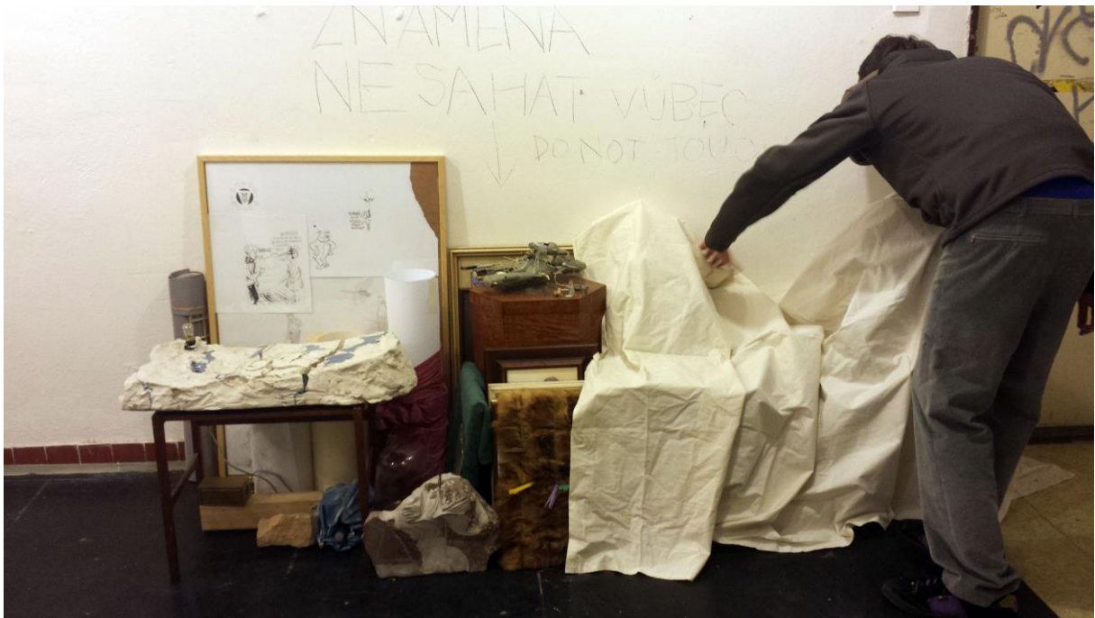
Dokumentace průběžné údržby rostoucí instalace, leden 2014