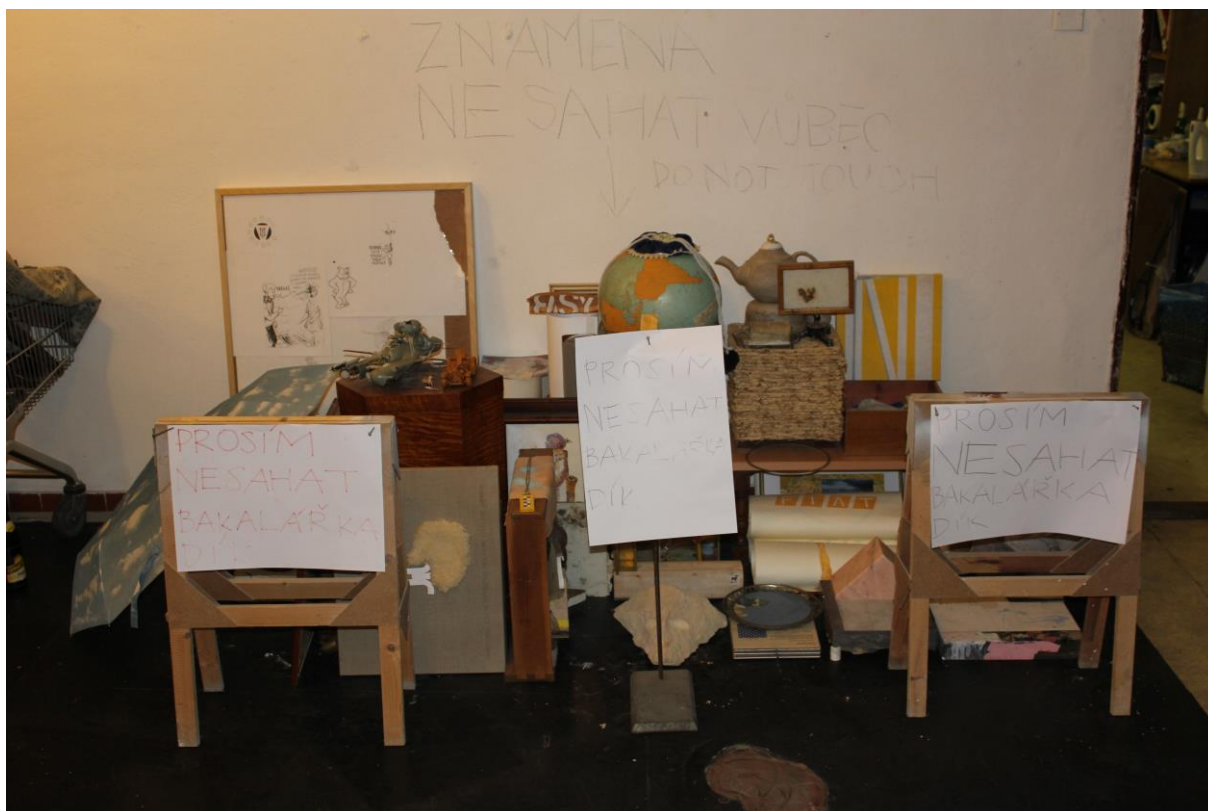
dokumentace funkčního celku, duben 2014

Práce “Zatím dobrý“ je ve své podstatě organizační muštr, způsob vypořádání se s každodenní, zdánlivě bezcílnou tvorbou pro osobní uspokojení – tj. bez požadavku na konceptuální premisu či cílené vyjádření se k danému problému, ať už je jakýkoliv. Dalo by se říci, že se jedná o formu dlouhodobě rostoucí, mutující a přemístitelné instalace, která je neustále doplňována o nové prvky, které ovšem vznikají nezávisle na ní.