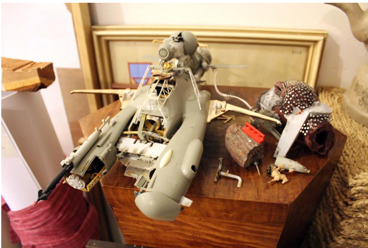
detail z průběhu instalace, duben 2014