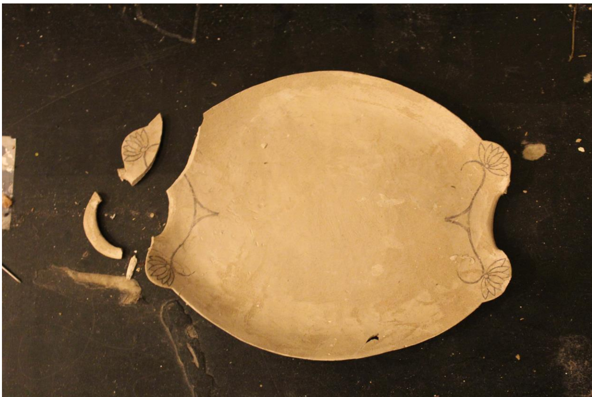
dokumentace objektu poškozeného při manipulaci v rámci reorganizace instalace, prosinec 2013