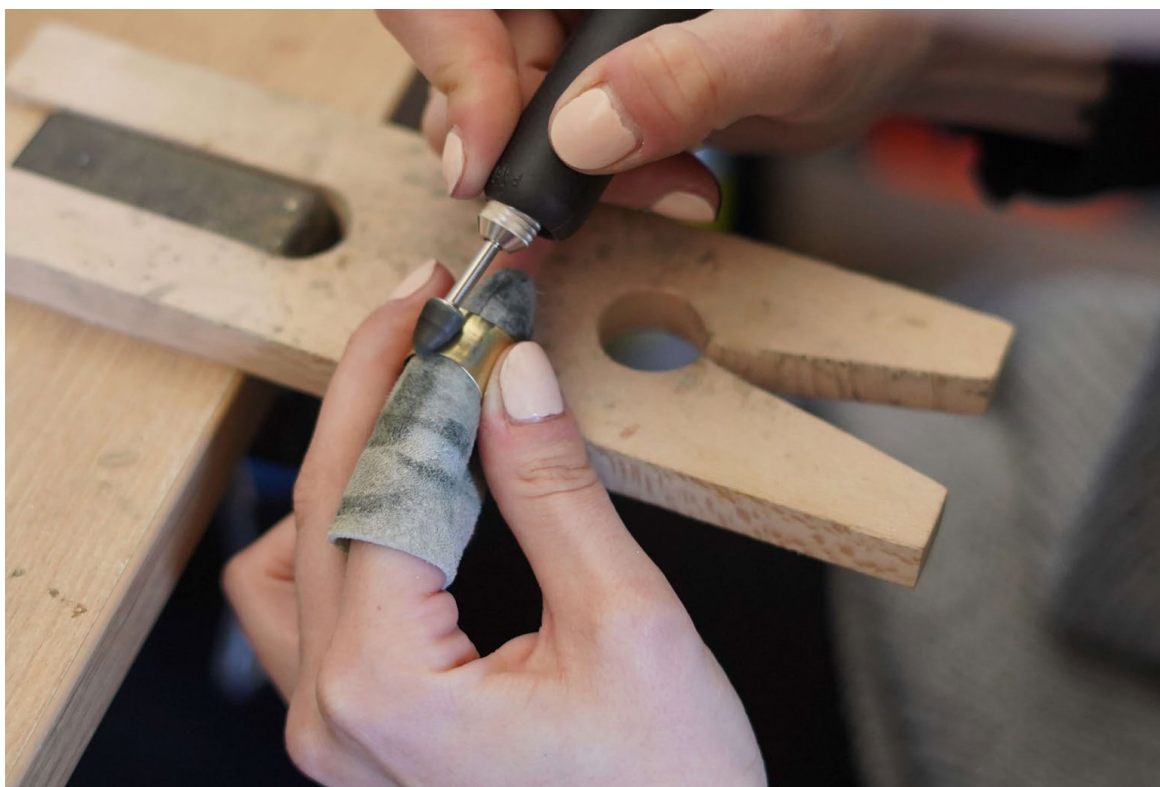
Ilustrace 17: Leštění