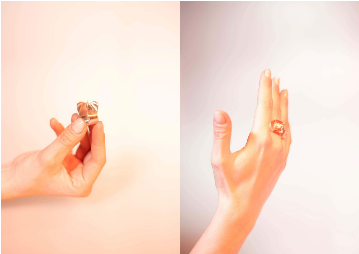
Ilustrace 7: Materiál: stříbro, 26x20x15 mm, Foto: Štěpánka Trčková