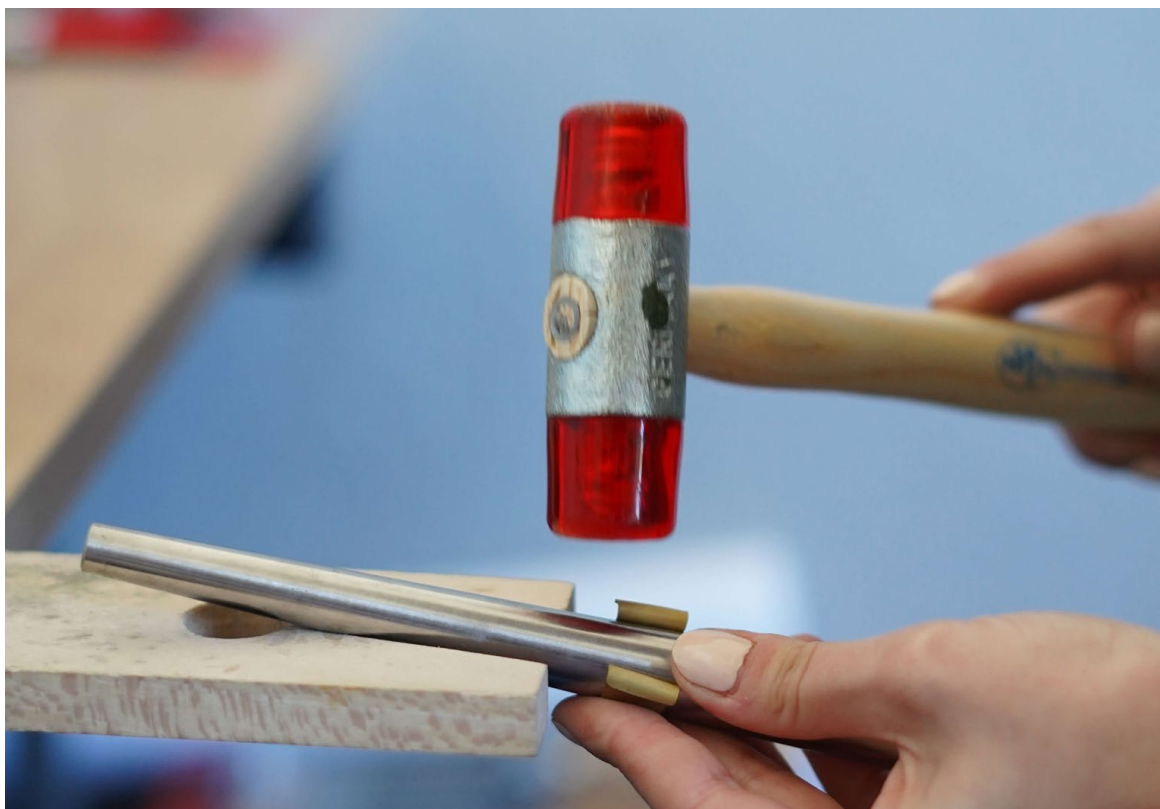
Ilustrace 16: Tvarování, Foto: Štěpánka Trčková