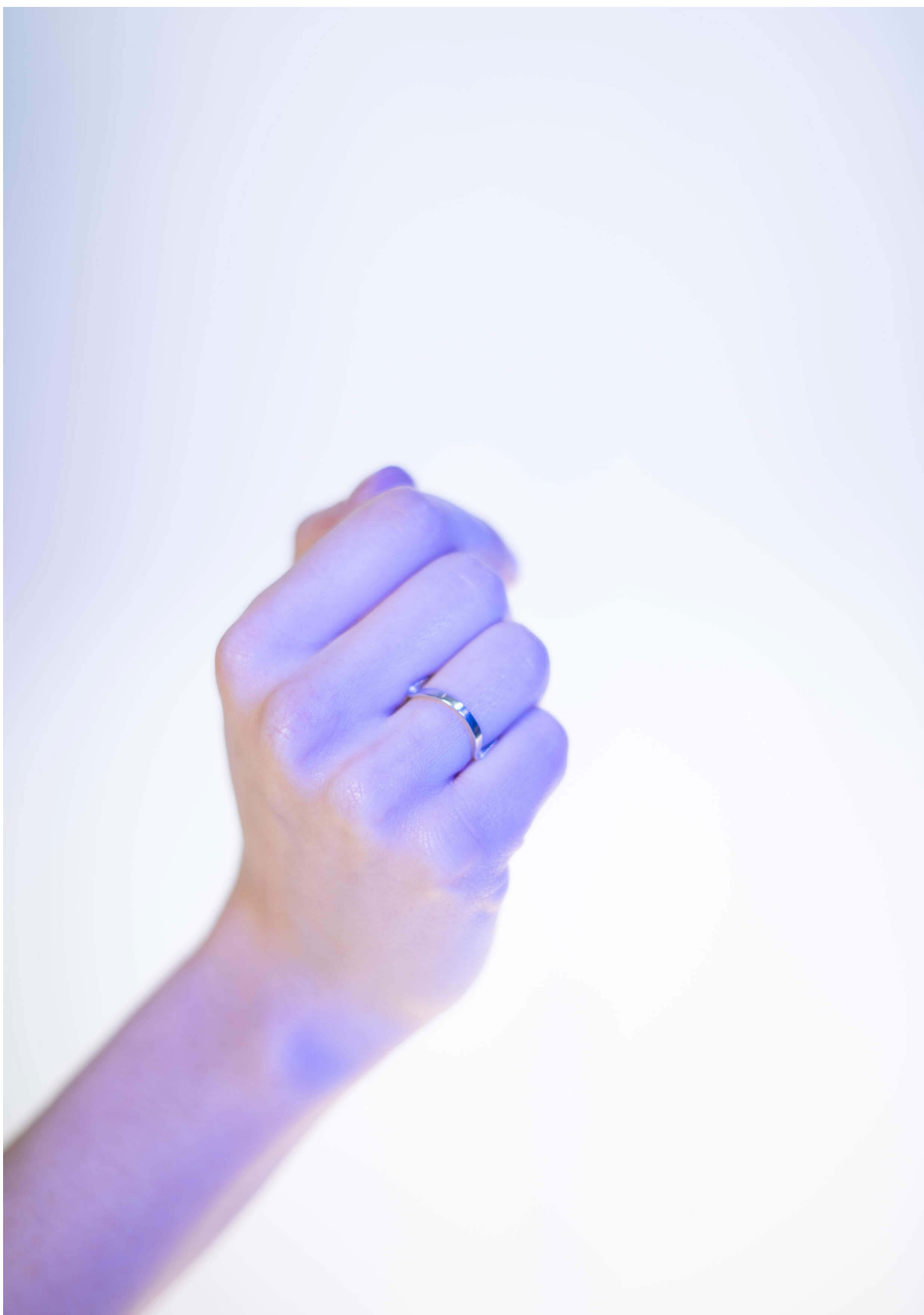
Ilustrace 1: Pozice II.