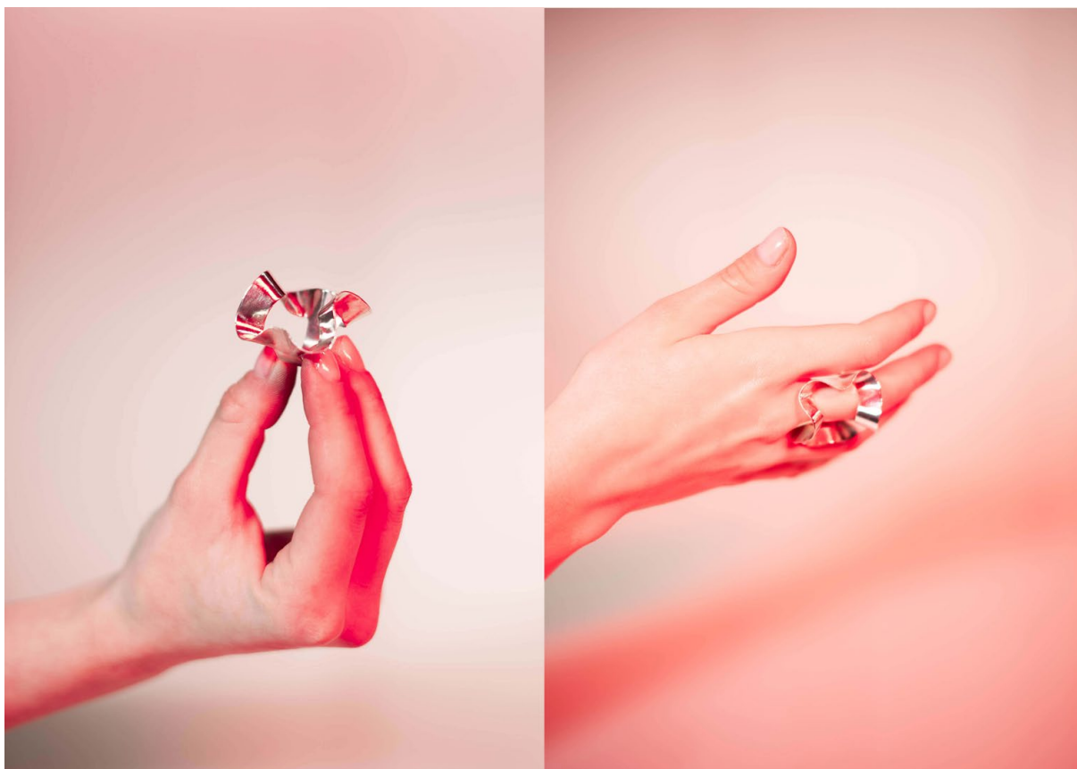
Ilustrace 9: Materiál: stříbro, 32x30x30mm