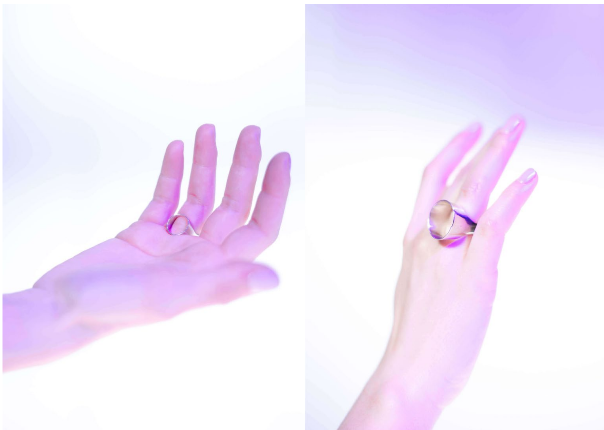
Ilustrace 11: Materiál: stříbro, 30x20x15mm, Foto: Štěpánka Trčková