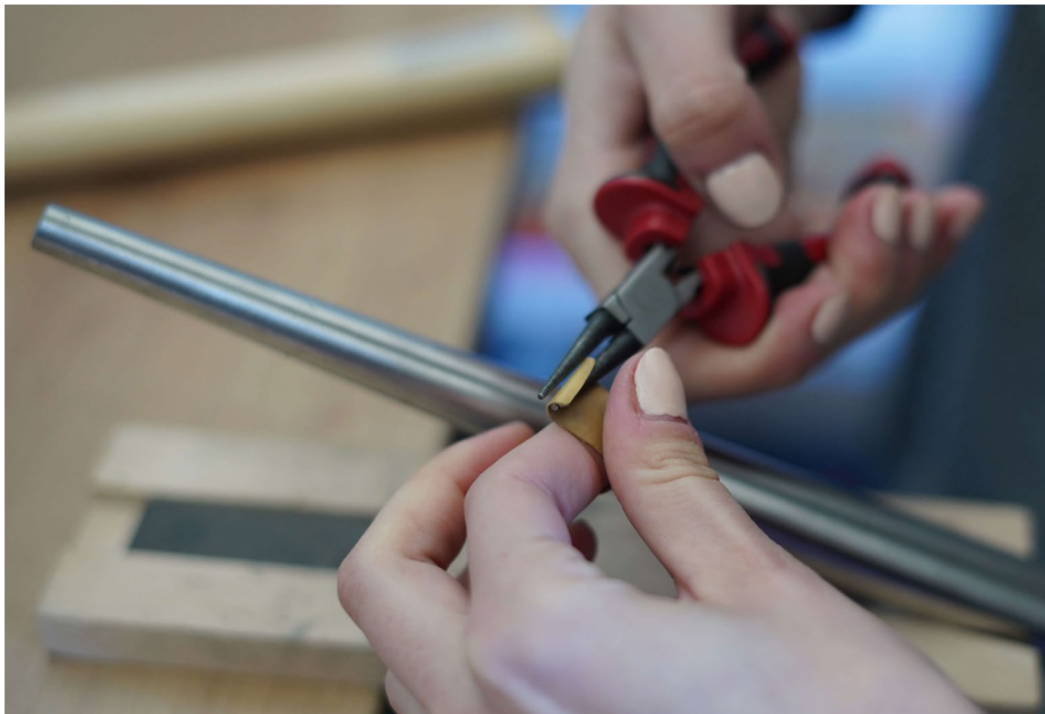
Ilustrace 15: Tvarování