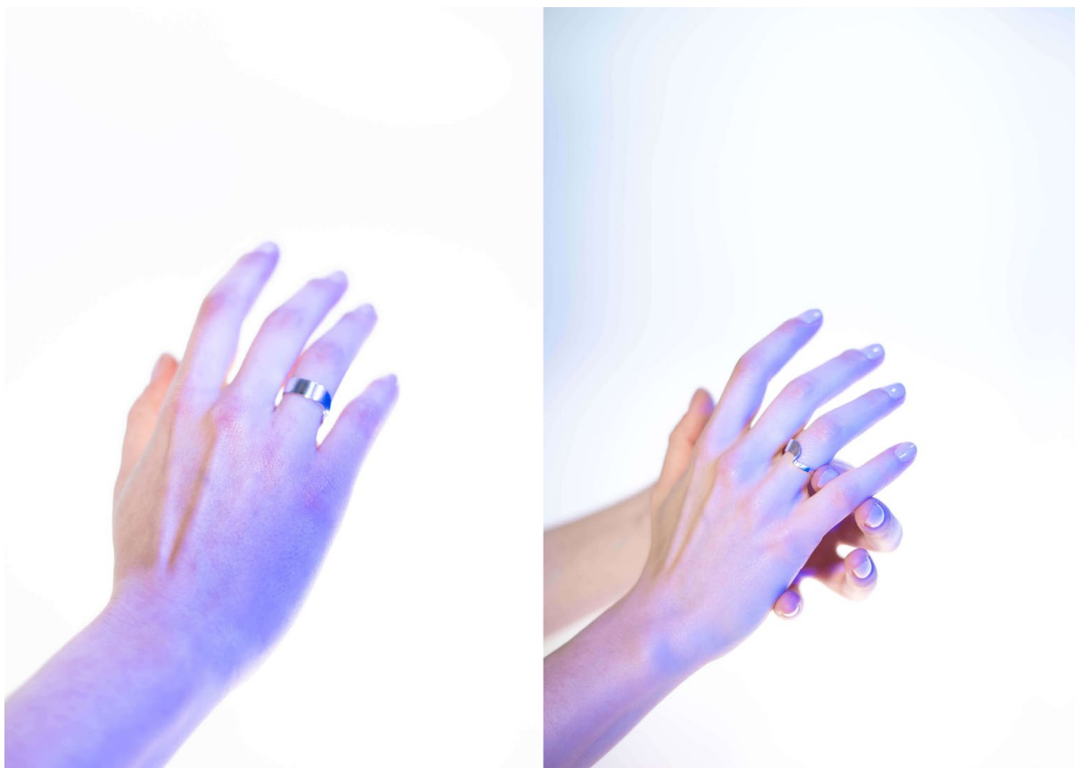
Ilustrace 10: Materiál: stříbro, 20x22x5mm