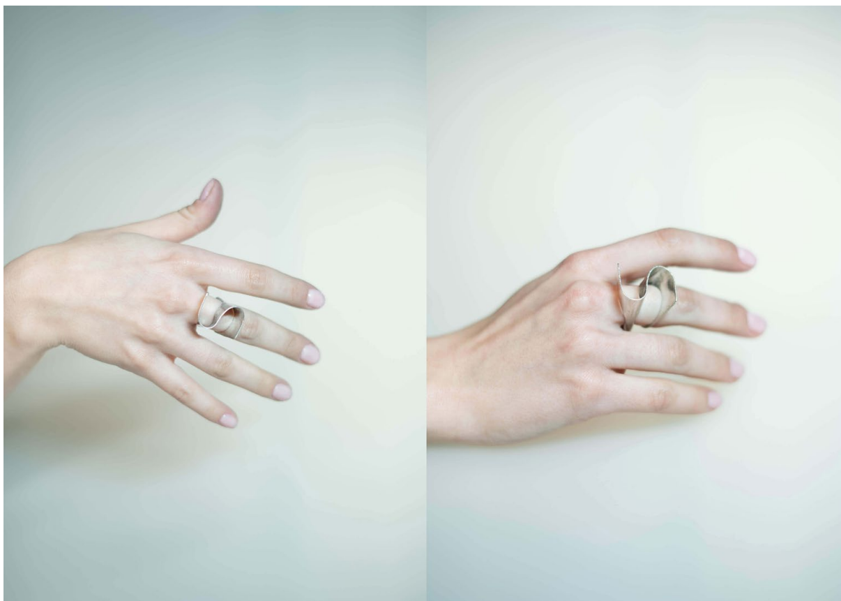
Ilustrace 6: Materiál: stříbro, 30x25x25mm