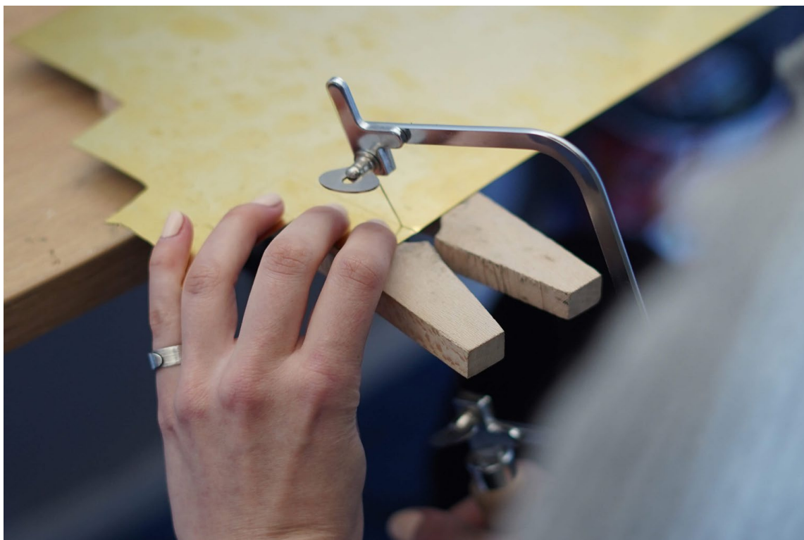
Ilustrace 12: Vyříznutí požadovaného tvaru