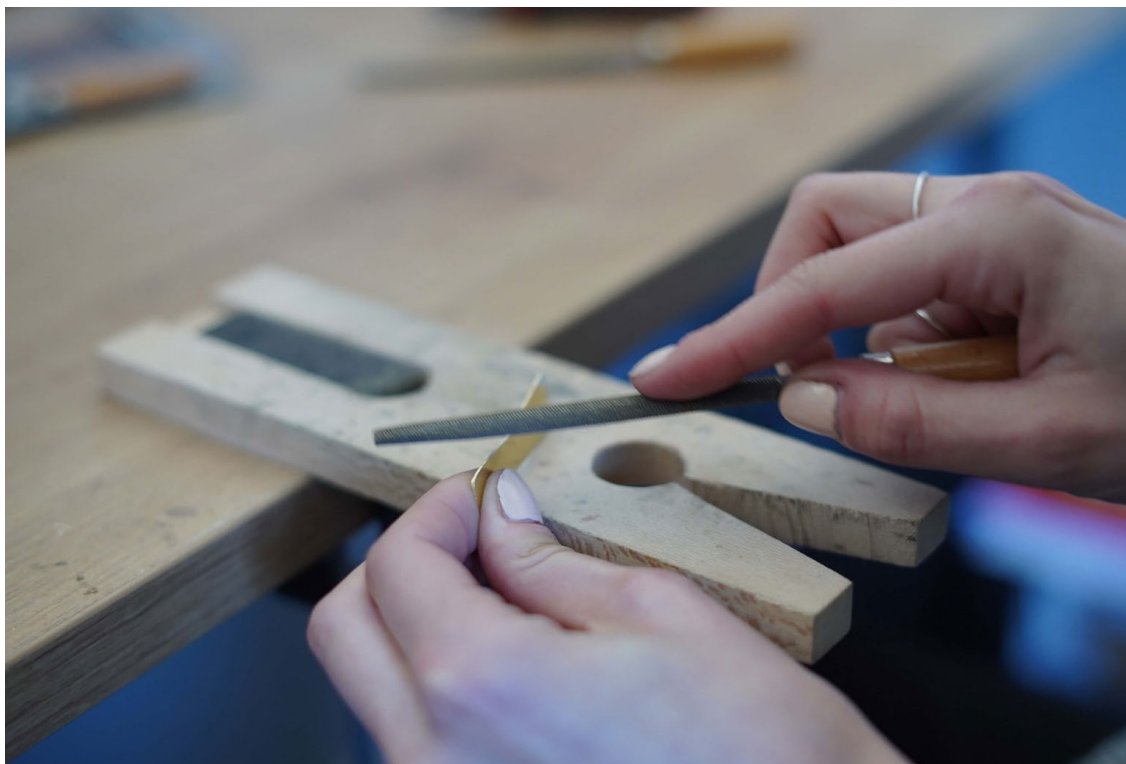
Ilustrace 13: Pilování, Foto: Štěpánka Trčková