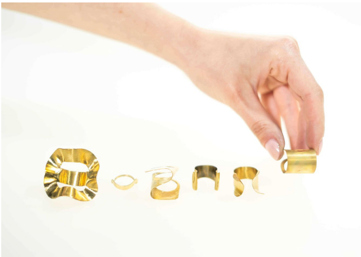
Ilustrace 3: Mosazné prsteny