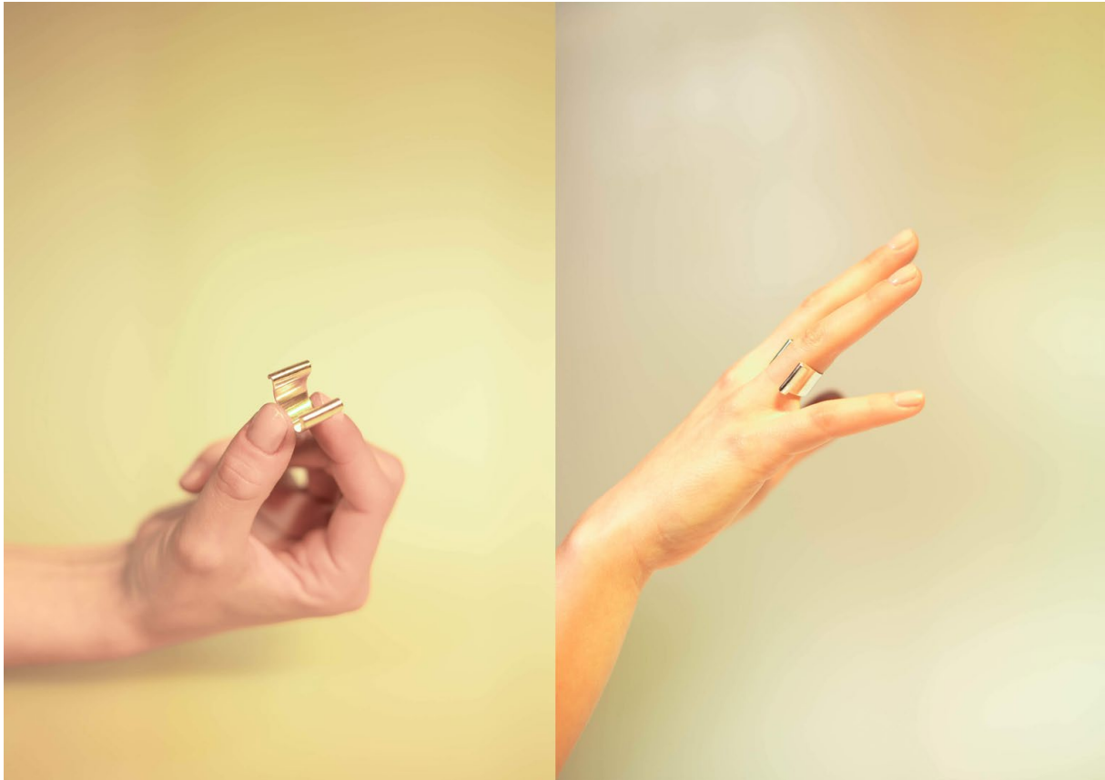
Ilustrace 8: Materiál: stříbro, 20x20x15mm, Foto: Štěpánka Trčková