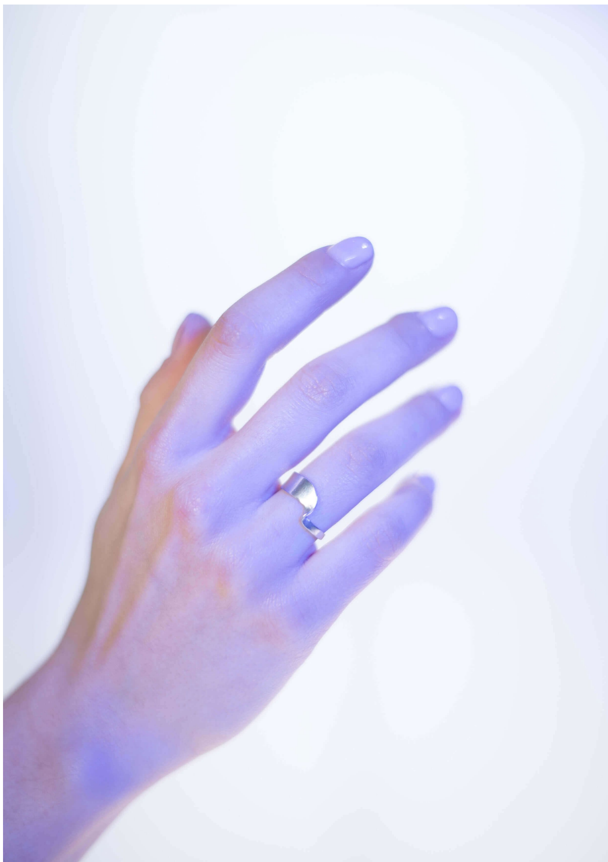
Ilustrace 2: Pozice III.