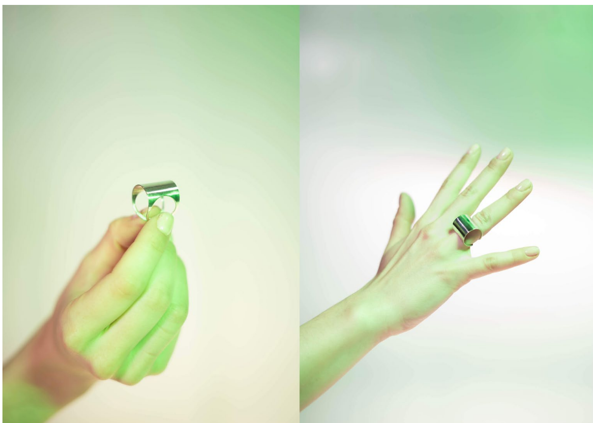
Ilustrace 5: Materiál: stříbro, 20x20x25mm, Foto: Štěpánka Trčková