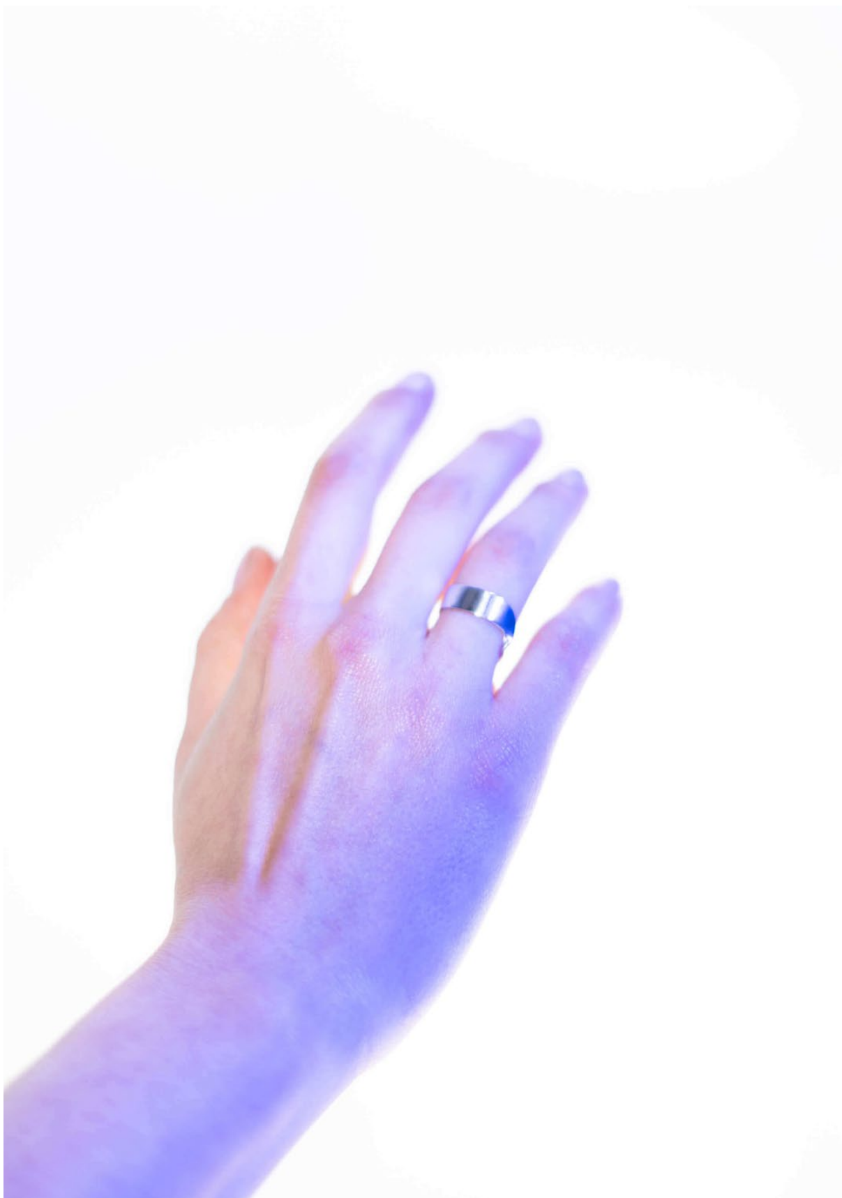
Ilustrace 1: Pozice I.