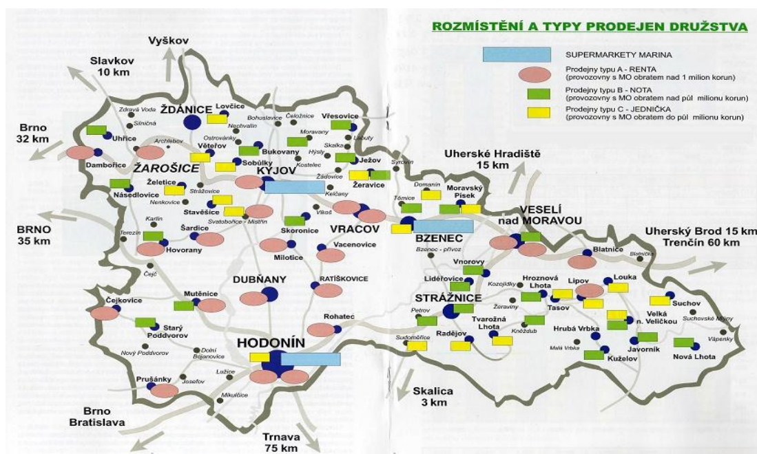
Obr. 2: Rozmístění a typy prodejen družstva (Zdroj: 8)