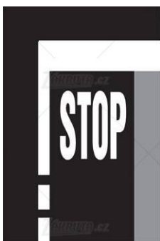
V 6b „Příčná čára souvislá s nápisem STOP“