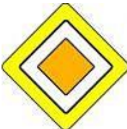
P 2 „Hlavní pozemní komunikace“ na zvýrazněném podkladě