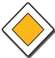
P 2 „Hlavní pozemní komunikace“