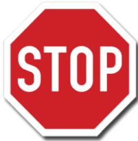
P 6 „Stůj, dej přednost v jízdě!“