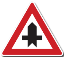
P 1 „Křižovatka s vedlejší pozemní komunikací“