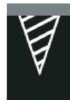
V 13a „Šikmé rovnoběžné čáry“