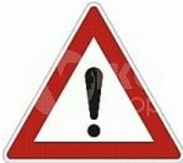
A 22 „Jiné nebezpečí“