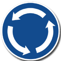
C 1 „Kruhový objezd“