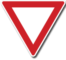
P 4 „Dej přednost v jízdě“