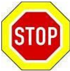
P 6 „Stůj, dej přednost v jízdě!“ na zvýrazněném podkladě