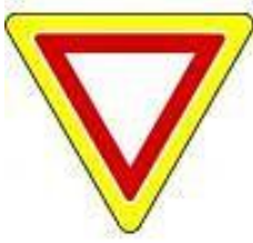
P 4 „Dej přednost v jízdě“ na zvýrazněném podkladě