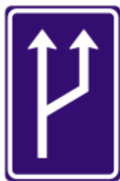
IP 18a „Zvýšení počtu jízdnic pruhů“