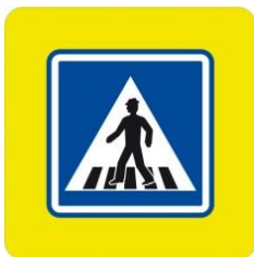
IP 6 „Přechod pro chodce“ na zvýrazněném podkladě