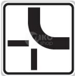
E 2b „Tvar křižovatky“