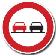
B 21a „Zákaz předjíždění“