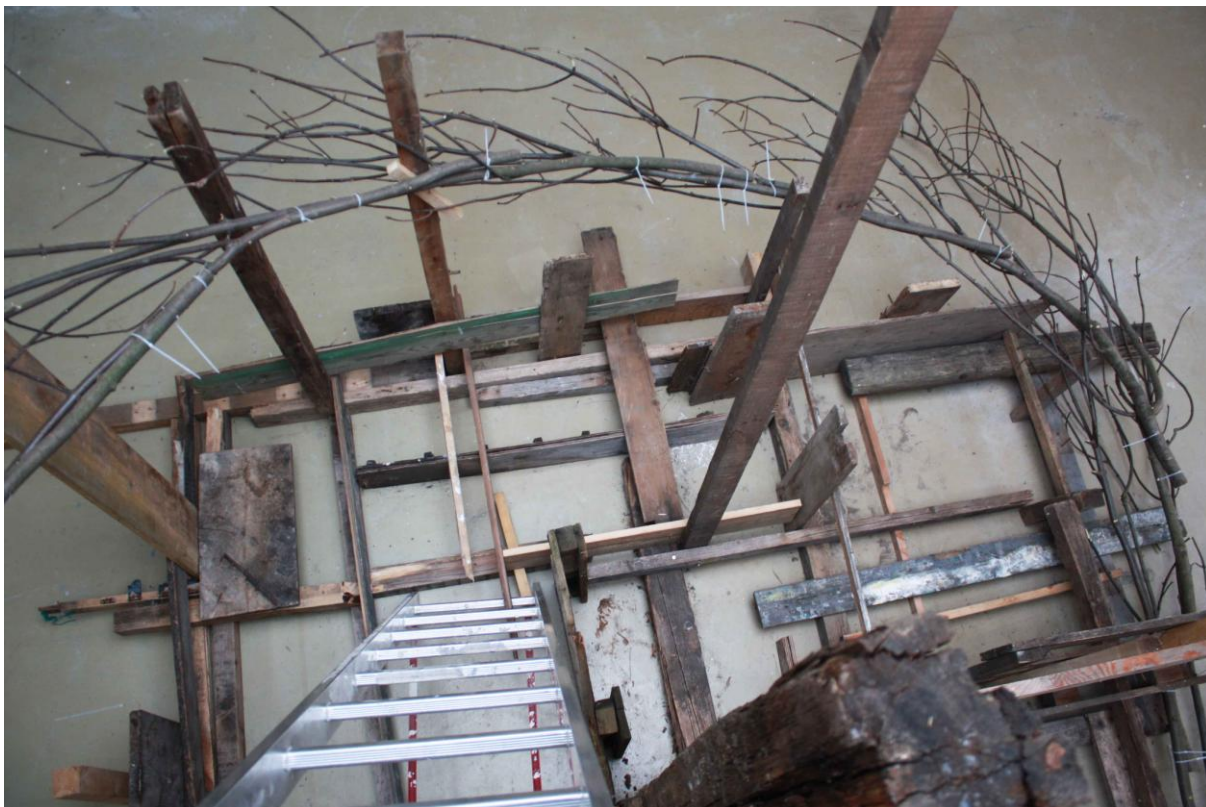
Větvení, instalace v ateliéru Sochařství 2, pohled shora, větve, různé kusy dřeva, vruty, stahovací pásy, přibližně 400x300x300 cm, 2015