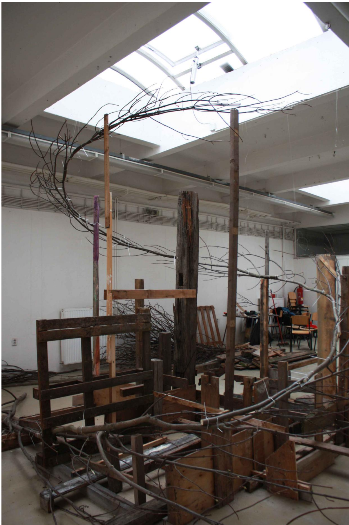
Větvení, instalace v ateliéru Sochařství 2, větve, různé kusy dřeva, vruty, stahovací pásy, přibližně 400x300x300 cm, 2015