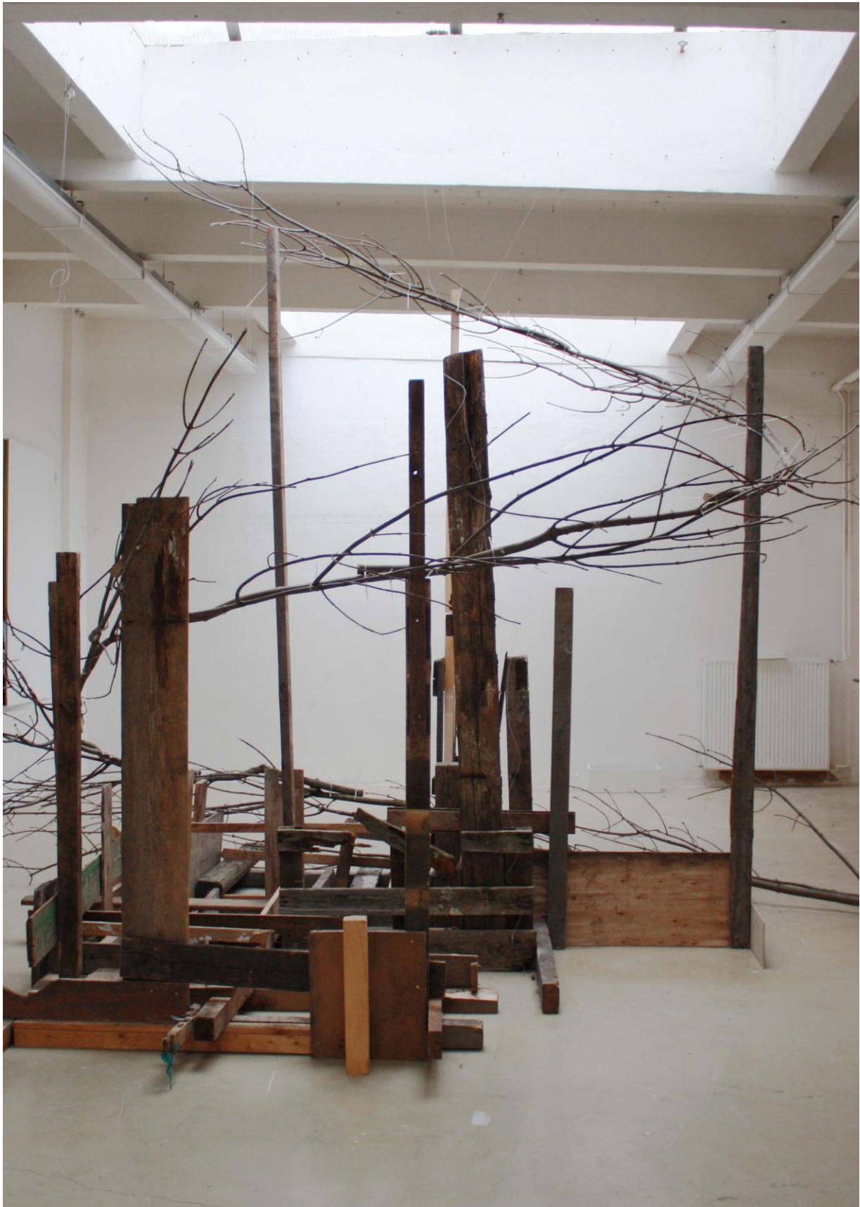
Větvení, instalace v ateliéru Sochařství 2, větve, různé kusy dřeva, vruty, stahovací pásy, přibližně 400x300x300cm, 2015