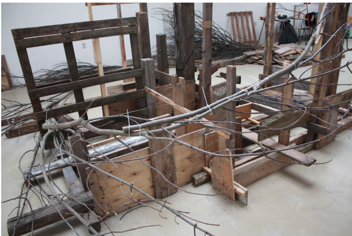
Větvení, instalace v ateliéru Sochařství 2, větve, různé kusy dřeva, vruty, stahovací pásy, přibližně 400x300x300 cm, 2015