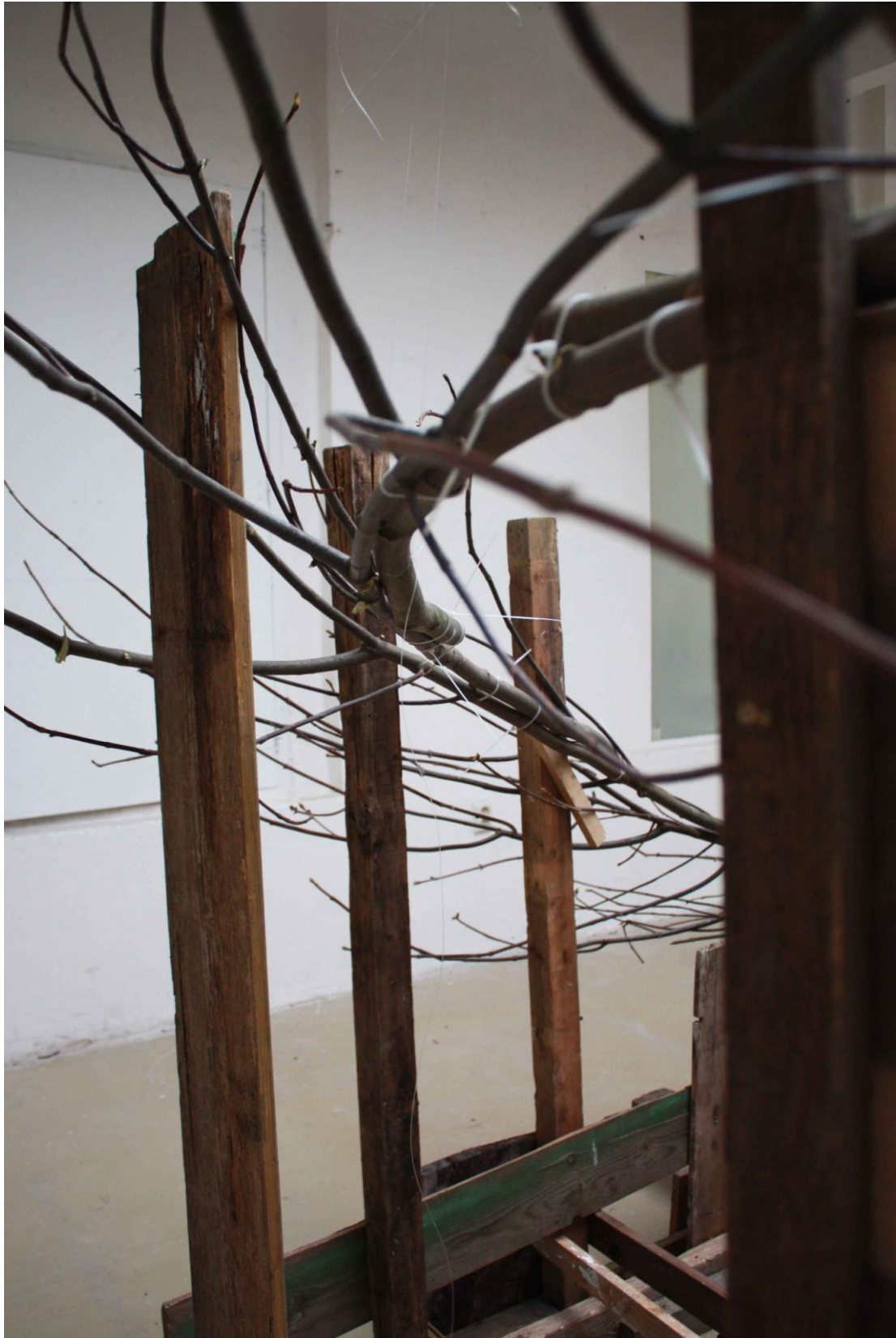
Větvení, instalace v ateliéru Sochařství 2, detail, větve, různé kusy dřeva, vruty, stahovací pásy, přibližně 400x300x300 cm, 2015