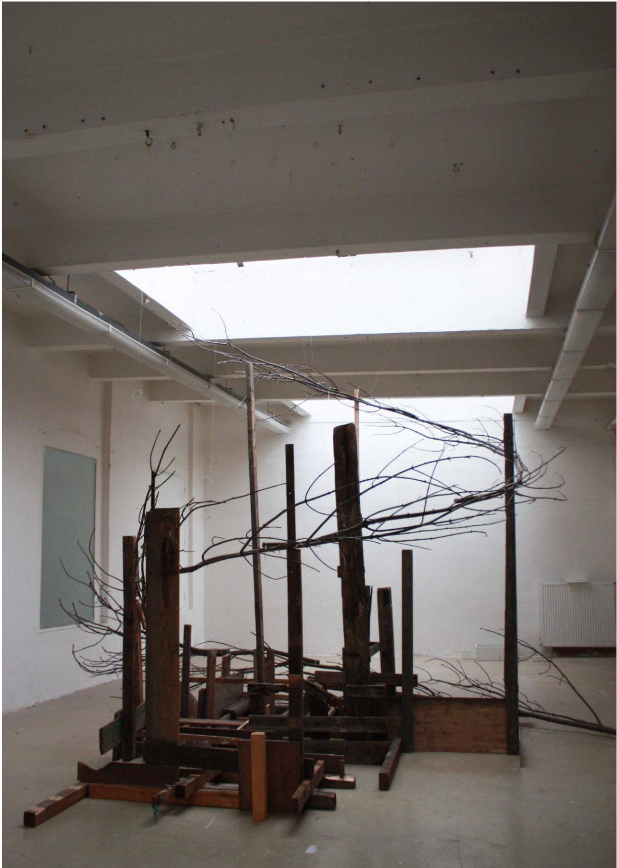
Instalace v ateliéru Sochařství 2, větve, různé kusy dřeva, vruty, stahovací pásy, přibližně 400x300x300 cm, 2015