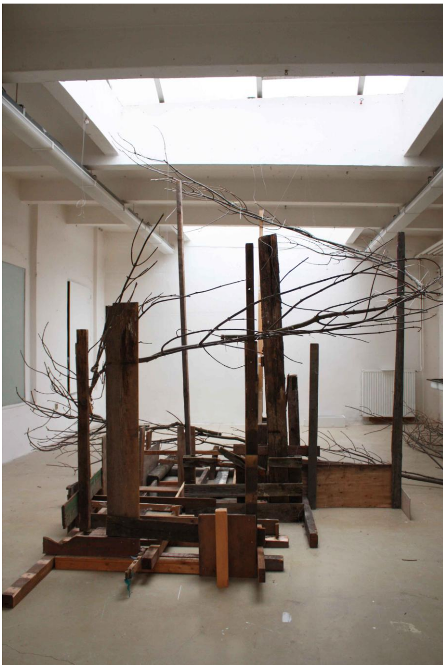
Větvení, instalace v ateliéru Sochařství 2, větve, různé kusy dřeva, vruty, stahovací pásy, přibližně 400x300x300cm, 2015

K obhajobě bylo předloženo 8 fotografií (7 fotografií realizace, 1 skica)